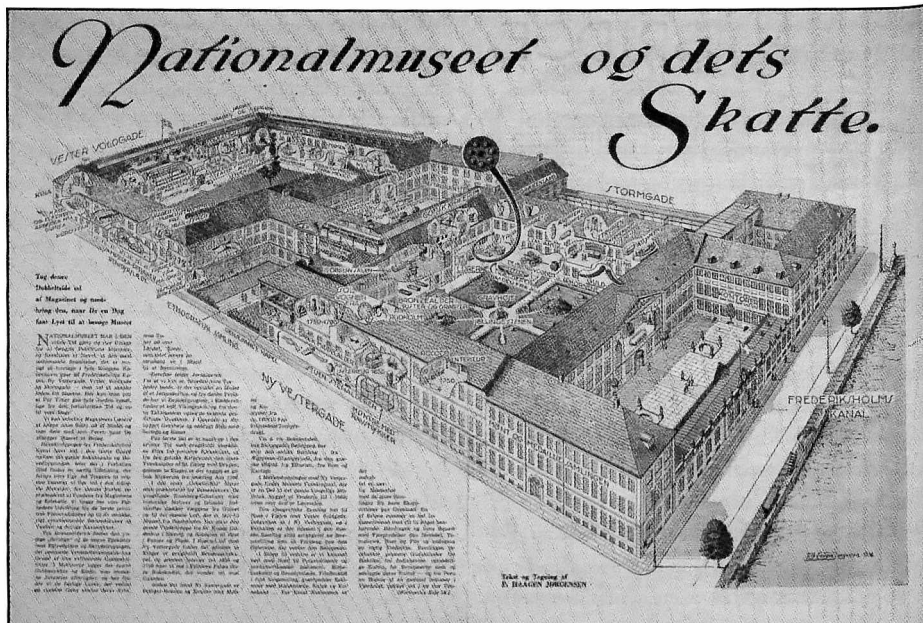
Nationalmuseet er Danmarks kulturhistoriske centralmuseum med hoveddomicil i Prinsens Pale i København. Museet har rødder i Det Kongelige Kunstkammer, der blev grundlagt ca. 1650.

historicopfattelse. F.eks. anser de fleste af os nok tidligere tiders mennesker som primitive og teknisk tilbagestående i forhold til os nutidsmennesker. Det gælder både for en nær og en fjern fortid.