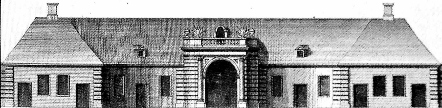
Façade du Bâtimen. de l'acier vers la Cour.