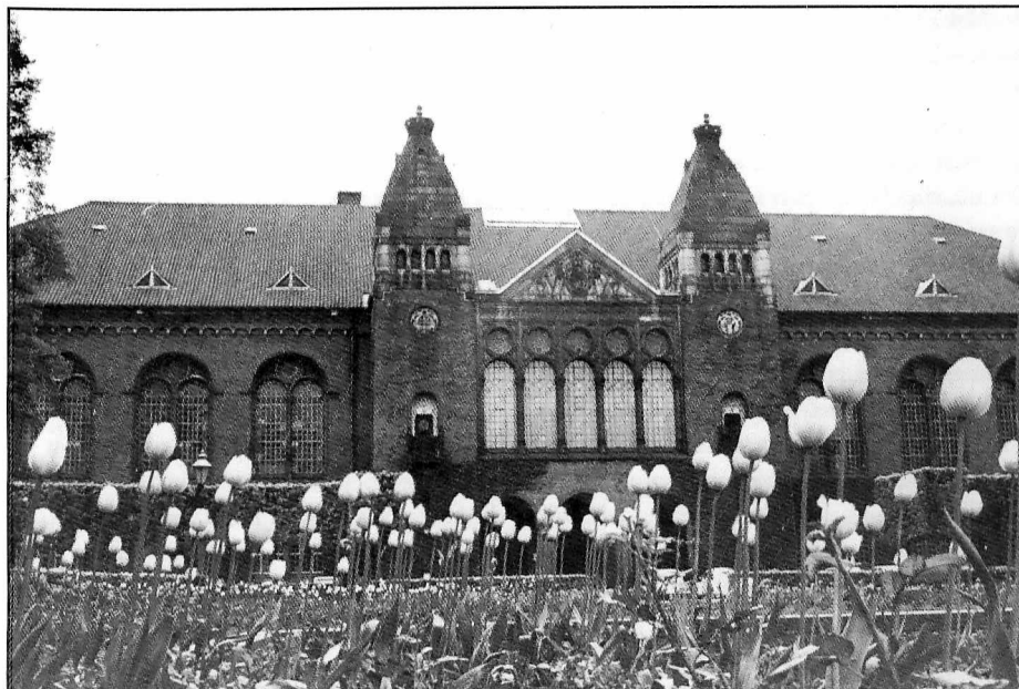
Det Kongelige Bibliotek har eksisteret som nationalbibliotek og museum siden 1648. Genstandene fra fortiden med deres fascinerende henvisning til svundne tider består her af bøger, tidsskrifter, aviser, håndskrifter, kort, fotografier og arkivalier. (Det Kongelige Bibliotek, Billedsamlingen).