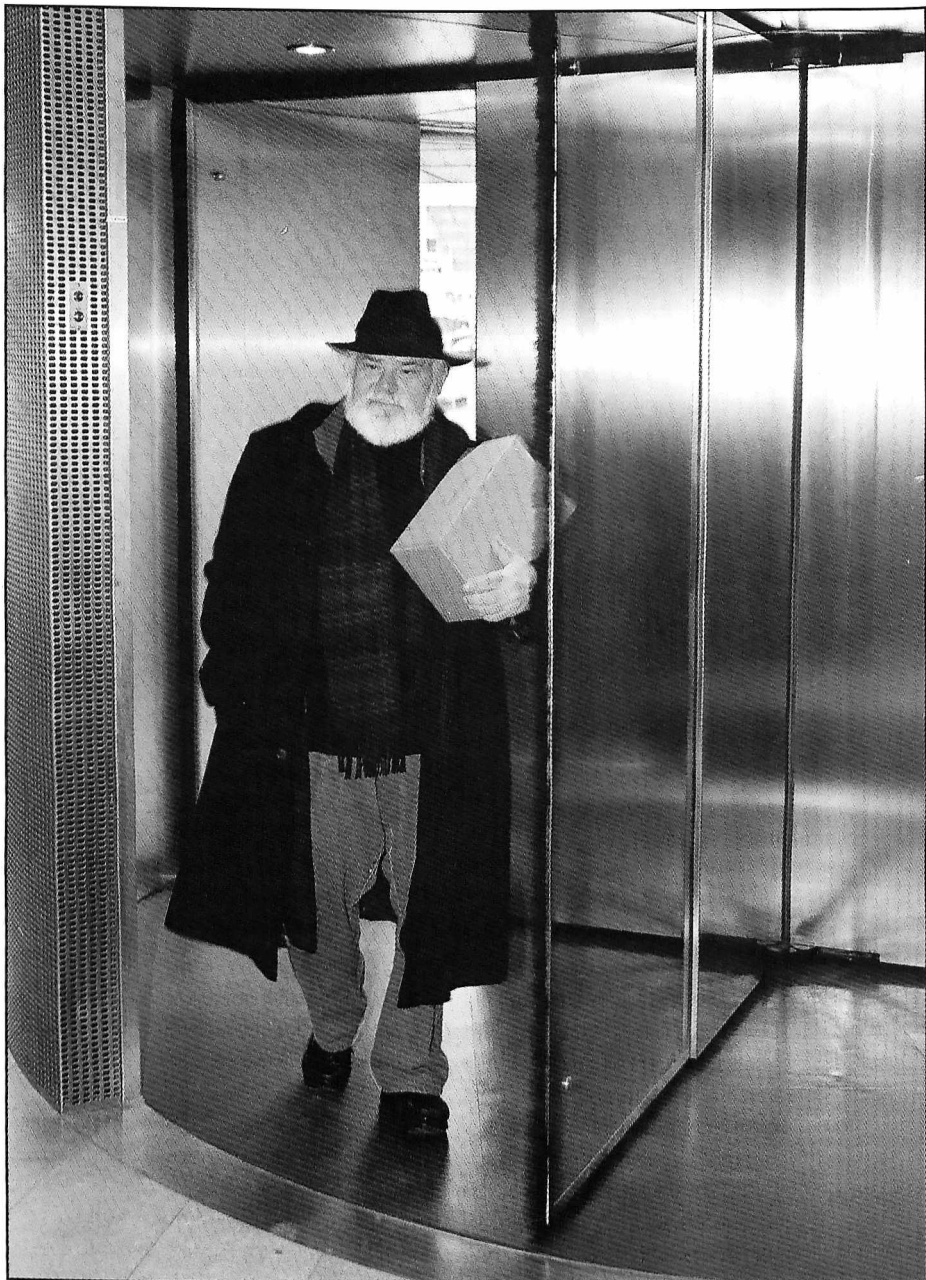
Hver mandag i hele 2002 ankommer Fuzzy til Det Kongelige Bibliotek medbringende en kasse, der indeholder ugens komposition af værket KATALOG. (Foto: Det Kongelige Bibliotek).