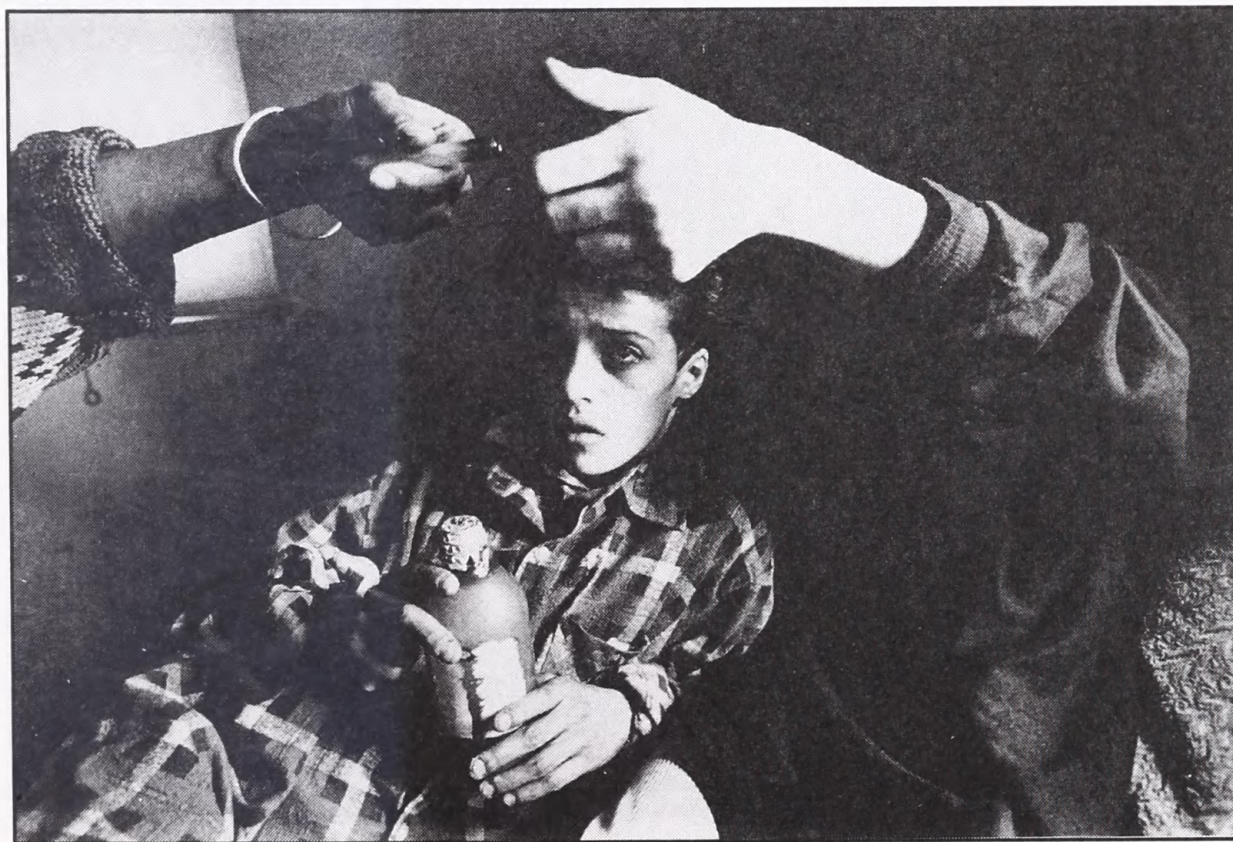
Eugene Richards Crack Annie, Brooklyn, 1988.

Udstillingen Fra Det Skjulte er i vid udstrækning en præsentation af denne samling, og samtidig bliver den en status over hvad der er nået, og hvad der fortsat er at gøre. Nogle steder er der en klar sammenhæng i ophængningen, andre steder er der ansatser til noget som