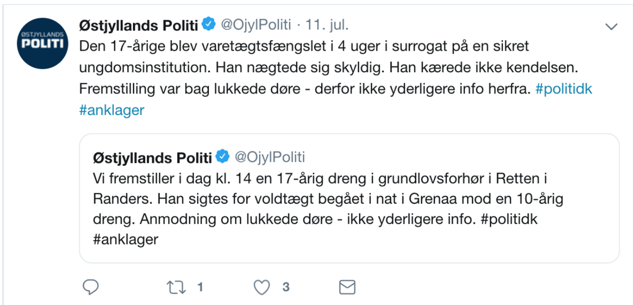
Figur 1.

I eksempel (6) virker det umiddelbart til, at journalisten anvender angiveligt evidentielt og dermed angiver, at han har sin viden fra en tredjepart, som i dette tilfælde er Østjyllands Politi. Nedenfor ses dog et screenshot fra Østjyllands Politis Twitterkonto af det tweet, som journalisten refererer til. Her ses, at politiet ikke selv anvender epistemiske eller evidentielle markører, men blot refererer, hvad den 17-årige sigtes for, uden at kommentere på indholdet af denne sigtelse.