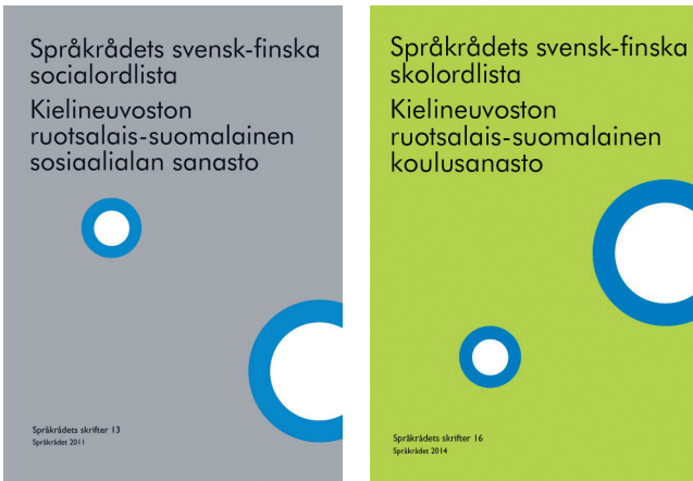
Figur 1. Språkrådets svensk-finska socialordlista (2011) och Språkrådets svensk-finska skolordlista (2014).

av användningsområde eller om användarna särskilt önskar det. I framtagandet av större specialordlistor får språkvårdarna i finska på Språkrådet hjälp av experter inom de olika ämnesområdena för att kvalitetssäkra att de rekommenderade sverigefinska termerna är adekvata och korrekta.