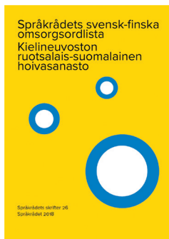
Figur 2. Språkrådets svensk-finska omsorgsordlista (2018).

i vård- och omsorgsarbetet ofta förekommande fraser vilket inte heller förekommer i Språkrådets andra svensk-finska ordlistor.