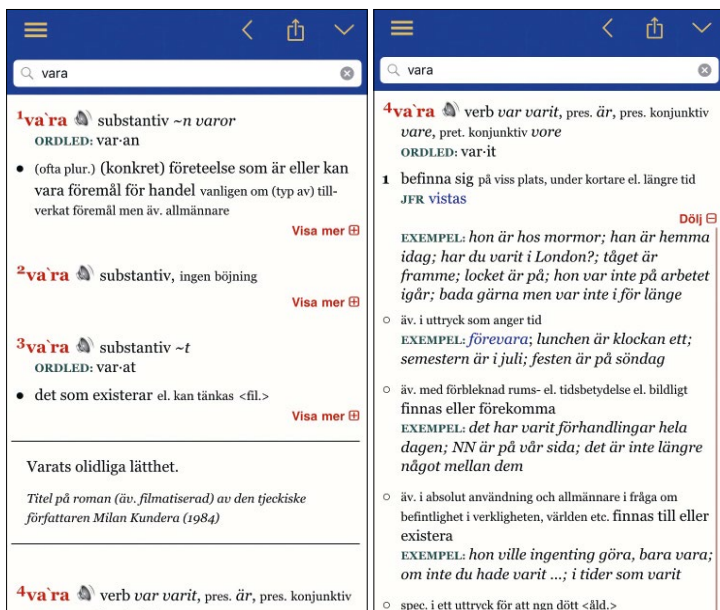
Bild 3: Skärmbildningar av visningen av de fyra första lemmarna som en sökning på vara leder till, samt för 4vara .

när den först visas, i oexpanderad form. Ett klick på ”visa mer” fäller ut ordboksartikeln, medan ett klick på ”dölj” i bilden till höger fäller ihop den igen. Även detta bidrar till överskådligheten och gör att det blir lätt att navigera mellan homografer och i mycket omfångsrika artiklar.