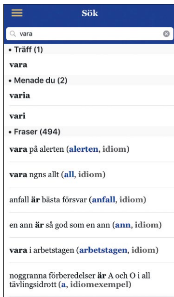
Bild 2: Träffresultat efter fritextsökning på vara . Varje rad är klickbar.

Träfflistorna blir som regel mycket uttömmande, med såväl träffar som ”menade du”-förslag där stavningshjälpen har identifierat andra lemman med en stavning som ligger i närheten av vad som skrivits i sökrutan. I den händelse sökmotorn inte har lyckats föreslå det ord som användaren tänkt sig finns det som regel några rader längre ner i träfflistan. För den som vill använda appen som en korpus är de omfattande träfflistorna en stor tillgång. Möjligen finns det risk att en del användare drabbas av informationsöverdos när varje sökning leder till väldigt många förslag (jfr Lew in press). Hur informationsrik en sökning kan vara illustreras i bild 2 och 3. En fritextsökning på vara leder till en konkret träff, två förslag (under rubriken ”Menade du”) samt ett stort antal träffar bland fraser (se bild 2). Om användaren börjar skrolla sig ner i förslagslistan kan den snabbt framstå som överväldigande. När man klickar på den konkreta träffen