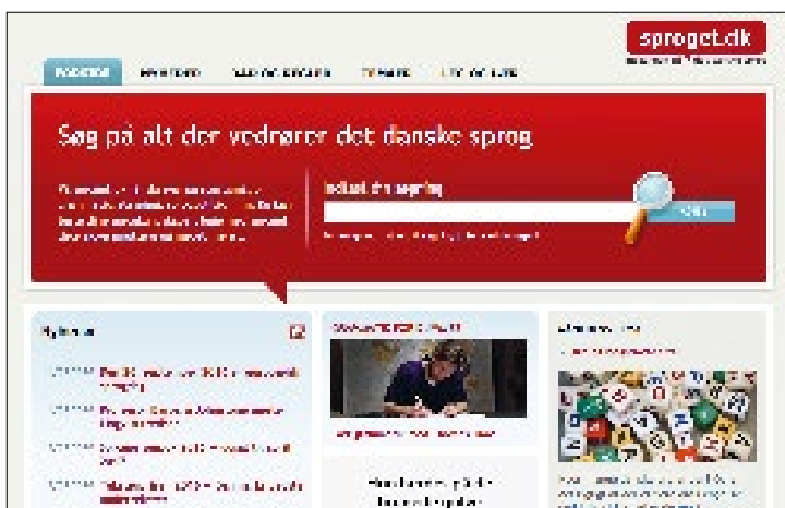
Figur 1: Øvre del av framsida (september 2016).

Det visuelle førsteinntrykket av sproget.dk er ei fast, enkel ram- me med mange stabile element. Mot ein bakgrunn i kvitt og duse farger dominerer ei brei, djupraud stripe tvers over heile skjerm- biletet, og inni det raude står søkjefeltet tydeleg fram som kon- trast. Oppe til høgre står logoen i same raudfarge. Andre element er òg i raudt: ein del av overskriftene og dessutan nokre gjennom- gangsfigurar som vi ser nedst på skjermen, brukte som kjenne- merke på hovudmenypunkta Råd og regler , Temaer , Leg og lær og dessutan på Links . Desse menypunkta, bortsett frå Links , står òg øvt på sida, saman med Nyheder . Punkta Råd og regler , Temaer