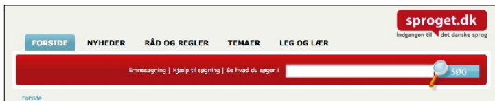
Figur 3: Søkjefeltet på andre sider enn framsida.

Søkjefeltet i den raude stripa er framheva som den mest sentrale delen av portalen. Den som kikkar innom, blir oppfordra til å søkje på «alt der vedrører det danske sprog», og i ingressen er det gjeve eksempel på kva ein kan få ut av søkinga. Hjelp- og informasjonssidene som står med lita skrift under, mellom anna «Se hvad du søger i», er gjennomgåande klare og oversiktlege og truleg nyttige for dei som opnar desse sidene, men det er kanskje eit fåtal. På andre sider enn framsida blir den raude ramma rundt søkjefeltet til ei smalare stripe, men feltet er alltid med, høgt oppe på skjermen (figur 3).