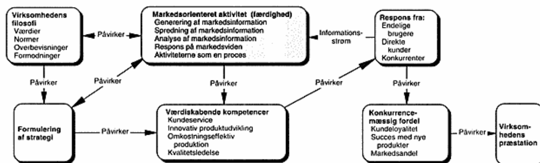
Figur 1. Markedsorienteret aktivitet som en færdighed i skabelsen af kundeværdi