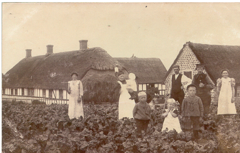
Figur 3. Et typisk gårdmandshushold på Astrup Nedergaard syd for Århus omkring 1920. Familien Svendgaard omfattede mand, kone, fire mindre børn og mandens far; med til husstanden hørte også to tjenestepiger. På billedet ses de meget betegnende længst ude i siderne - de er med i husholdet, men ikke dets midtpunkt.

Samtidig er det imidlertid et udtryk for, at husholdslandbruget kulminerede sidst i 1800-tallet. Arbejdsstyrken var fortsat med at vokse inden for gårdhusholdet. Hvor gårdmandsgruppen i 1600-tallet havde været mere talrig end medhjælperne, og der i 1700-tallet havde været paritet mellem de to grupper, havde mand og kone nu i gennemsnit næsten tre medhjælpere over 14 år til rådighed.