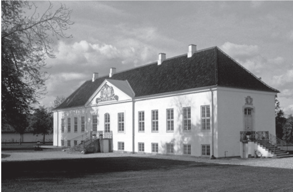
Figur 2. Billede af Turebyholm set fra sydøst. Da A. G. Moltke overtog Turebyholm, lod han samtidig en ny hovedbygning opføre i den nyeste mode. Bygningen forekommer en anelse beskeden i forhold til forestillingen om 1700-tallets store pragtanlæg, men det har sin naturlige forklaring. Da Turebyholm ikke lå langt fra Bregentveds hovedbygning, var Turebyholm som hovedregel tænkt som et udvidet tehus, når for eksempel grevens gode ven kong Frederik d. 5. om sommeren kom forbi Bregentved.

ningen havde således ikke rod i gårdens fysiske størrelse, men i hvor meget korn den kunne producere.