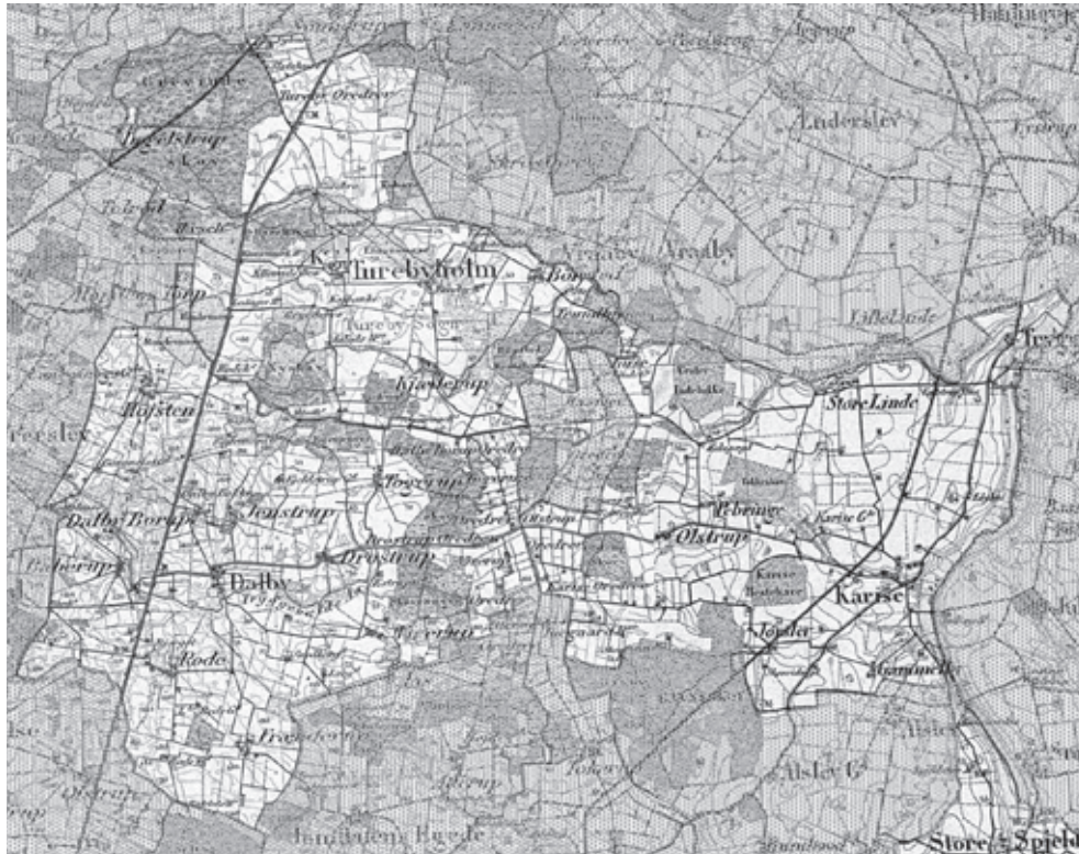
Figur 1. Kort over Turebyholm med sognene Tureby, Karise, Dalby og lidt af Spjelderup, hvor fæsteforholdene undersøges i denne artikel. Turebyholm indgik i Bregentveds enorme godskompleks, der også omfattede hovedgårdene Tryggevælde og Juellinge. Atlasblad Store Heddinge 1:80.000, målt 1847. Copyright: Kort & Matrikelstyrelsen, Rentemestervej 8, 2400 København NV.