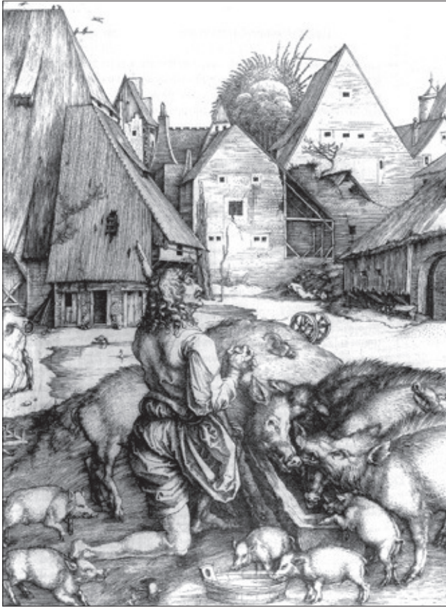
Figur 4. Gudsfrygtig fromhed på landet udlevet af en tysk svinebonde illustreret af Albrecht Dürer i et træsnit fra 1496. Bondealmuens bønsliv kunne i middelalderen finde professionel støtte i jævnlige besøg på gårdene og i den lokale sognekirke af franciskanske og dominikanske prædikanter på terminering.

Afholdelsen af tiggerbrødrenes prædiken og øvrige pastorale gerninger under termineringen kunne i princippet foregå alle steder i lokalsamfundet, men vi møder først og fremmest de dominikanske præster ved landsognekirker og på herregårde, samt i andre byer inden for konventets termin. Også middelalderens mange små kapeller dannede ramme for brødrenes virke, ligesom kirkegårde og markedspladser var oplagte steder at lade folk forsamle for at høre det gode budskab forkynde. Det samme gjaldt åbne pladser i landskabet med en historisk eller lokalkultisk betydning; ved den flamske landsby Te Wachtebeke var der i 1361 tradition for udendørs prædikener på en gammel borgbanke. 27 Foruden små rejseegnede bibler og prædikebøger til symbolsk og praktisk brug i felten, kunne tiggerbrødrene tillige være udrustet med et indviet, trans-