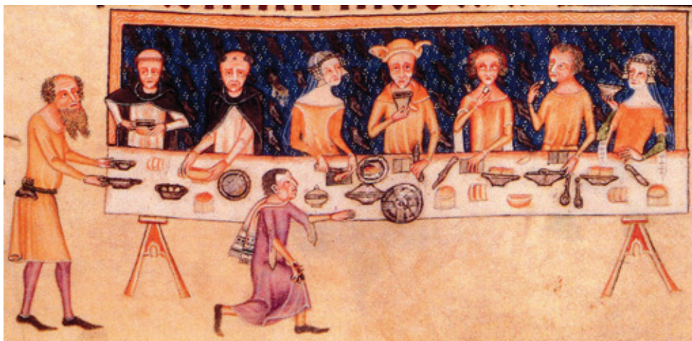
Figur 6. To dominikanske brødre sidder til højboards hos den engelske ridder Sir Luttrell. I hele Nordeuropa synes ikke mindst dominikanerne ofte at have nydt godt af landadelig gæstfrihed under termineringen. Illustration af ukendt kunstner fra Luttrell Psalter, et engelsk illumineret håndskrift fra starten af 1300-tallet.

Overalt i Nordeuropa kan man finde tegn på, at dominikanerkonventerne havde et godt forhold til den lokale landadel, hvis slotte og hovedgårde var en oplagt station under termineringen. Talrige belæg vidner om dominikanske visitter hos adelen, og det er således ganske illustrerende, at den engelske stormand sir Geoffrey Luttrell i starten af 1300-tallet til et håndskrift lod sig afbilde ved hjemmets veldækkede højbord i selskab med to terminerende dominikanere.