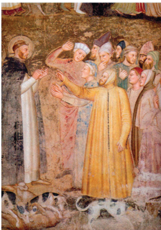
Figur 3. En dominikaner prædiker og forsøger at forklare tingenes rette sammenhæng for hvad der endnu ikke synes at være en helt overbevist folkemængde. Samtidig går sort-hvide dominikanerhunde – Domini canes eller Herrens hunde – i flæsket på djævelens ræve og ulve for derved at beskytte lammene, den kristne menighed. Hvor tiggerbrødrenes prædikanter kom frem, blev de ofte mødt med stor folkelig interesse, men jorden, hvorpå deres milde og fromme ord blev sået, var ikke altid lige imødekommende. For mange i almuen bød mødet med terminerende tiggerprædikanter først og fremmest på et underholdende indslag i en ellers temmelig monoton hverdag. Fresko af Andrea da Firenze 1365-67. Detalje af vægmaleriet The Church militant and triumphant i Det Spanske Kapel i klosterkirken Santa Maria Novella, Firenze.

tilsyneladende har i hvert fald nogle lægfolk i Skagen og Saltum ment, at en supplerende pastoral tjeneste var ønskelig.