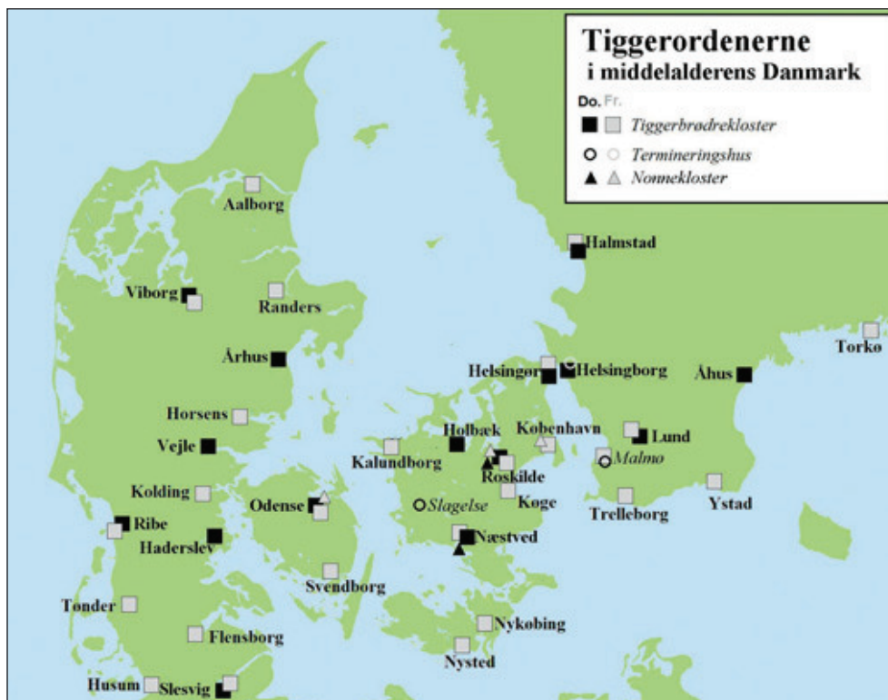
Figur 2. Fordelingen af klostre og kendte termineringshuse tilhørende de to store tiggerordener i middelalderens Danmark; sorte symboler markerer dominikanske residenser, grå markerer franciskanske. Kort: Johnny Jakobsen.

ske værdier og befri sig fra al unødvendig, fordærvelig ejendomsbesiddelse. Det såkaldte fattigdomsideal stod stærkest hos franciskanerne, men også dominikanerne tilstræbte at efterleve det. Selvom regler og især praksis fra starten af 1300-tallet blev lempet lidt, så de fleste konventer i 1400-tallet foruden deres eget kloster også ejede lidt huse, kålgårde og enge i byerne og disses udkant, så udviklede det sig aldrig til decideret fæstegodsdrift som hos de gamle klosterordener. 2 Dominikanske og franciskanske konventer skulle i princippet udelukkende basere deres eksistens på omgivelsernes gavmildhed. De skulle ved siden af deres øvrige opgaver tigge sig til dagen og vejen, hvorfor de også under ét kaldes tiggerordener og tiggerbrødre eller mere ukorrekt tiggermunke , samt i udenlandsk tradition tillige mendikanter : tiggere.