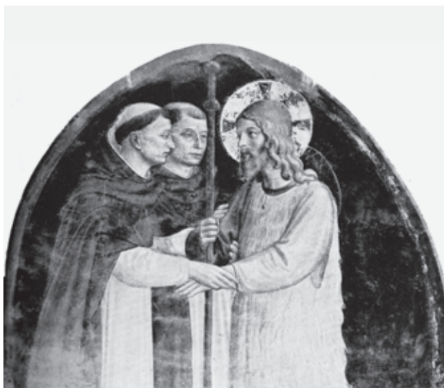
Figur 11. To dominikanere på terminering møder vandringsmanden Kristus. Fra flere sider i samfundet, også inden for Kirken, blev tiggerbrødrene kritiseret for deres omflakkende tilværelse og afhængigheden af andres gavmildhed, men et godt argument imod denne kritik fandt brødrene i det forhold, at de i virkeligheden blot levede på samme måde som Kristus havde gjort. Fresco af Fra Angelico (1387-1455). San Marco Kirke, Firenze.

Terminering blev i det hele taget et af de varme emner i reformationstidens opgør med tiggerordenene. Siden ordenernes fremkomst i starten af 1200-tallet havde dele af kirken set med væmmelse på denne form for omvandrende klosterliv, som allerede Skt. Benedikt havde talt imod, og tiggerbrødrene måtte med jævne mellemrum forsvare deres levevis, hvilket de typisk og bedst gjorde ved at henvise til, at også Kristus jo var på bestandig vandring og levede af andres almisser. Hvad kunne da være en frommere og smukkere form for religiøst liv? Erasmus af Rotterdam og dermed hele den humanistiske skole sluttede sig imidlertid også til kritikerne af disse »Roms satellitter«, og endnu barskere blev angrebene fra lutheranerne, der i deres generelle bredside imod tiggerordenene ikke mindst sigtede efter terminsbrødrene. I reformationstidens talrige anti-katolske propagandaskrifter, og hos mange af eftertidens historikere, kan man ofte læse, at et af de store irritationsmomenter for almuen netop var tiggerbrødrenes evindelige, omvandrende tiggeri i by og på land. Som allerede vist er dette syn dygtigt videregivet i beretningen om Peder Smed og Asser Bonde .