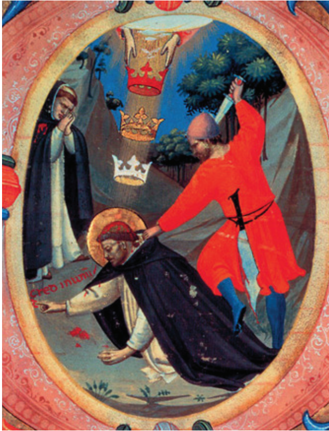
Figur 9. Det var bestemt ikke ufarligt for tiggerbrødre at gå på termen, idet de langt fra blev modtaget lige venligt alle steder, og dertil var et sårbart mål for landevejens mange farer. Så voldelige overfald som to dominikanske brødre udsattes for mellem Vejle og Viborg i 1527 hørte dog heldigvis til sjældenhederne. Ingen skandinaviske terminsbrødre opnåede da heller helgenstatus, sådan som det tilfaldt den her afbildede dominikanske Peter Martyren, der blev myrdet i Norditalien i 1252, mens hans socius så forfærdet til. Illustration i helgenskrift af Fra Angelico ca. 1423. Biblioteca del Convento di San Marco, Firenze.

det hele taget forekommer det sandsynligt, at rejsen fra Vejle til Viborg indgik i en form for terminering, så formålet trods alt har været rettet mod mere end viborgensiske tørfisk.