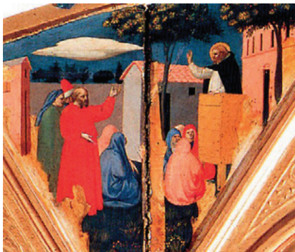
Figur 5. En dominikaner prædiker under Guds åbne himmel på hvad der ligner en mobil prædikestol. Maleri af Fra Angelico ca. 1422-23. Detalje fra altertavle, San Pier Martire triptych, oprindeligt i San Felice Kirke, Firenze, nu Museo di San Marco, Firenze. Fra Kanter & Palladino 2005.

portabelt alter til forretelse af egentlige messer. Nogle brødre havde endog mobile prædikestole med sig til opstilling i felten.