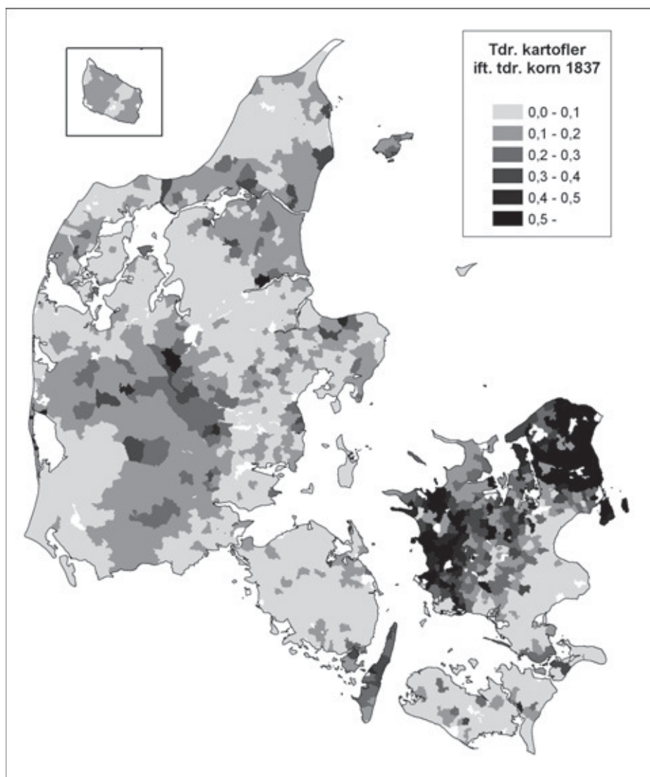
Figur 8. Kartoffelkort 1837. Kortet viser udsæden af kartofler i forhold til korn ifølge jordbrugstællingen fra 1837. Det ses tydeligt, at særligt indbyggerne i den nordlige og vestlige del af Sjælland, Langeland og enkelte områder i Midtjylland lagde vind på kartoffeldyrkningen. Kortet er udarbejdet af Peder Dam. Data er venligst stillet til rådighed af Jørgen Rydén Rømer, der har indtastet landbrugstællingen i forbindelse med forskningsprojektet AGRAR2000.