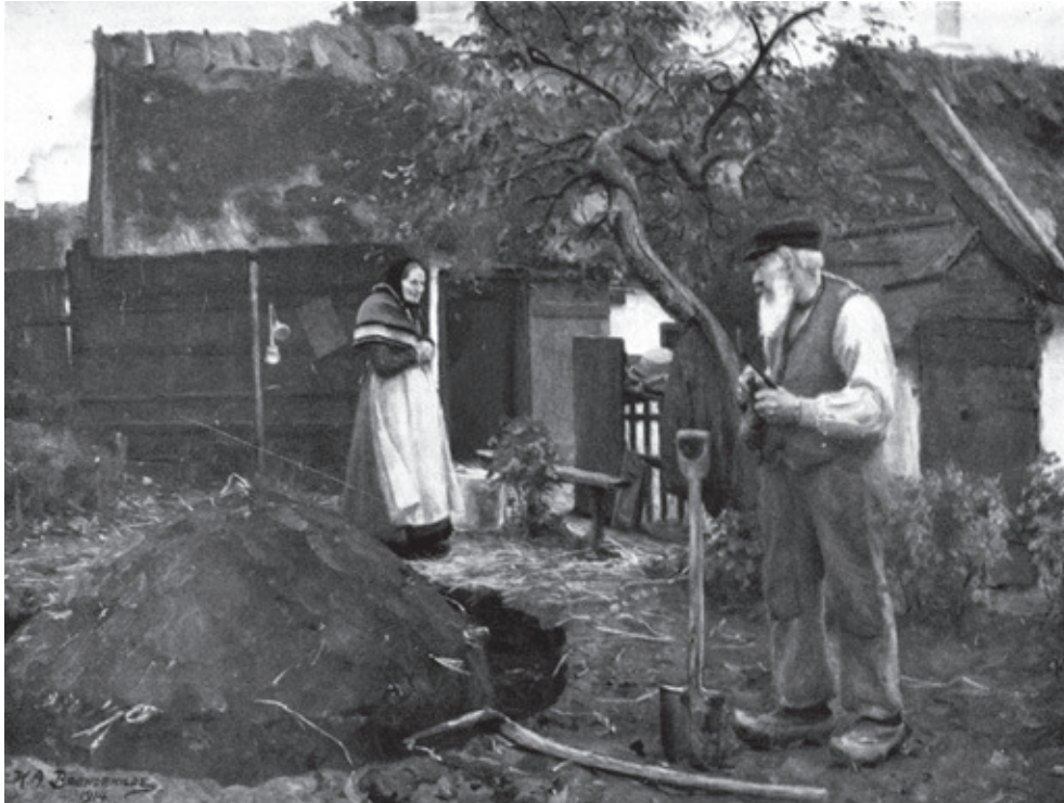
Figur 4. Kartoffler fik med tiden et skær af fattigdom, selv om det faktisk blev en af hverdagens foretrukne fødevarer. På H.A. Brendekildes maleri, Kartofflerne kules, fra 1914, klargøres kartoflerne til vinterens opbevarelse hos en tilsyneladende fattig landarbejderfamilie. Gengivet i Arbejderens Almanak 1923.

let, at nogle forpagtere havde sat såkaldte potæter på marken. Da de skulle opgraves, lod de lyse i kirkerne og lovede hver 9. skæppe til hjælperne. Der var mange inderster, husmænd og også gårdmænd med tjenestefolk, der kom kørende. De fandt imidlertid ud af, at det ikke kunne betale sig at opgrave 18 skæpper og kun få to i betaling, fordi det ikke blev til mere end to-tre skæpper om dagen. Det var for dyrt, når kartoflerne kunne købes for to mark skæppen. 35