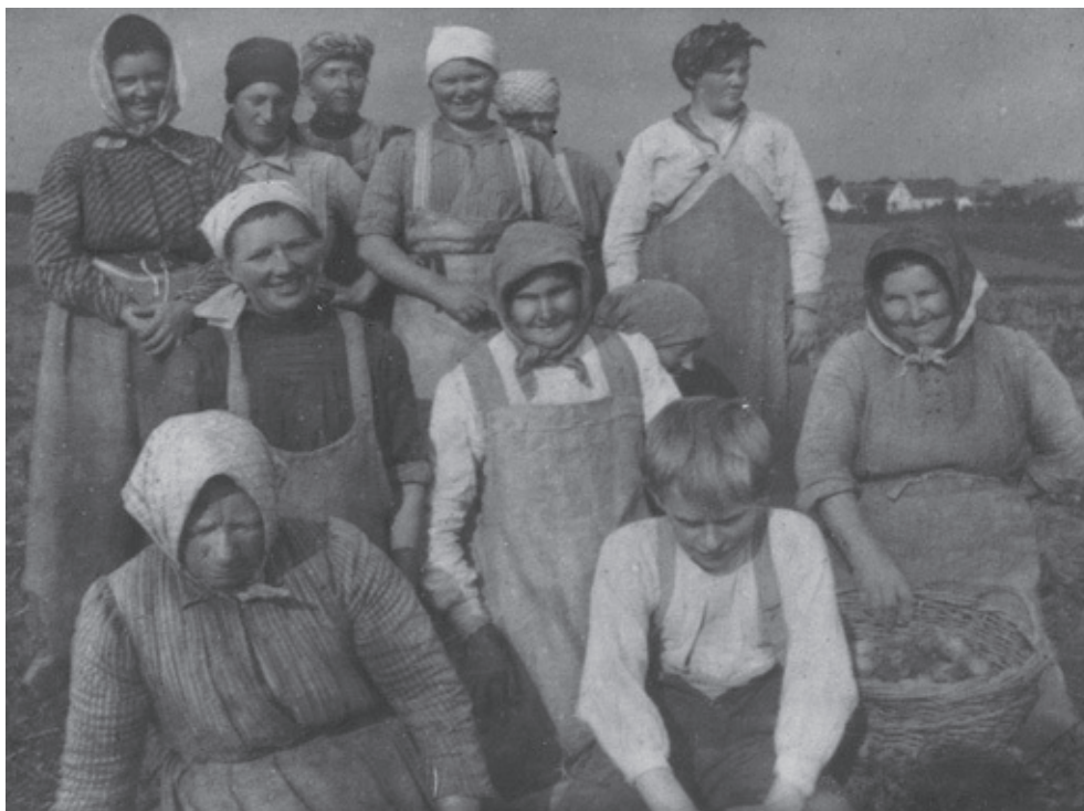
Figur 6. Kartoffelopsamling var fra begyndelsen domineret af kvinder, også efter optagningen blev mekaniseret. Hest med karl trak en kartoffeloptager, ofte en plov eller udkaster, mens kvinder og børn fulgte efter og opsamlede kartoflerne. Denne metode ændrede sig først efter Den 2. Verdenskrig. Her ses kartoffelkonerne fra Brederød ved Frederiksværk i 1914.