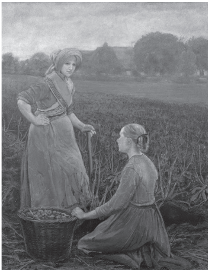
Figur 3. I slutningen af 1800-tallet var kartoflen blevet en så almindelig del af dagliglivet, at de også blev et motiv for samtiden kunstnere, der netop ønskede at indfange hverdagen hos almindelige mennesker. L.A. Ring: To piger der graver kartofler, 1883. Den Hirschsprunke Samling.