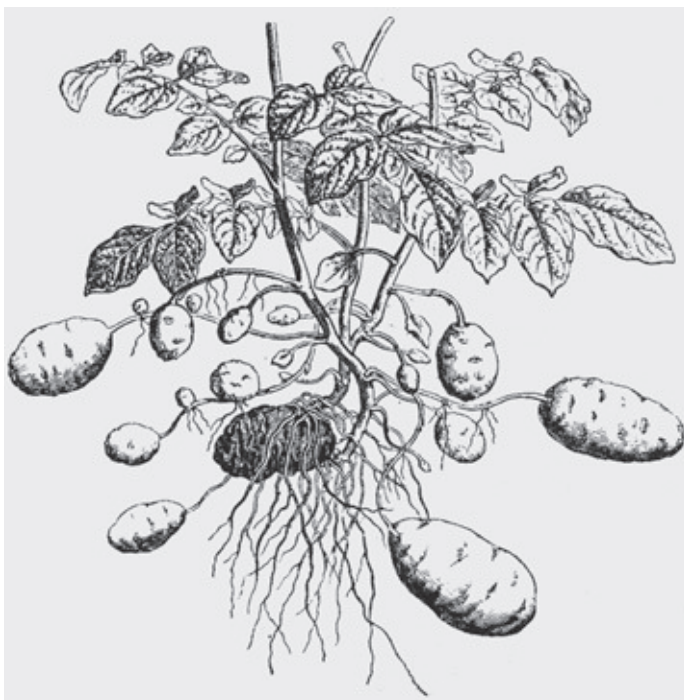
Figur 5. Kartofflen fandt også sin vej ind i de danske skolebøger, som her i V.A. Poulsens Grundtræk af Plante-læren. Til Brug ved den første Undervisning i Botanik. 3. udg. København 1901.

De mange forbehold var ikke ensbetydende med, at den jævne befolkning ikke dyrkede kartofler, hvis de ikke også indførte forbedringer af deres drift