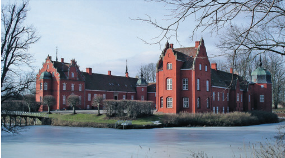
Fig. 5. Løvenborg hovedgård. Baronen på godset var den største lodsejer i Nr. Jernløse sogn. Han ejede gårde og huse i fire af de fem landsbyer. Foto: Martin Bork, 2006.

selve godsejerfamilierne på Knabstrup og Løvenborg, men de var alle blandt hovedgårdenes betroede medarbejdere.