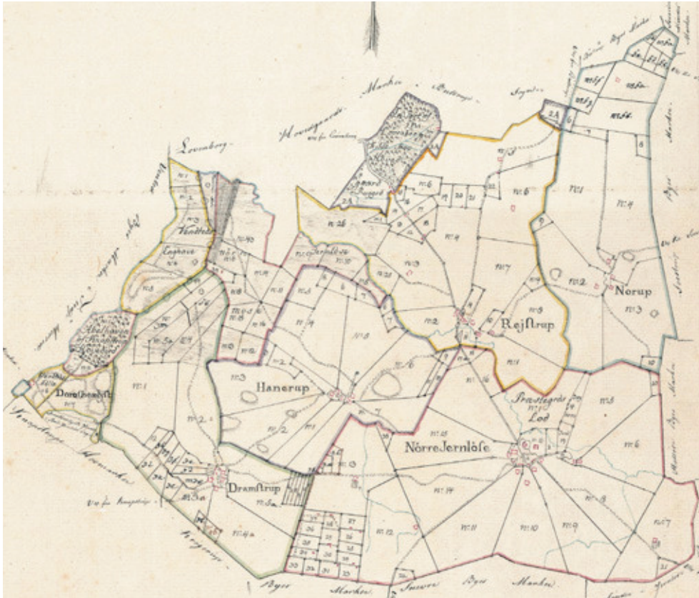
Fig. 1. Nr. Jernløse Sogn. Sognet bestod af fem landsbyer, hvoraf Nr. Jernløse var den største. Her lå kirken. Sydvest for Nr. Jernløse lå de såkaldte Bankehuse – en række husmandssteder med jord, som blev oprettet i forbindelse med udflytningen på en nedlagt gårds jorder. Det samme gør sig gældende for Kobbelhusene nordvest for Rejstrup. Minoreret sognekort 1:20.000 tegnet ca. 1816.

studerer ikke sognet for at afdække den lokale historie, men derimod studerer jeg i sognet, fordi det ofte er på det konkrete og specifikke niveau, vi kan fange detaljer og det udtalte, som kan udsige noget alment. 6