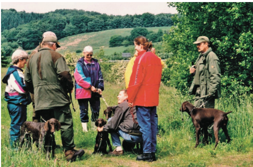
Fig. 8: Familiedag i Odder Jagtforening i 2001. Jægeres familiemedlemmer inviteres med som observatører på jagten, ligesom de kan se frem til hygge i jagtens indlagte pauser og sociale stunder.

Vigtigheden af det sociale samvær ses også i, hvordan jagtkonsortiet 'Karensminde' i Odder Ådal optager nye medlemmer. Kun ved at kende nogen i konsortiet i forvejen, kommer man i betragtning som nyt medlem. Derudover kommer potentielle medlemmer med på jagt på prøvetid i et år, førend de er fuldgyltige medlemmer. Man sikrer sig, at det nye medlem falder ind i gruppen såvel som jæger og socialt.