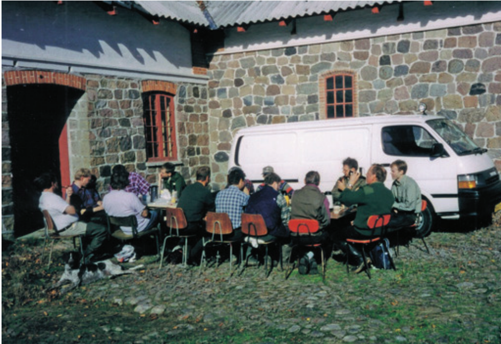
Fig. 5: Frokost på en af jagtkonsortiet 'Karensminde's fællesjagter i 2002.

af jægerne angiver naturoplevelsen omkring jagten som en afgørende faktor. 15 Fremhævelsen af naturoplevelsernes betydning og den mindre tillagte betydning af at skyde vildt afslører, at jagten for mange landet over i dag altovervejende er blevet en fritidsbeskæftigelse.