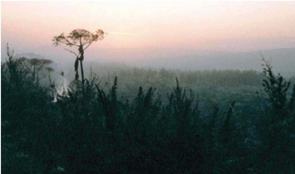
Fig. 6: Tvenstrup Enge en septembermorgen i 1988.