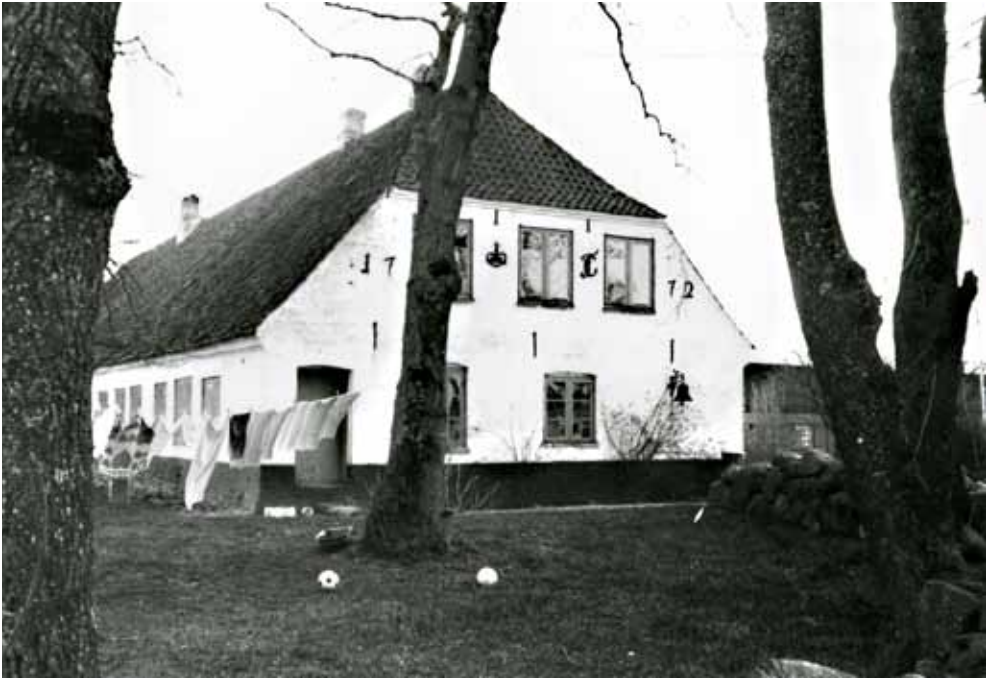
I 1772 oprettede Hertug Frederik Christian 1. gården Vertemine, hvor han samme år opførte en ny forpagterbolig, prydet med årstal og hertugens monogram og krone. Det fine hus findes ikke mere.

Det var stort set, som det havde været i hele 1700-tallet – måske snarest lidt strengere, da bønderne utvivlsomt havde ret i, at det nye system på flere måder krævede mere arbejde end det gamle. På de vilkår blev gårdene bortforpagtet for ti år fra 1772 og igen fra 1782. 22 Mens hoveri og fæsteforhold forblev stort set uændrede, blev næsten hele fæstegodset under det augustenburgske godsdistrikt udskiftet i Frederik Christian 1.s tid.