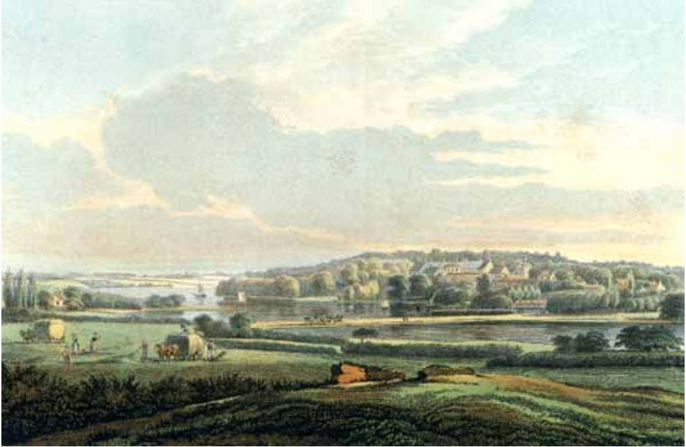
Litografi af Augustenborg af W. Heuer. I baggrunden ses slottet og på dæmningen en herskabelig kare. I forgrunden ses bønder, der læsser hø. Hertugens og bøndernes verden lå lige ved siden af hinanden, men deres syn på tingene kunne være ganske forskelligt. Museum Sønderjylland.

end uden hoveri, thi udviklingen af landbrugsdriften og jordens bedre kultur kom i almindelighed fra godser og hovedgårde og derfra videre til bønderne og småbrugerne. 67