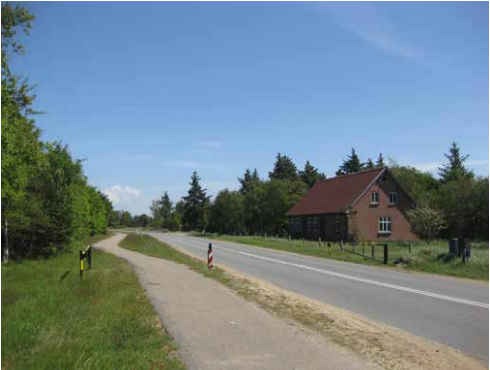
Figur 6. Området skulle fortsat se beboet ud. Her er det Vejers gamle skole, der blev opført i 1900 og fungerede indtil 1964. Bygningen er et godt eksempel på, hvorledes de gamle tomme bygninger tilfører landskabet historie og karakter, når de stadig vedligeholdes.

hængende øvelsesområde, hvor man kunne føre en forstærket bataljon i nogenlunde rigtigt rum såvel i bredde som i dybde. Arealet måler således fra Blåbjerg Plantage til Blåvand 21 kilometer og har en bredde på omkring 10 kilometer. 127 Før lokalsamfundet var resultatet, at de mindre bebyggelser ved Børsmose, Kærgård, Mosevrå, Bordrup, Vejers by og Grærup by, der ikke var landsbyer, men små klynger af huse, helt forsvandt. I dag finder man dog stadig en del af de eksproprierede bygninger i området.