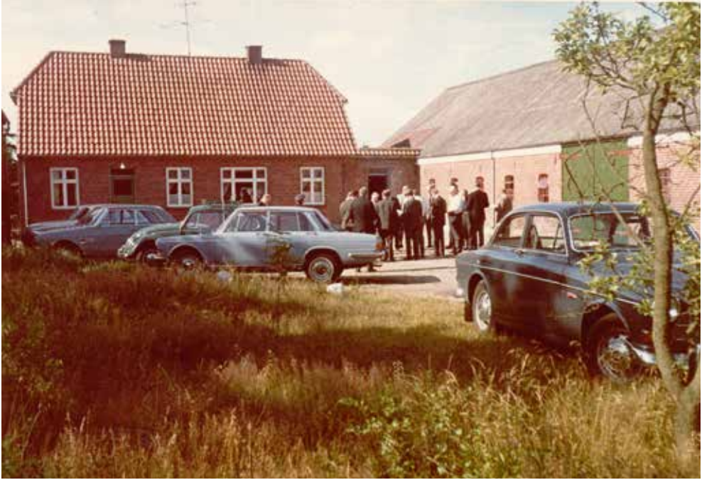
Figur 5. Her ses ekspropriationskommissionen parat til at ekspropriere den 14. juli 1967. Det drejer sig om en af de typiske små landejendomme, der prægede området. Nu står de tomme skaller tilbage som kulisser.

med eksempelvis velholdte bygninger fik forholdsmæssigt for lidt. Værre blev det, da Folketinget i 1968, uafhængigt af begivenhederne i Sydvestjylland, som en del af en skattereform vedtog, at folk, der fik deres ejendom eksproprieret, ikke skulle betale kapitalvindingsafgift. 114 Loven havde tilbagevirkende kraft fra 1. januar 1968, således at de, der havde fået deres ejendom eksproprieret i 1967 skulle betale skat af deres erstatning, mens de senere eksproprierede undgik det. Dette havde en slagside, fordi man af hensyn til de fastboende netop var begyndt med denne gruppe, der havde det største behov for en afklaring, mens blandt andet sommerhusejere og spekulanter blev afviklet sidst og nu pludselig undgik kapitalvindingsskatten. Der var ingen tvivl om, at dette gav modstandernes retfærdighedsfølelse endnu et knæk og hos de ramte bidrog til opfattelsen af magtarrogance og overgreb. 115