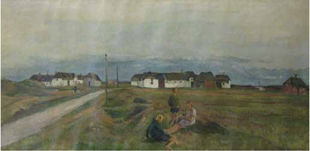
Figur 1. Et glimt af tiden før ekspropriationerne, da området endnu var præget af mindre landejendomme. Disse gårde ved Grærup er malet af Alfred Mårtens juli 1929. Museet for Varde By og Omegn.

Langes blik på landskabet var romantisk, men det vigtige er, at han medvirkede til at give området en identitet, som de lokale modstandere af ekspropriationen kunne være fælles om. Lange satte ord på stedets “ånd” for at blive i den romantiske terminologi – det unikke, som ikke uden videre kunne købes for penge.