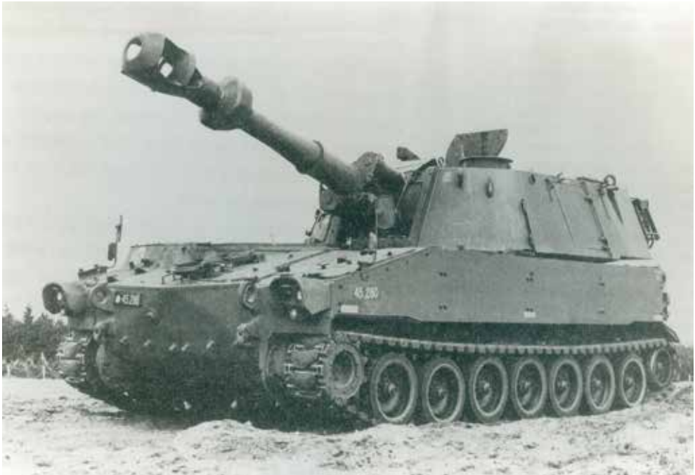
Figur 2. M109 var et af de nye pladskrævende bæltekøretøjer, som Forsvaret modtog i 1965.

“det fornødne beløb” til ekspropriationen. 15 Det betød, at forsvarsministeren reelt bad Finansudvalget om en blankocheck til ekspropriationen af de pågældende områder.