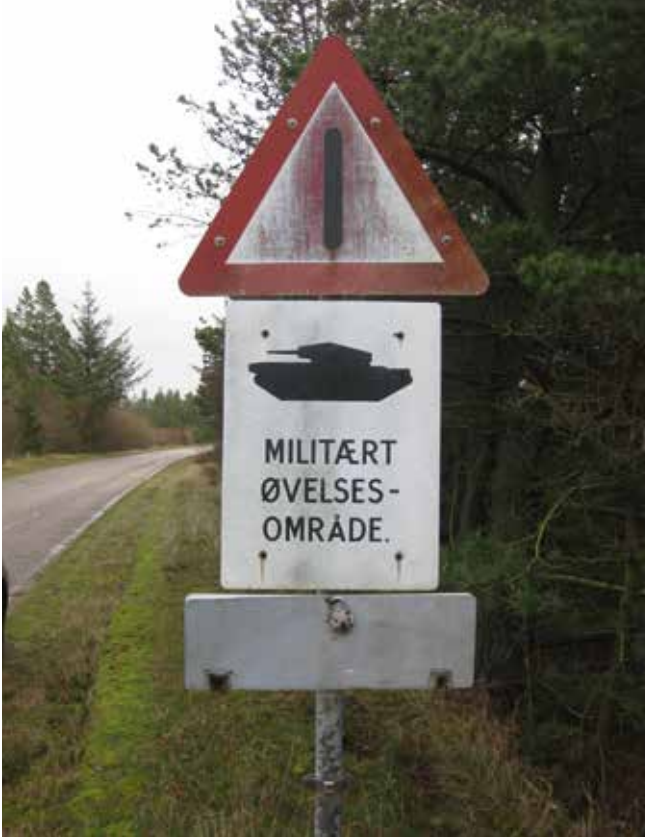
Figur 4. Et af de karakteristiske skilte, der minder den forbi-passerende om militærets tilstedeværelse.

idet “ der vil være åben adgang bortset fra de tider, da der er skarpskydninger ”. Og i forhold til dyrene, så var der ifølge forsvarsministeren ingen steder, hvor de trivedes så godt som på Forsvarets arealer. Ministeren erklærede sig derfor uenig i, at en ekspropriation af denne art ville gribe afgørende ind i arealets natur og udseende, og han ville ikke anerkende Skræppenborg-Nielsens påstand om, at man ligefrem tilstræbte tragedien. Ministeren slog i stedet fast, at han ikke var ubekendt med de komplicerede problemer, som processen indebar, men erklærede sig i samme anledning villig til at endevende alle problemer.