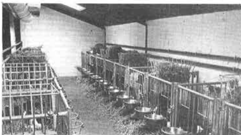
Figur 3+4: Nyhedsbrev om staldbyggeriet på Immervad udarbejdet af Landskontoret for bygninger og Maskiner, og sendt ud til bygningskonsulenter i 1979.