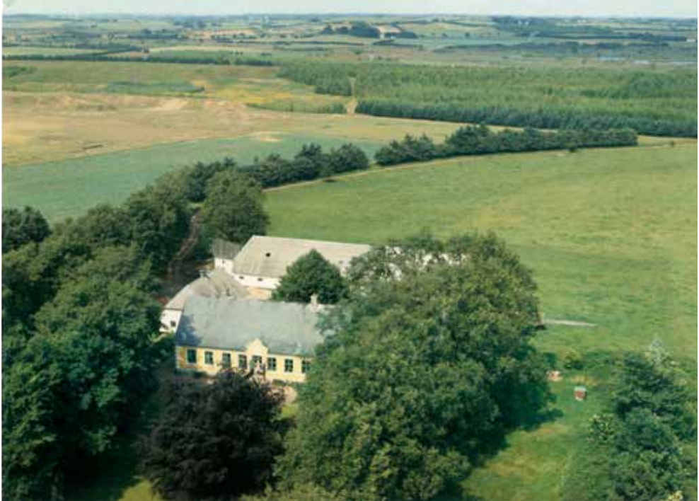
Figur 1: Immervad cirka 1970. Den fredede Hærvej ses mellem træerne. (Kilde: foto privat).

skulle sælges, ellers ville den ryge på tvangsauktion. Vi kom til gården midt på eftermiddagen, og da vi kørte derfra klokken 22.30, havde vi skrevet under på købsaftalen uden at spørge hverken bank eller rådgivere. Med parolen om “at købe i dag – det er dyrere i morgen” var det jo en fordel at skrive under inden morgendagen! Vi skrev under 16. august, blev gift 19. august og overtog gården 1. september 1977. Vi havde høsten med, så hvedebrødsdagene efter brylluppet blev byghalmsdage i Sønderjylland.