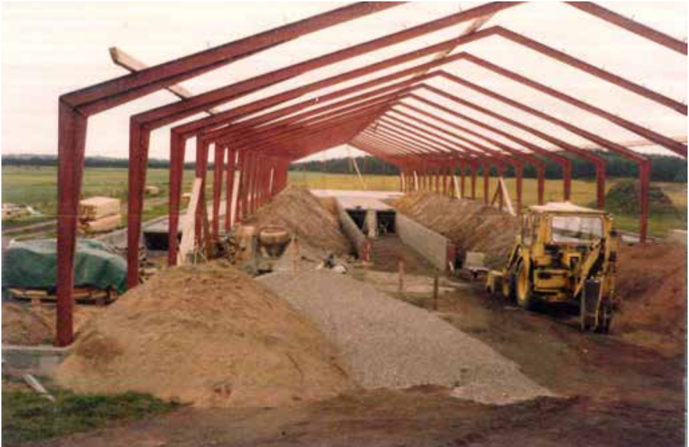
Figur 2: Stalden bygges på bar mark 100 meter fra de gamle bygninger 1978. (kilde: foto privat).

da al lagerkapaciteten kun var i gyllekældrene under spaltegulvene, som det var tilfældet i de fleste stalde.