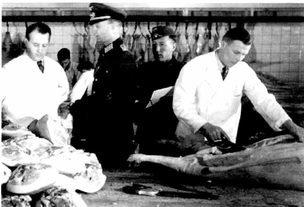
Fig. 3. Tyskere under kontrol på svineslagteri. Billedet med de tyske kontrollanter på et slagteri er et af de eneste af denne type. Under besættelsen sikrede landbrugsorganisationerne under Landbrugsrådet og den danske myndigheder, at der var effektiv kontrol med produktion og forbrug af fødevarer. Dette var afgørende for, at der blev leveret betydelige fødevaremængder til Tyskland. Samtidig slap besættelsesmagten stort set for at anvende ressourcer på den civile administration i Danmark.

sandsynlige grund er, at Scavenius ikke offentligt ønskede at fortælle besættelsesmagten, at den danske regering var godt tilfreds med aftalen, fordi det ville stille de danske myndigheder i en meget dårlig position, hvis produktionsfaldet viste sig større end forventet. Derved kunne det blive vanskeligt at overholde leveringsforpligtelsen uden at beskære det danske forbrug. En anden mulig forklaring er, at han ikke ønskede at fortælle den tyske regering eller regeringerne i andre europæiske lande, at fødevarerituationen i Danmark var meget tilfredsstillende sammenlignet med andre lande.