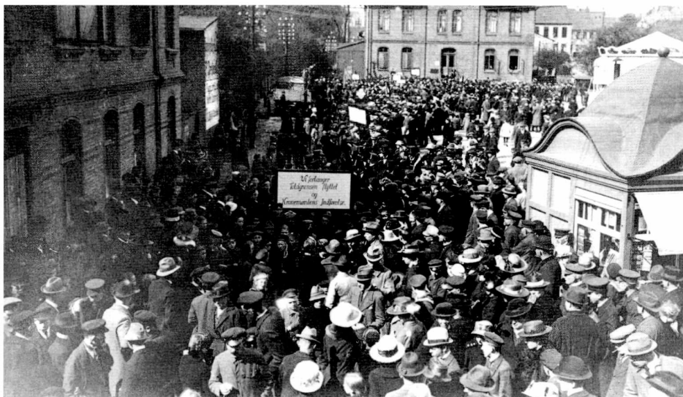
Fig. 6. »Vi forlanger Toldgrænsen flyttet og Kronemøntens Indførelse.« Demonstration på Gravene i Haderslev omkring april 1920. Kronemønten blev allerede i foråret 1919 uofficielt indført som måleenhed for handel og vandel i Nordslesvig. Det skabte meget skæve løn- og prisforhold, hvilket gav anledning til protester i Nordslesvig.

Til sammenligning var de gamle maksimalpriser for rugmel i detailhandel 1,05 mark pr. kilogram og for hvedemel 1,19 mark pr. kilogram. I maj 1920 var markkursen gennemsnitlig 14 kroner for 100 mark. Omregnes de gamle maksimalpriser til kronepriser, var det 14 øre pr. kilo rugmel og 17 øre pr. kilo hvedemel. Kronemøntens indførelse betød, at prisen på rugmel steg med 7 øre pr. kilo og prisen på hvedemel med 47 øre pr. kilo, hvilket var prisstigninger på omtrent 50% og 150%.