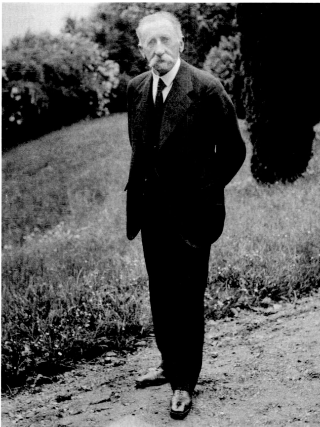
Fig. 3. Minister for sønderjyske anliggender H. P. Hanssen. (1862-1935). Som minister i perioden juni 1919 til marts 1920 udrettede H. P. Hanssen med sine to medarbejdere et stort arbejde for genforeningens praktiske udførelse. Også fødevareforsyningen i afstemningsområdet fik ministerens opmærksomhed.

derjyske udvalg berette, at en deputation fra Flensborg havde været hos ham for at tale om ernæringsforholdene. Deputationen havde udtalt frygt for, at fødevarepriserne ville stige til kroneniveau, når CIS overtog styret. Det ville betyde priser 2-3 gange så høje som de nuværende. Deputationen havde derfor foreslået, at de tyske rationeringer og maksimalpriser blev opretholdt til fordel for forbrugerne under CIS' styre. Dette synspunkt kunne H. P. Hanssen tilslutte sig. Men han mente også, at basale livsfornødenheder som kød, brød, smør, margarine og gryn skulle tilføres fra Danmark. I så fald ville der opstå et tab i forhold til indkøbet af danske varer til kronepriser. I Versaillestrakten var det blevet fastlagt, at omkostningerne ved CIS' administration af afstemningsområdet skulle deles ligeligt af Danmark og Tyskland. Det måtte