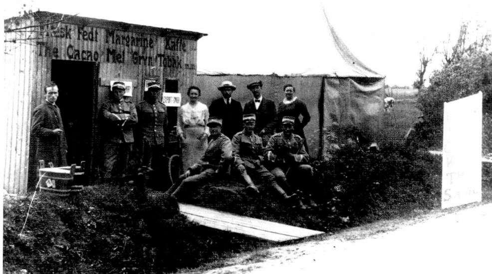
Fig. 2. »Grænsekiosk« ved Kongeågrænsen 1919. Nord for Kongeågrænsen fandt sønderjyderne mange varer, der var utilgængelige i Tyskland. Grænsetrafikken øgedes i 1918-19, og grænsekiosker som denne fra Bastrup ved Vamdrup blev etableret.

hvilket gav grobund for særdeles destruktive politiske meningsytringer samfundslagene imellem. Den utilstrækkelige fødevarerforsyning og sortbørshandelen var væsentlige årsager til denne udvikling. 7