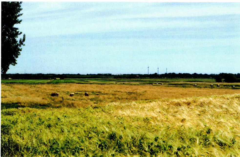
Fig. 7: Sneum Ådal, fotograferet mod øst. Foto: Brian Kristensen, Esbjerg Museum, 2006.

Selvom denne landmand er bevidst om, at han har mindre fritid og dermed måske mindre frihed end de fleste lønmodtagere, føler han sig alligevel privilegeret, fordi han igennem sit arbejde ser sig selv som uafhængig af andre mennesker. Der er dog også landmænd, som ikke er afvisende over for tanken om at finde anden beskæftigelse, hvis de ikke i tilstrækkelig grad kan se frugterne af deres arbejde: