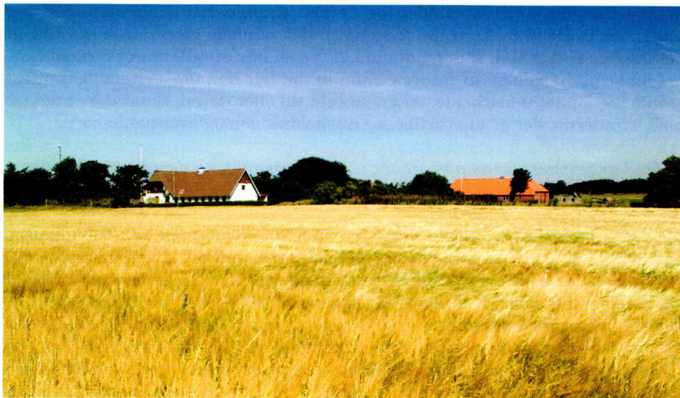
Fig. 4: Kornmark ved Krogsgård Mark, fotograferet mod nordvest.

ingen forskel til det hus, vi havde i Holland, her snakker vi også med naboen, den første uge kom folk ind og sagde hej. Ja, det var fint ... vi snakkede engelsk, men det var lidt svært.