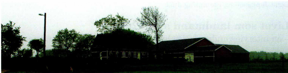
Fig. 1: En gård i Nourup ved Esbjerg.