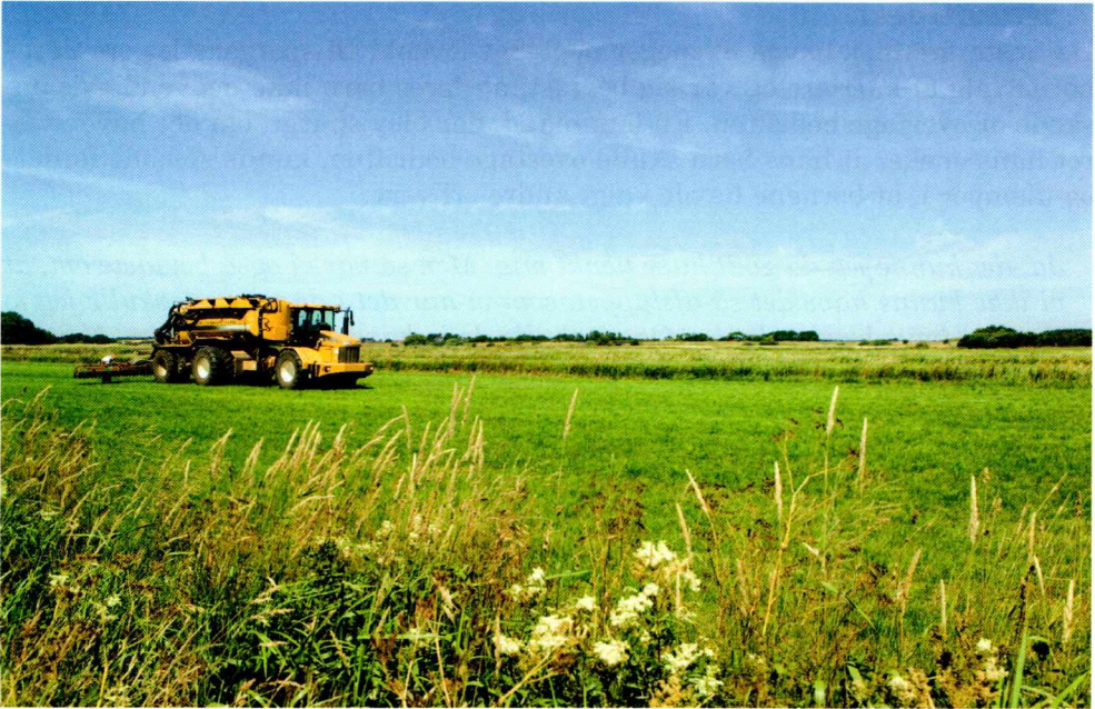
Fig. 6: Der arbejdes på en mark ved Sneum Ådal. Foto: Brian Kristensen, Esbjerg Museum, 2006.

der er ingen konkurrence herhjemme mere. Arla har ingen konkurrence mere.