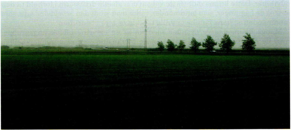
Fig. 3: Opdyrket eng ved Novrup mellem Esbjerg og Tjæreborg.

der tilbage til sin ejermand, når den er klar til at kælle. Under opholdet i kviepensionen skal landmanden ikke blot sørge for daglig pleje og fodring, men også for inseminering af kvierne. Ansvarsfordelingen mellem kviepensionen og kviernes ejermand er som oftest fastlagt på forhånd i en kontrakt, der er udfærdiget med bistand fra en konsulent.