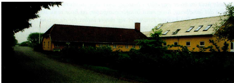
Fig. 2: En gård i Novrup.

med driften af sin virksomhed. Landbruget er altså blevet et vidensbaseret erhverv med færre og større, samt ikke mindst mere specialiserede bedrifter, og kun den, der følger med i den faglige udvikling, kan på længere sigt gennemføre de nødvendige produktionsforøgelse og produktivitetsforbedringer.