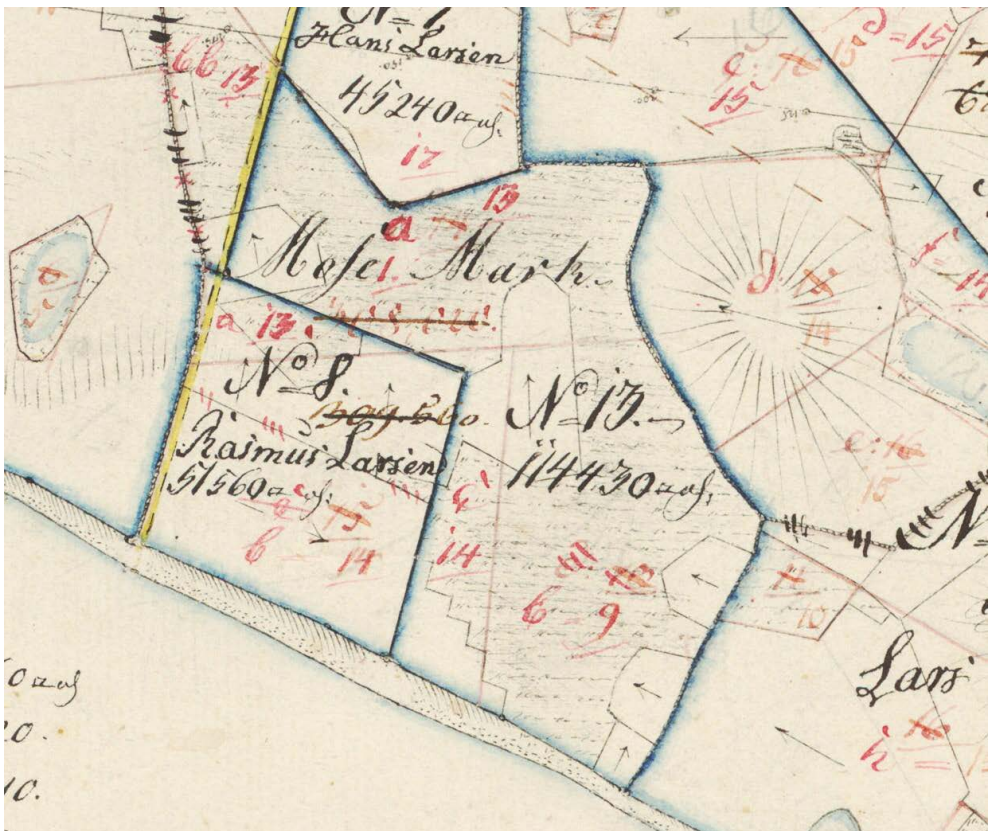
Figur 2. Udsnit af original 1 kort for Bjørnø, 1815. Matrikel nr. 13, Mose Mark, er ikke påført nogen brugers navn – et tegn på, at den er et fælles areal. Styrelsen for Dataforsyning og Infrastruktur.

På Bjørnø havde de seks gårdmænd matrikel nr. 13, Mosemark, i fællesskab. Alle øens 12 husstande var fælles om matrikel nr. 14, som er stranden hele vejen rundt om øen, sammen med de to holme øst for øen. Men i 1905 var både matrikel nr. 13 og 14 fordelt på de individuelle brugere.