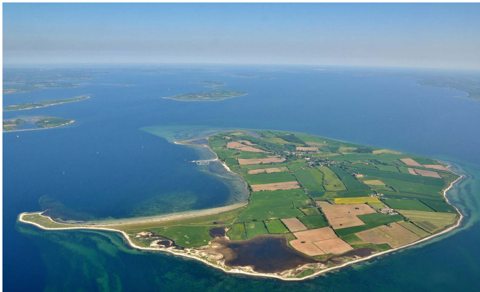
Figur 4. Luftfoto af Lyø med revet i forgrunden.

Lyø er en 614 hektar stor ø, som ligger i Lillebælt syd for Horne Land. Øen består af et enkelt ejerlav, og landsbyen Lyø by ligger centralt på øen. Lyø, der blev uskiftet i 1804, er oprindelig krongods; øen blev pantsat og forlenet til forskellige adelsfolk i løbet af middelalderen – for endelig i 1693 at blive solgt til hovedgården Finstrup, det senere Holstenshuus. Lyø Kirke er opført i forbindelse med reformationen; før denne måtte Lyø-boerne søge til Faaborg. 31