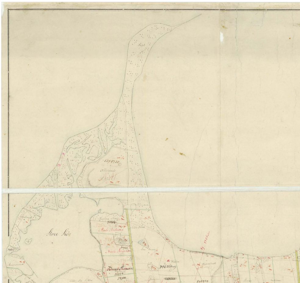
Figur 5. Udsnit af original 1 kort for Lyø, 1804. Matrikel nr. 41 er ikke påført nogen brugers navn – et tegn på, at den er et fælles areal.

Gårdmændene er altså i et eller andet omfang blevet involveret i beslutningen om fællesloddet. På Original 1-kortet ses et lille område mellem Lamme- hoved og Bregnehoved, hvor der er overstreget "Præstens." Her satte de lokale forhandlinger i forbindelse med udskiftningen aftryk på kortet, og vi kan næsten følge med i dramaet, hvor præsten altså ender med at være med i den store fælleslod i stedet for at have sin egen lille græsningslod. Husmændene er naturligvis ikke med i fællesloddet.