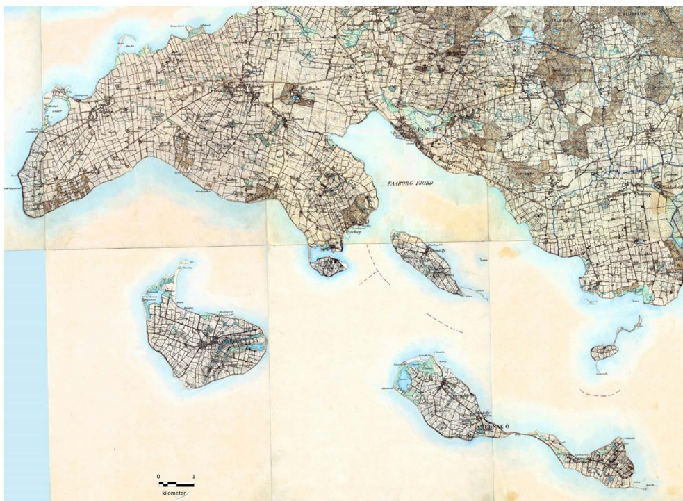
Figur 1. Faaborg Fjord med øerne Lyø, Avernakø og Bjørnø, som de ser ud på de Høje Målebordsblade 1865-1915. Styrelsen for Dataforsyning og Infrastruktur.

Jeg vil tage udgangspunkt i tiden omkring landboreformerne i slutningen af 1700-tallet og slutte undersøgelsen i nutiden. Hermed bruges landbrugets udvikling som prisme til at se ø-livet igennem.