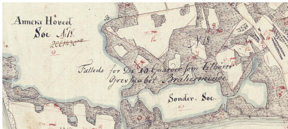
Figur 3. Udsnit af original 1 kortet for Avernakø, bemærk at fællesarealet er beskrevet på kortet. Styrelsen for Dataforsyning og Infrastruktur

Fællesloden på Avernakø bliver altså udskiftet og overgår til ”normal” drift allerede 59 år efter udskiftningen. Man har ingen lokal fortælling eller erindring om en fælleslod, selvom det fremgår meget tydeligt af eksempelvis Original 1-kortet. Den manglende fortælling om fællesloden skyldes formodentlig, at den netop blev udskiftet forholdsvis kort tid efter udskiftningen. Dette viser også, at organisationsform og valg er forskellige fra ø til ø, selvom man kunne fristes til at tro, at øerne har samme forudsætninger og derfor ville vælge ens. Udskiftning, udflytning og overgangen til selveje foregår ligeledes i forskellige tempi på øerne, og tilgangen til fællesarealerne er formentlig et udtryk for samme forskellighed.