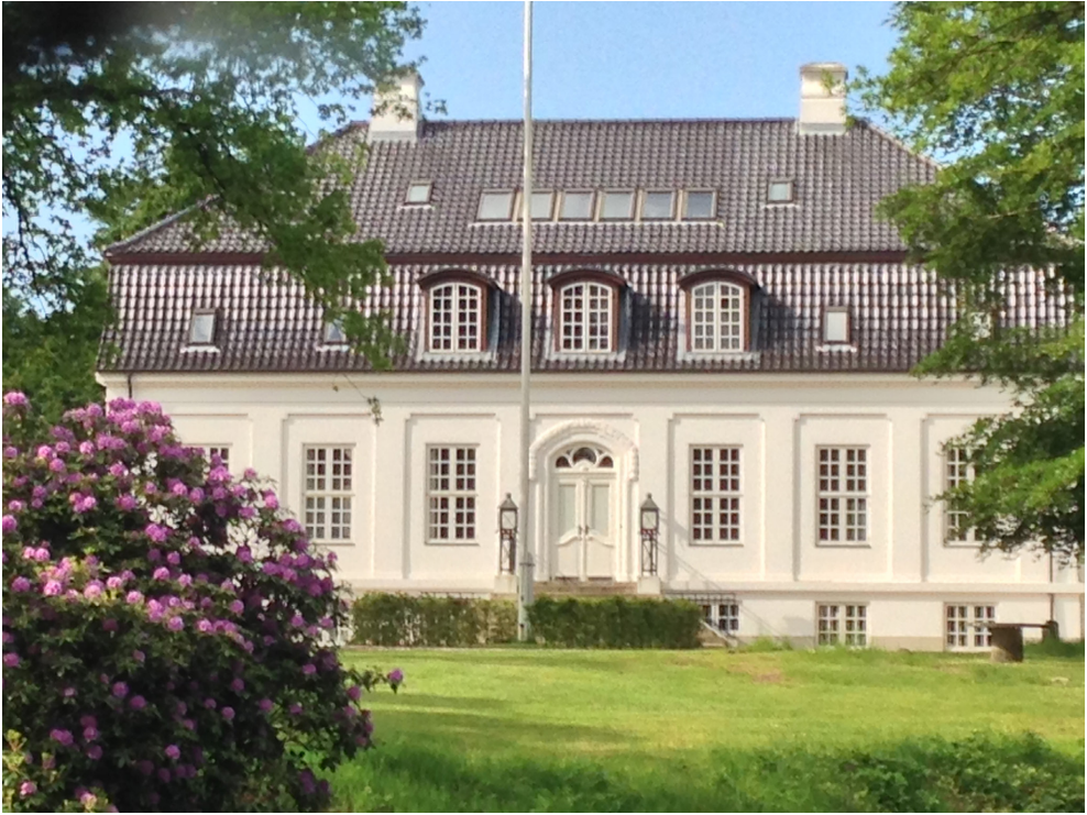
Figur 1. Villa Baldersbæk. Foto: Holger Grumme Nielsen 2014.

Jesper Laursens resultater og tolker periodens herregårdsjagter som ritualiserede handlinger eller som (re)produktion af symbolsk kapital. 6 Boeskov opfatter herregårdsjagterne som et led i en distinktionsproces, som herregårdene kun kunne realisere ved at trække på en forening af forskellige kapitalformer, som kun de færreste var i besiddelse af.