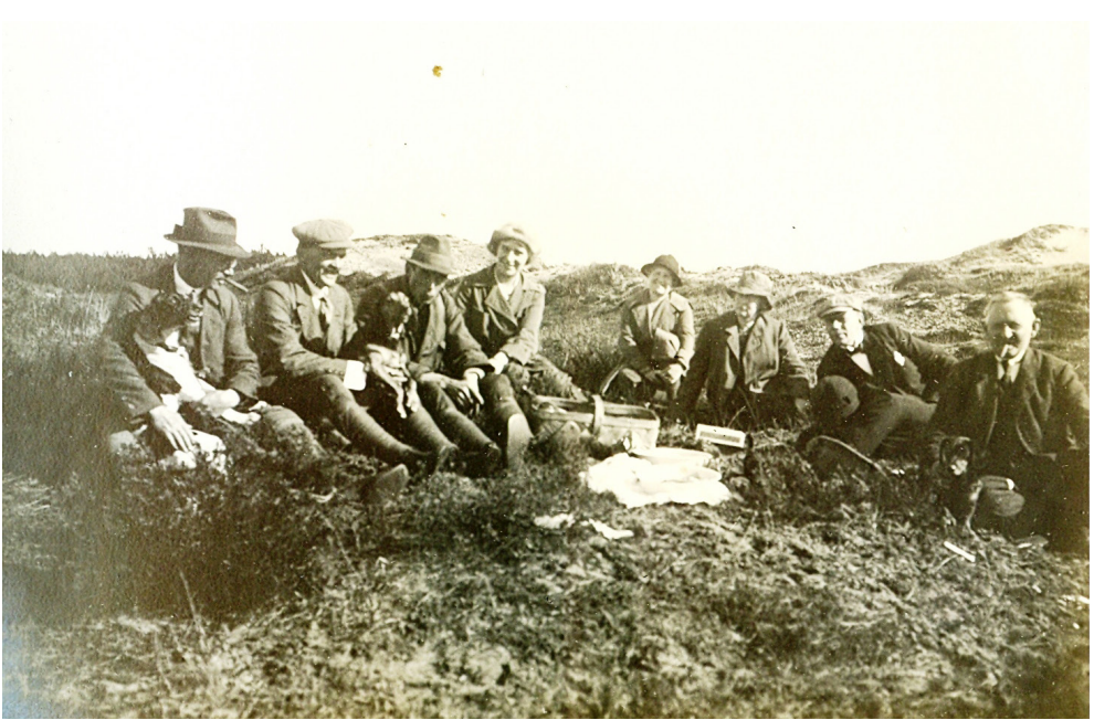
Figur 6. Jagt på Gyttegård omkring 1915.

jagtretten hævdes, 31 ligesom han søgte tilladelse til at udlægge gift her mod rovdyr. 32