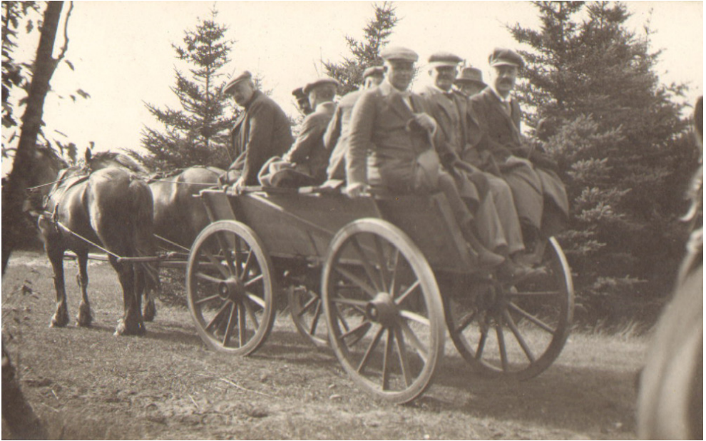
Figur 3. Grosserer-Societetets Komité på Baldersbæk i 1913.