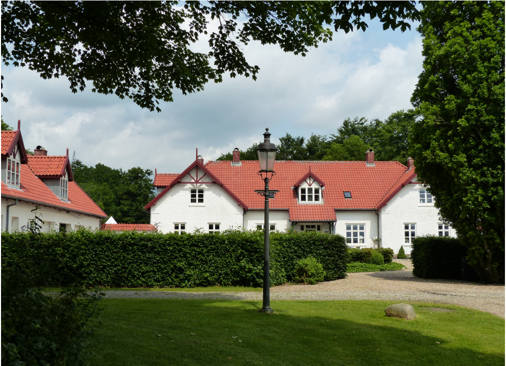
Figur 7. Høllund Søgård, Foto: Holger Grumme Nielsen 2014.

fælles ansættelse med Baldersbæk, Høllund Søgård, Slauggård, Gyttegård og Fromsseier Plantage, blev der ikke ansat nogen efterfølger på Høllund Søgård.