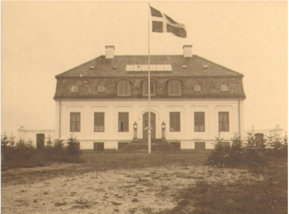
Figur 8. Villa Baldersbæk 1910.

svært at komme på sikkert skudhold i de tæt sammenvoksede nåletræskulturer.