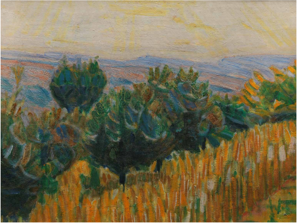
Figur 8. Når det drejer sig om hveden, optræder den som hos forfatterne ofte i forbindelse med bibelske eller udenlandske motiver. Her Niels Larsen Stevns (1864-1941) "Vignen mod lyset. Hvedemark i forgrunden. Villa Linda, Florens" fra 1923. Statens Museum for Kunst.

skrivere i slutningen af 1800-tallet og starten af 1900-tallet havde en forkærlighed for at skildre det hårde, sunde dagligdagsliv på landet; det var rug måske et symbol på. Andre lægger vægt på kornnavnenes lydige tone og mulighederne for rim. Denne artikel lægger imidlertid vægt på at undersøge mere statistisk testbare forklaringer, og sådanne forklaringer lader sig vanskeligt teste.