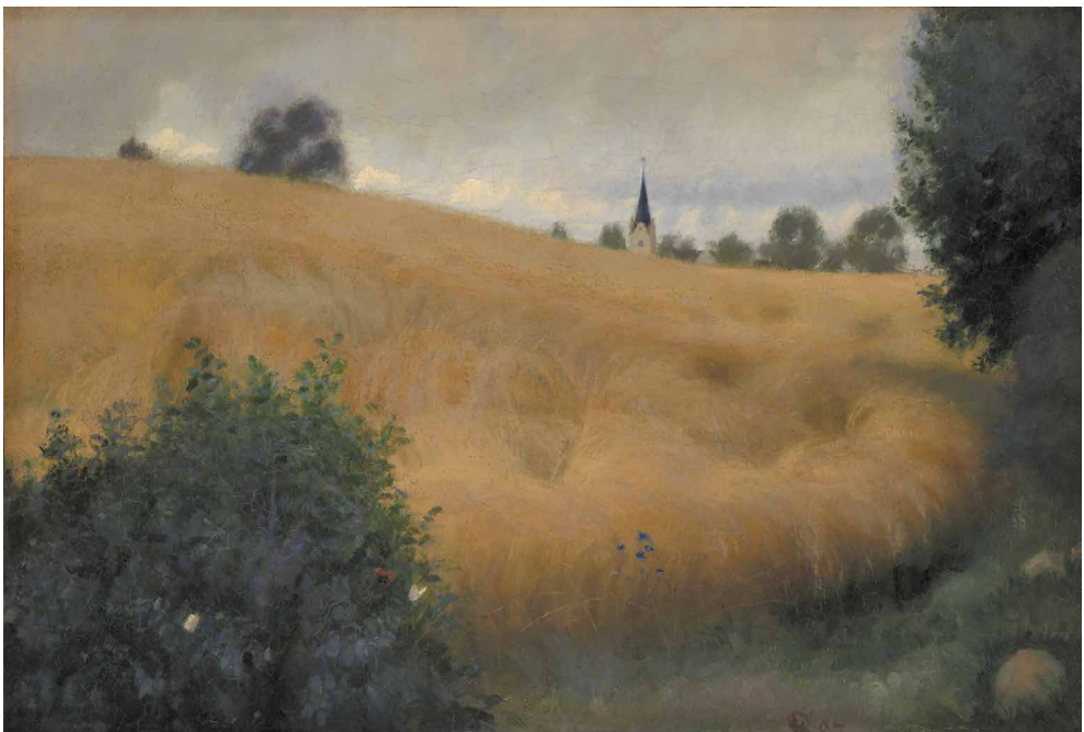
Figur 4. En anden af de ledende ‘fynboer’ var Fritz Syberg (1862-1939), her med maleriet “Rugmark ved Svanninge” fra 1887. Statens Museum for Kunst.