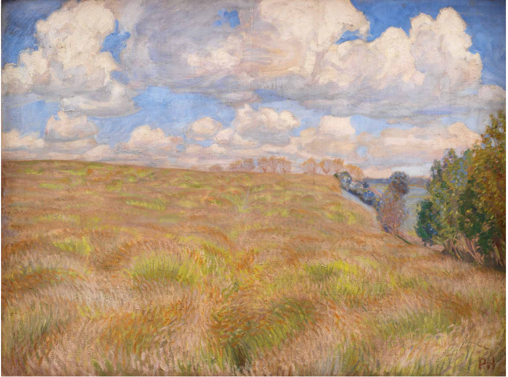
Figur 3. Også i malerkunsten er rugen dominerende. Peter Hansen (1868-1928) var en central skikkelse blandt 'fynboerne'; her med "Bølgende rug" fra 1894. 'Fynboernes' realistiske billeder af dansk landbrug gav anledning til "bondemalerstriden" i 1907 med akademiske københavnere, der anså deres stil for landlig og bondsk. De fynske 'bondemalere' blev i striden støttet af jyske forfattere, bl.a. Jeppe Aakjær. Statens Museum for Kunst.