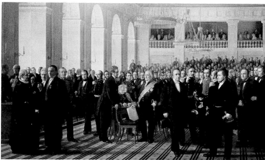
Den grundlovgivende rigsforsamling, maleri af Constantin Hansen (Frederiksborg slot)