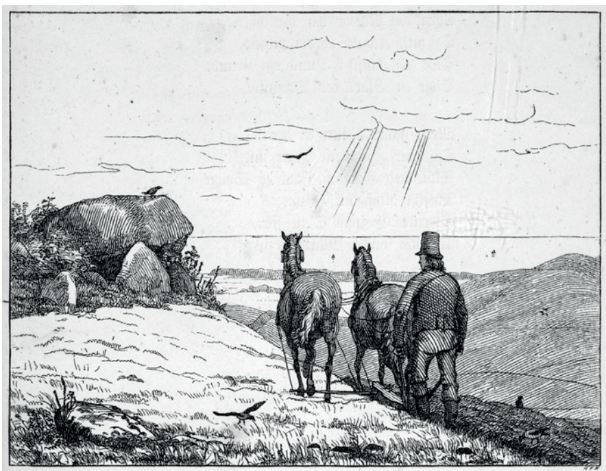
Fig. 9. En bonde pløjer uden om en stendysse på sin mark i ærbødighed for den danske fortid og dens betydning for Danmark. I digtet, som tegningen illustrerer, omtales stendysssen kærligt som "Danmarks Modermærke" og kædes sammen med andre danske symboler som storken, bøgeskoven og lærken. Illustration af H.P. Hansen. – Efter C. Richardt og G. Rode 1866.

A peasant ploughs around the dolmen in his field in veneration of the Danish past and its significance for Denmark in the present. In the poem that the drawing illustrates, the dolmen is lovingly spoken of as "Denmark's birthmark" and is linked with other Danish symbols such as the stork, the beech forest and the lark. Illustration by H.P. Hansen