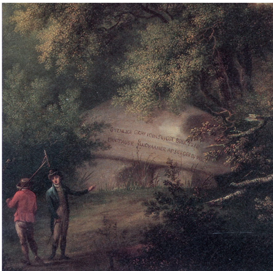
Fig. 3. Den nordiske oldtid gjorde sit indtog i kunsten i slutningen af 1700-tallet. I den romantiske have ved Løvenborg indhuggede man linjerne "O, venlige Grav, i din Skygge boer Fred, din tause Indbygger af Sorgen ei veed" fra C. Prams digt "Stærkodder" i en kunstig dysse. Stendysse spillede en stor rolle i de romantiske haver, hvor den blev tolket som grav og talte til de store følelser og samtidens fascination af fortiden. Elias Meyer, 1805, Statens Museum for Kunst, udsnit. – Efter I. Nielsen 1987.

Nordic antiquity made its entrance into art at the end of the 18th century. In the romantic garden at Løvenborg, lines from the poem "Stærkodder" – Starkad – by C. Pram were engraved into an artificial dolmen ("O friendly tomb, in your shadow peace lives, your occupant knows not of sorrow"). In romantic gardens, a dolmen was often interpreted as a grave and appealed to the contemporary fascination with strong emotions and the distant past.