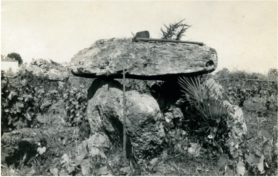
Fig. 7. En storstensgrav fra Beni Messous i Algeriet, fotograferet i 1913. Den er én ud af adskillige storstensgrave i området. Müller omtalte Algeriet som særlig rigt på stendysser, der stod i grupper på mellem 2 og 300.

A megalithic tomb at Beni Messous in Algeria, photographed in 1913. It forms part of a group of megalithic tombs in the area. Müller mentioned Algeria as being especially rich in dolmens, found in groups of two to 300.