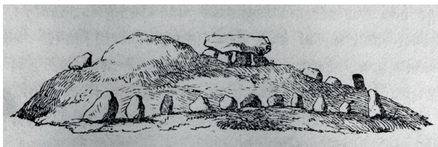
Fig. 4. Gengivelse af Harald Hildetands Høj, som den så ud, da den tyske historiker L.A. Gebhardi besøgte den i 1758. Dog var dækstenen blevet fjernet og brugt til trappesten på herregården Lindholm. – Efter Worsaae 1843.

Depiction of Harald Hildetands Høj as it appeared when visited by the German historian L.A. Gebhardi in 1758. At that time, the capstone had though been removed and used as doorstep at the manor of Lindholm.