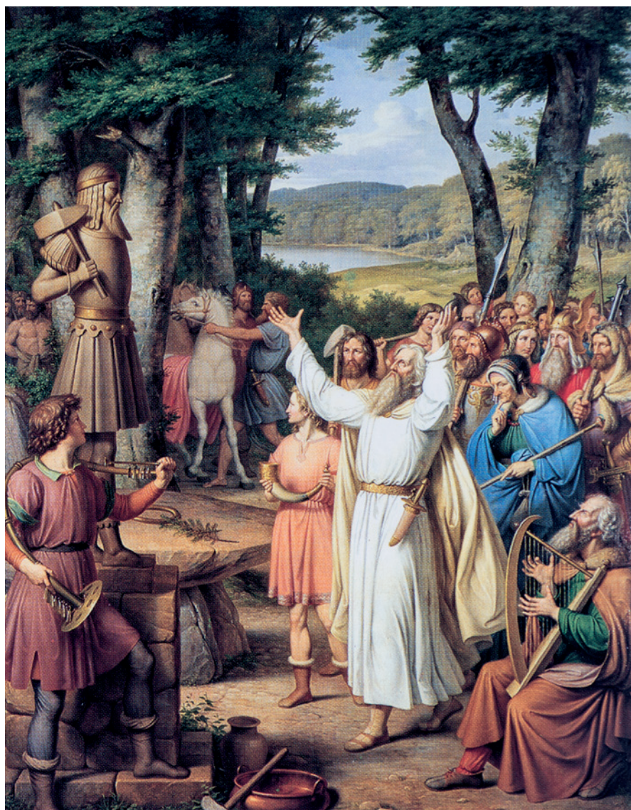
Fig. 2. J.L. Lunds maleri “Nordisk Offerscene fra den Odinske Periode” fra 1831 viser, hvordan forestillingerne omkring stendyssen som alter formede stendyssens udseende. Lunds fremstilling viser et alter, der stemmer overens med Thorlacius’ beskrivelse af altret som havende en flad overligger. – Efter J. Jensen 1994.

J.L. Lund’s painting “Nordic Sacrificial Scene from the Period of Odin” from 1831 shows how perceptions of a dolmen as an altar shaped the portrayal of these monuments. Lund’s version corresponds with Thorlacius’s description of an altar as having a flat capstone.