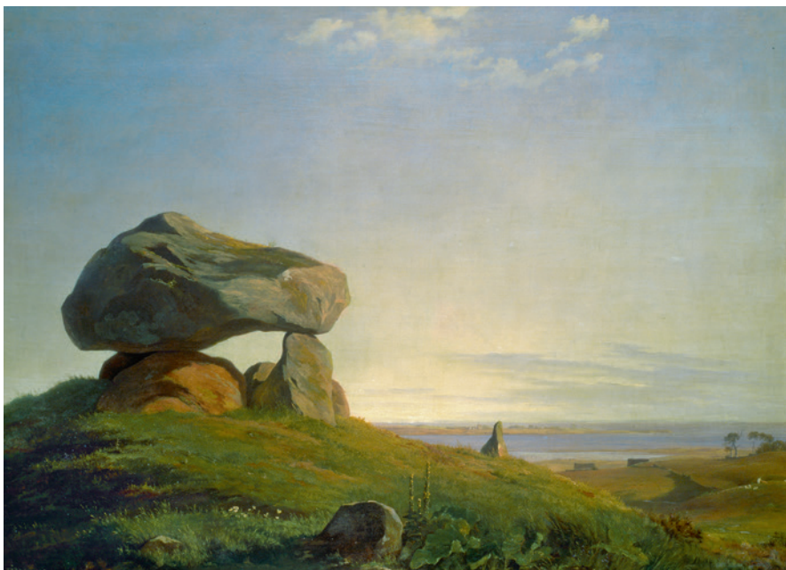
Fig. 6. J.Th. Lundbye brugte ofte stendysser i sine malerier som et materielt levn fra oldtiden, der udtrykte forbindelsen til den danske fortid. Stendyszen er monumentalt placeret i et mildt dansk kystlandskab, som man i Guldalderen anså som udtryk for den danske karakter. "En Gravhøj fra Oldtiden ved Raklev på Refsnæs", 1839. – Thorvaldsens Museum.

Danmark, at en sådan indlemmelse ultimativt kunne ende med, at hele Danmark blev opslugt og ophørte med at eksistere som selvstændig nation. 31 Man ønskede ikke, at Slesvig, som mange anså for at være dansk, skulle skilles fra Danmark og blive tysk. Men også selvforståelsen i landet var trængt. Danmark var efter afståelsen af Norge endegyldigt blevet en europæisk småstat, tyngt af krigsgæld og landbrugskrise. 32 I stedet blomstrede kulturen, særligt den nationalromantiske kunst. Her dyrkede man den danske historie, natur, sprog og kultur i billedkunst, litteratur, musik og teater i et forsøg på at vække nationalfølelsen og dermed styrke nationen. Særligt stendysser spillede en stor rolle, hvor de i malerier af det danske landskab fungerede som en fysisk forbindelse mellem den store danske fortid og nutiden (fig. 6). Den samme instrumentalisering af historien og dens levn ses også hos Worsaae. Han ønskede som nævnt ovenfor at vække følelsen af national ejendommelighed og dermed