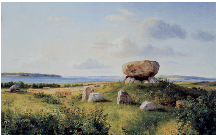
Fig. 5. Allerede før Worsaae skilte stendyssen fra sagnhistorien, var den så småt ved at indtage en ny rolle i billedkunsten. I malerier fra starten af 1800-tallet som J. L. Lunds "Offerscene" var stendyssen en rekvisit i billeder, der viste en religiøs-mytologisk tolkning af fortiden. Men fra ca. 1830 begyndte stendyssen at optræde i idylliske landskabsbilleder, der viste samtidens danske landskab og stendyssen som genstand fra en mere videnskabeligt funderet historie. "Stensætning på øen Brandsø", maleri af Dankvart Dreyer efter 1842.

Even before Worsaae detached the dolmen from legendary history, it had begun to be portrayed in another context in the visual arts. In paintings from the early 1800s, such as J.L. Lund's "Sacrificial scene", the dolmen was used as a device in paintings, demonstrating a religious-mythological interpretation of the past. From about 1830, however, the dolmen began to play a part in idyllic landscape paintings, which portrayed the contemporary Danish countryside and dolmens as elements from a more scientifically founded history.