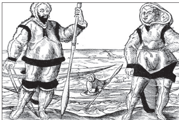
Fig. 8. Træsnit med kopier af John Whites portrætter, trykt af Michael Manger i Augsburg i 1578. – Strauss 1975, bd. 2, s. 667.

Mens manden har været stillet op som en vild eller hedning i klassisk positur, var det ikke muligt at gøre det samme med kvinden Egnoge, med mindre hun skulle fremstilles som en nøgen Venus eller Afrodite, og det ville jo helt fjerne det polare træk. Her var der således ikke mulighed for en billedmæssig markering, idet barnet, der stikker frem fra hættten, ej heller er et universelt symbol. I sammenhæng med Frobishers ekspedition og med billedet af manden som markør var det måske heller ikke så vigtigt for John White at gøre kvinden specielt vild, men det blev det senere. Whites portrætter blev meget hurtigt kendt i Holland, hvad man kan se af, at strandfoged og senere fiskeauktionarius Adrian Coenen (ca. 1514/5-1593) af tegnede både disse portrætter og portrættet af inuitten fra 1576 mellem 1577 og 1578, og han betegnede dem som Cathaiiske folk, altså kinesere. På Coenens tegninger løses problemet ved