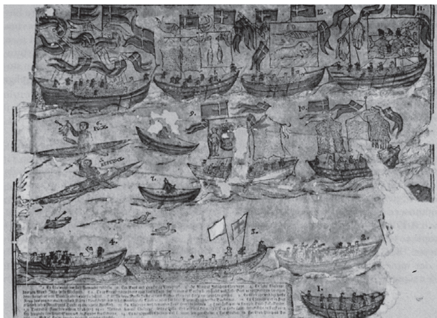
Fig. 10. Det grønlandske optog i København den 9. november 1724. – Efter V. Traeger 1992, s. 128.

The Greenland procession in Copenhagen, 9 November, 1724.