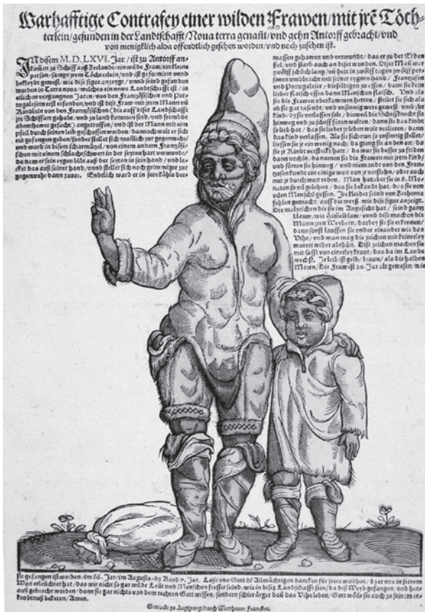
Fig. 1. Det første reelle europæiske portræt af en inuit fra 1567. – Efter Sturtevant 1980, s. 48.