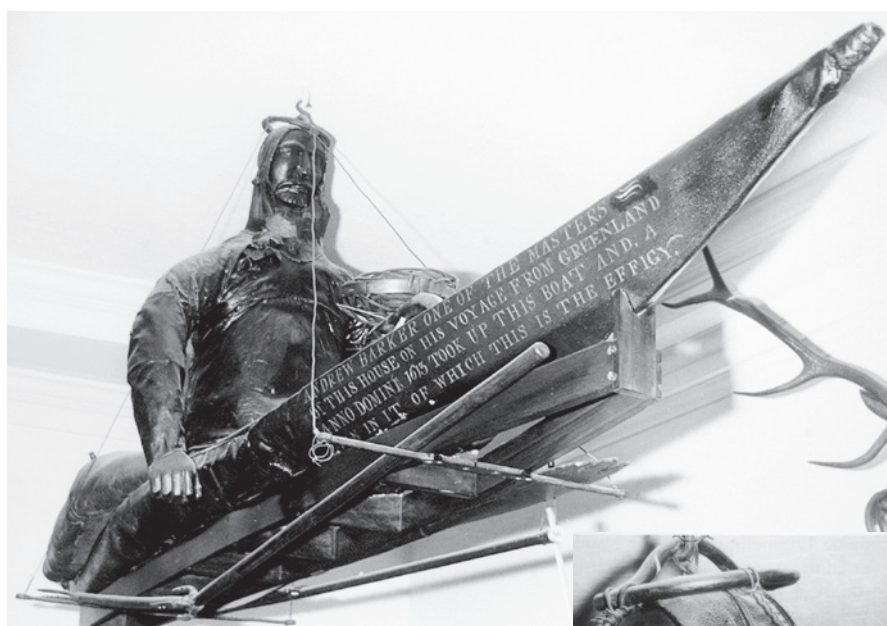
Fig. 15. Den skæggede vilde fra Grønland i Trinity House i Hull. Bemærk fuglespyddet ved siden af kajakken.

The bearded wild man from Greenland in Trinity House in Hull. Note the bird-spear alongside the kayak.