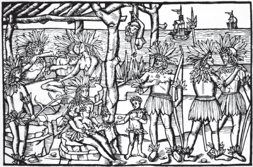
Fig. 5. Det tidligste billede af indianere med fjer. Det formodes at stamme fra Augsburg fra mellem 1497 og 1504. Bemærk mændenes velplejede fuldskæg. – Efter M.T. Hodgen 1964, s. 149.

The first illustration of an American Indian with feathers. This print is supposed to originate from Augsburg and dates from 1497-1504. Note the men's trimmed full beards.