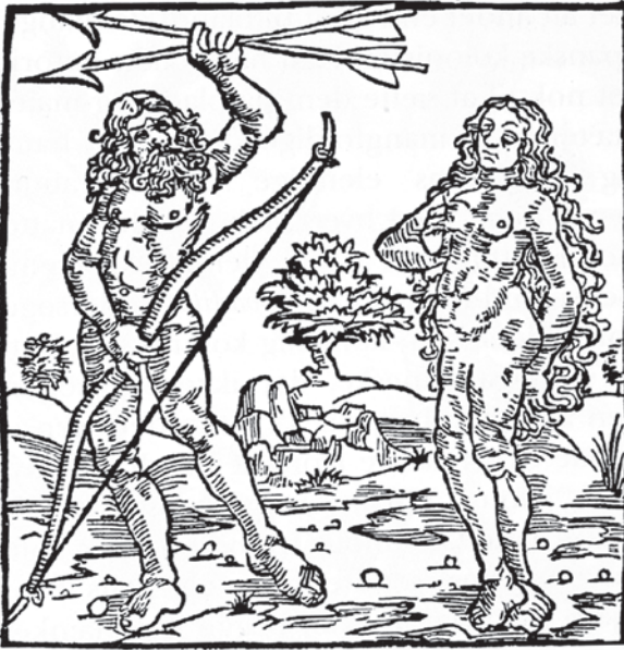
Fig. 6. Træsnit med fremstilling af indianer som vildmand fra 1505. – Efter H. Henningsen 1992, s. 57.

Woodcut from 1505 presenting an American Indian as a wild man.