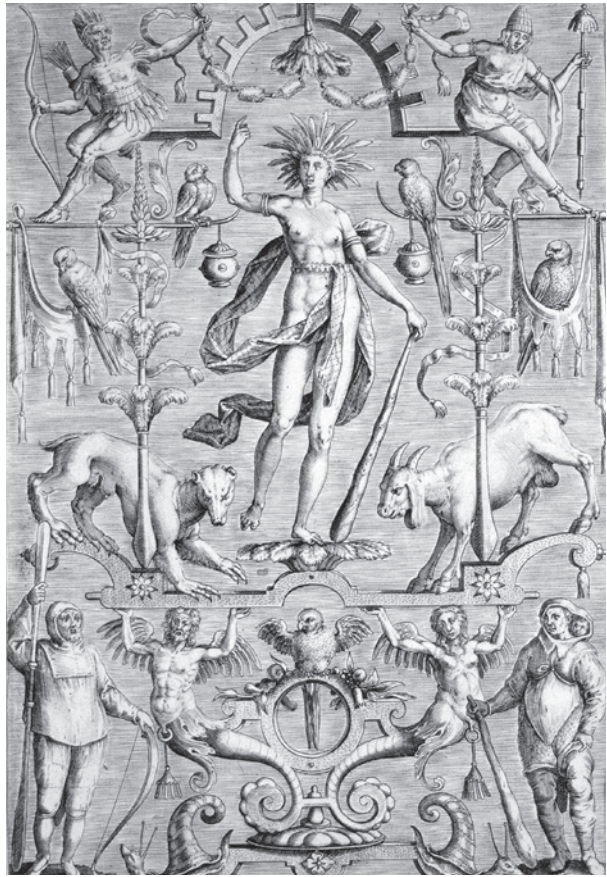
Fig. 13. Philipp Galles kopi af John Whites portrætter af kvinden med kølle og manden med fuldskæg. Bemærk også, at kvinden i midten, der symboliserer det unge Amerika, er blevet prydet med de allerede dengang traditionelle indianerfjer.

The Philipp Galle copy of John White's Inuit portraits of the woman with a club and the man with a beard. Note that the woman in the middle, who symbolises young America, is decorated with feathers, already a traditional symbol of the American Indian at the time.