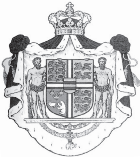
Fig. 4. Det danske kongevåben med to vildmænd som skjoldholdere. Brugen af vildmænd som skjoldholdere ses i dansk sammenhæng første gang i Christian I's kongevåben fra 1449, og her har vildmændene stort skæg og pels.

The royal Danish coat of arms with two wild men as escutcheon-bearers. In Denmark, wild men dressed in fur and with hirsute beards were first used as escutcheon-bearers in King Christian I's coat of arms from 1449.