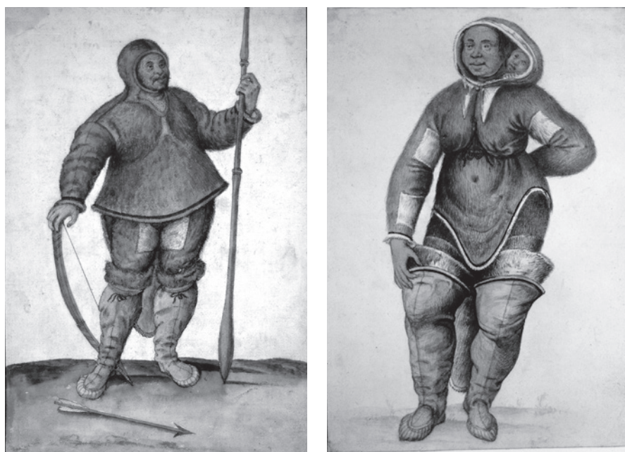
Fig. 3. John Whites portræt af den vilde mand og den vilde kvinde og hendes barn fra Frobishers anden ekspedition i 1577.

De tre inuitter fra den anden ekspedition blev også portrætteret flere gange, før de døde. Cornelis Ketel blev igen tilkaldt, og han malede i Bristol fire billeder af kvinden og barnet, men disse billeder er ligeledes forsvundet. De tre indfødte blev også malet af John White (død ca. 1593), og her eksisterer portræterne endnu, endog i mange kopier af forskellig kvalitet, hvoraf de mest originale befinder sig på British Museum. På Whites portrætter fremstilles kvinden set forfra og med babyen kikkende frem i hættten på pelsen (fig. 3). Portrættet af manden findes i flere versioner, 6 og på dem alle er kompositionen