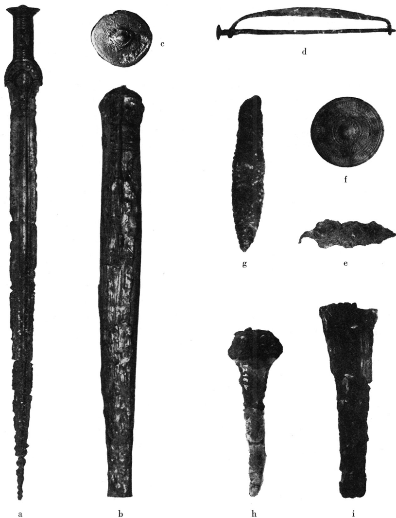
Fig. 2. De i graven fundne genstande: a) bronzesværd, b) sværdskede, c) sværdknop, d) bøjlenål, e) bronzekniv, f) tutulus, g) flintdolk (ildsten), h) bronzedolk, i) dolkskede. Objects found in the grave: a) bronze sword, b) sword scabbard, c) sword pommel, d) fibula, e) bronze knife, f) tutulus, g) flint dagger (fire-stone), h) bronze dagger, i) dagger sheath.