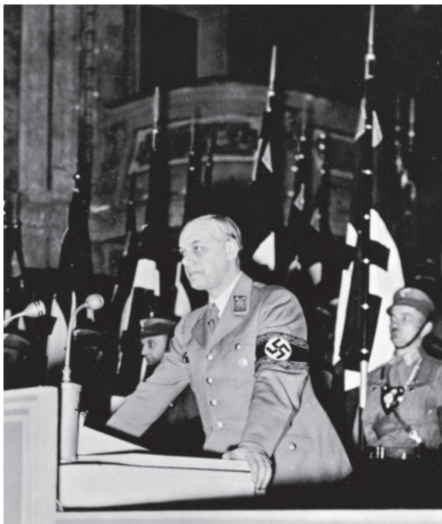
Fig. 2. Alfred Rosenberg (1893-1946) på talerstolen ved et SA-fører møde i Posen. Rosenberg blev regnet for det tyske nazistparti NSDAP's chefidéolog. Hans »Der Mythus des 20. Jahrhunderts« var ved siden af Adolf Hitlers »Mein Kampf« et af den nazistiske bevægelses centrale værker. Alligevel oplevede Rosenberg efter Hitlers magtovertagelse 1933 en stadigt større politisk marginalisering. Efter krigen blev Rosenberg dømt til døden og henrettet i 1946.

Alfred Rosenberg (1893-1946) on the rostrum during an SA-Führer meeting in Posen. Rosenberg was considered the chief ideologist of the German Nazi party NSDAP. Next to Hitler's "Mein Kampf", his "Der Mythus des 20. Jahrhunderts" was one of the central works of the Nazi movement. All the same, following Hitler's takeover in 1933, Rosenberg was increasingly marginalized as regards political influence. After the war, Rosenberg was sentenced to death and executed in 1946.