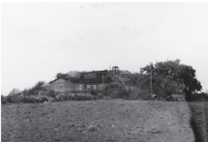
Fig. 11. Tamdruphøj øst for Haderslev 1945.