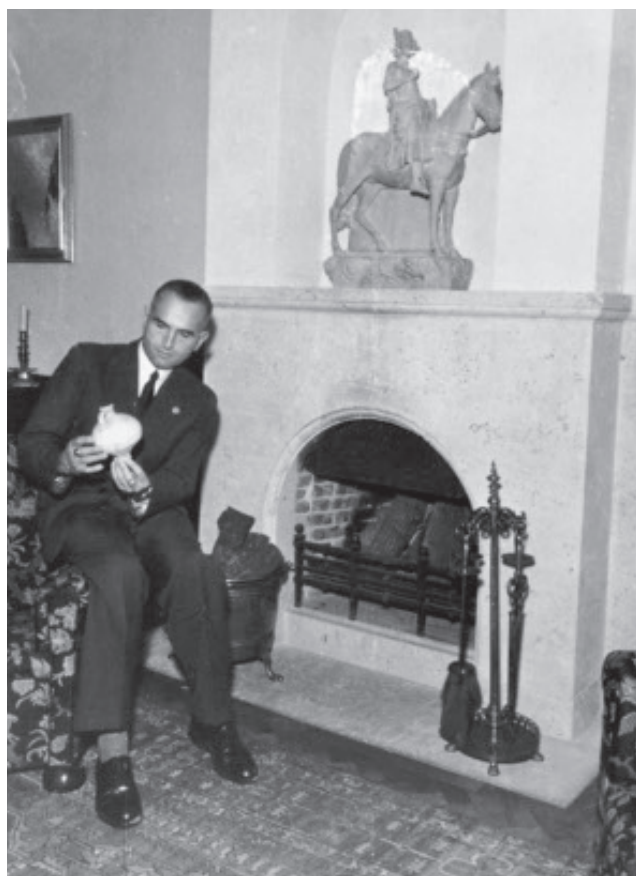
Fig. 5. Werner Best (1903-1989). Best blev medlem af NSDAP i 1930 og avancerede efter Hitlers magtovertagelse hurtigt inden for det tyske sikkerhedspoliti. Best, der var forfatter til en række skrifter om tysk storrumsideologi, afløste i november 1942 Cecil Renthe-Fink som tysk rigsbefuldmægtiget i Danmark. Best blev efter befrielsen dømt til døden, men dommen blev ændret til først fem og siden til 12 års fængsel. Best blev dog løsladt i 1951 og skabte sig efterfølgende i Vesttyskland en karriere i det private erhvervsliv.

Werner Best (1903-1989). Best became a member of the NSDAP in 1930 and quickly advanced within the German security police after Hitler's takeover. Best – the author of a number of publications on German superiority ideology – succeeded Cecil Renthe-Fink as German Reichs Plenipotentiary in Denmark in November 1942. After the Liberation, he was sentenced to death, but the sentence was changed to five and later to 12 year's imprisonment. However, Best was released in 1951 and became a businessman in West Germany.