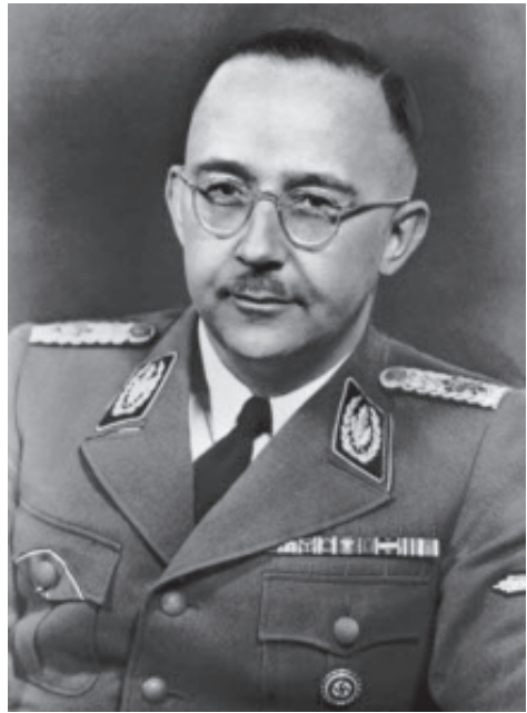
Fig. 1. Heinrich Himmler juli 1944. Himmler (1900-1945) hørte allerede i begyndelsen af 1920'erne til inderkredsen omkring Adolf Hitler og NSDAP og deltog bl.a. i Hitlers kupforsøg i München i 1923. Med udnævnelsen til rigsfører for SS og chef for det tyske politi i 1936 blev Himmler ansvarlig for det nazistiske terrorapparat og en af det tredje riges mægtigste mænd. Himmler begik selvmord i britisk krigsfangenskab den 23. maj 1945.

Heinrich Himmler, July 1944. Already in the early 1920s, Himmler (1900-1945) belonged to the inner circle around Adolf Hitler and the NSDAP, and he took part in Hitler's attempted coup in Munich in 1923. With his appointment as Reichsführer-SS and head of the German police in 1936, Himmler was responsible for the Nazis' terror apparatus and one of the most powerful men in the Third Reich. Himmler committed suicide on the 23rd of May 1945, while the British held him as a prisoner of war.