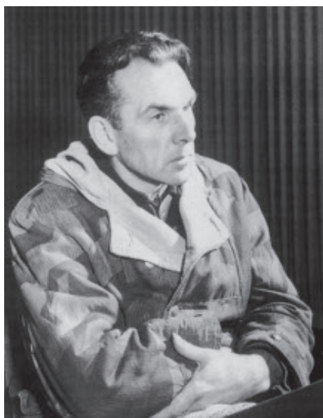
Fig. 6. Wolfram Sievers (1905-1948). Sievers fungerede 1937-1945 som forretningsfører for Ahnenerbes ca. 40 videnskabelige afdelinger. For sit medansvar for en række medicinske forsøg på fanger i kz-lejrene Dachau og Natzweiler udført af læger tilknyttet Ahnenerbe blev Sievers dømt til døden og henrettet i 1948. – Efter Greif 2000.

Wolfram Sievers (1905-1948). From 1937 to 1945, Sievers functioned as the executive secretary of the approximately 40 scientific departments within the Ahnenerbe. In 1948, Sievers was condemned to death for his co-responsibility in a number of medical experiments made on prisoners in the concentration camps of Dachau and Natzweiler, carried out by physicians connected to the Ahnenerbe.