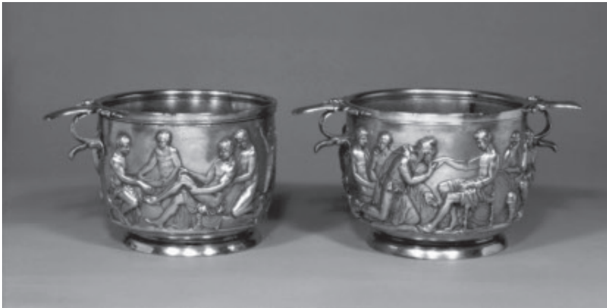
Fig. 1. Hobygravens udstyr. – Nationalmuseet.