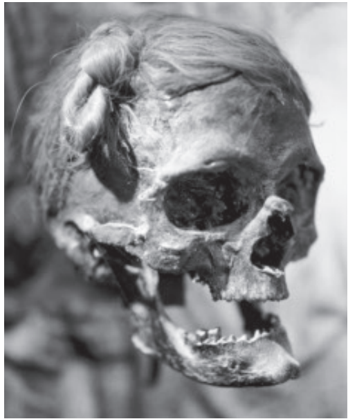
Fig. 3. Dätgenmanden med såkaldt »sveberknode«. Bemærk forskellen i form og placeringen (i baghovedet) i forhold til Osterbymanden. – Schleswig-Holsteinisches Landesmuseum, Gottorp.

The male cranium from Kühlmoor, Osterby with so-called “Swabian knot”. Found in 1948.