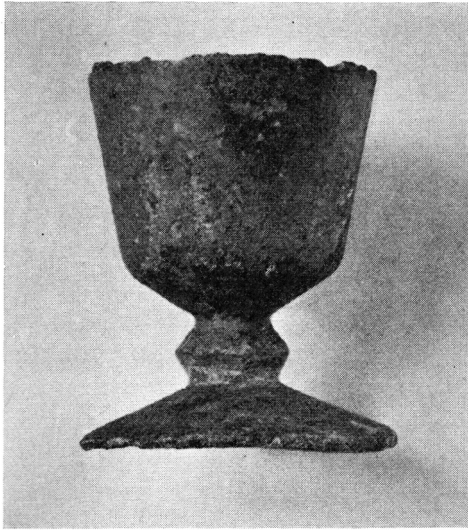
Fig. 5. Åseral-kalken. The Åseral chalice, c. 1:1.

karakterer på nær alfabetets tre første runer, og måske spredt et par flere 12 ).