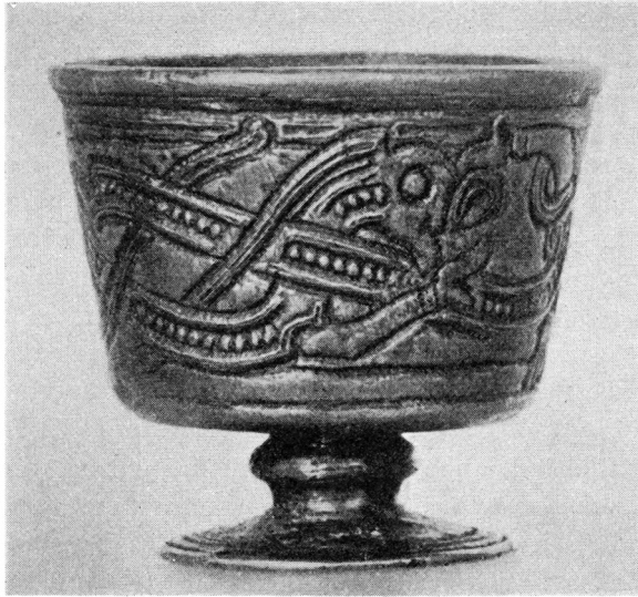
Fig. 1. Jellingebægeret. The Jelling beaker, c. 3:2.