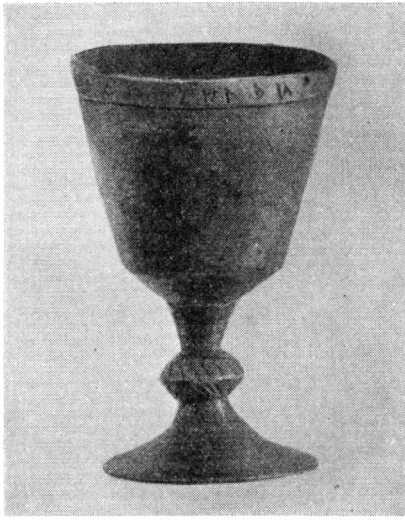
Fig. 4. Tømmerup-kalken. The Tømmerup chalice, c. 1:1.

Sverige langtfra kristnet, hvilket – foruden ejernavnet – gør det højst rimeligt, at kalken har hørt til en fremmed rejseklerks i udlandet tilvirkede udstyr. Jellingebægeret er derimod et nordisk produkt, smykket i nordisk stil som det er, måske betyder det da ikke så meget, at det ikke i alle detaljer er skabt efter samtidige europæiske normer. Bortset fra Adalward-kalken er der ikke i hele Skandinavien bevaret een eneste nadverkalk fra vore to første, kristne århundreder, det er derfor ikke udelukket, at kalke af façon som Jellingebægeret dengang slet ikke har været noget særsyn. To jordfund, eet fra en dansk, et andet fra en norsk kirkegård, tyder virkelig på, at der hos os, jævnsides med den i Europa ellers almindelige, har eksisteret en type rejse- eller præstekalke, hvis form var beslægtet med eller afledt af Jellingebægerets.