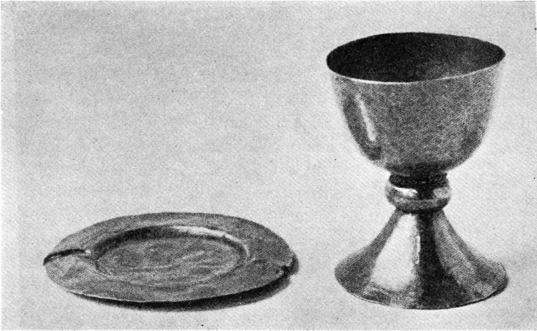
Fig. 2. Paten og kalk, fra ærkebiskop Poppo af Triers grav. Paten and chalice from the grave of Archbishop Poppo of Treves, c. 1:1.

holdepunkt i den sene vikingetids stilhistorie. Det er ikke ligegyldigt, om de fund, som har givet Jellingestilen navn, er kommet i jorden en menneskealder før eller senere. Og endelig må man understrege, at hvis Jellingebægeret virkelig tør opfattes som en nadverkalk, så er det den ældste, vi ejer i norden, og ikke bare en smuk og sjælden oldsag, men et yderst kosteligt og ærværdigt klenodie.