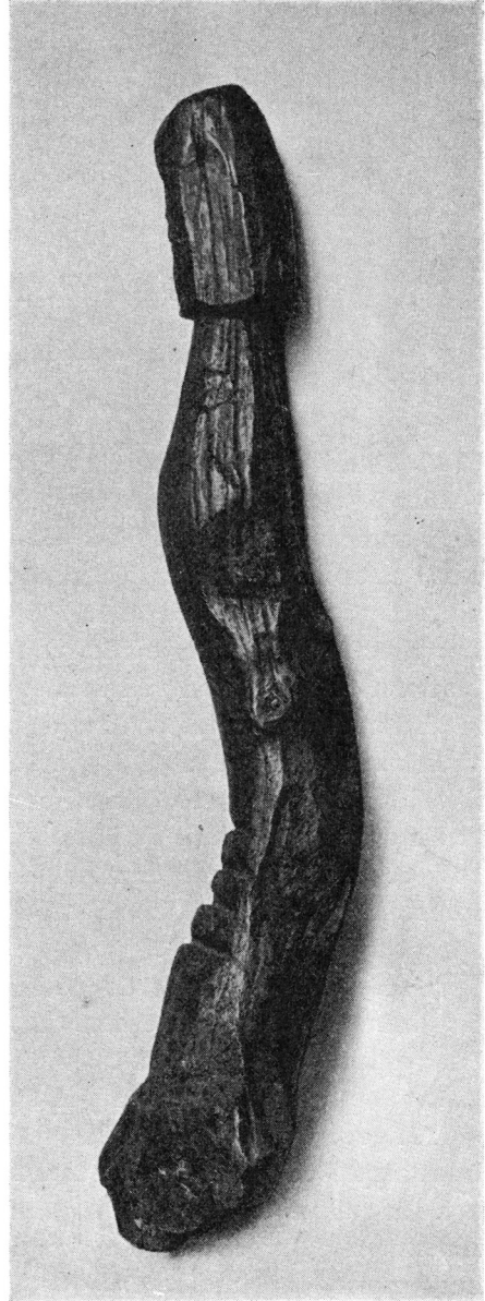
Fig. 1. Frøya fra Rebild, set forfra og fra siden. Frøya from Rebild, front and side view. Ca. 1:7.