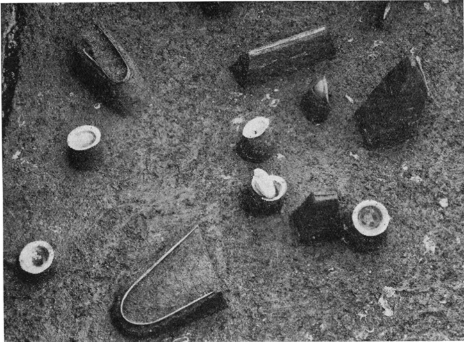
Sværd og skjoldbuler m. m. spredt på søbunden. Swords, shield bosses, etc., scattered on the bed of the lake.

pladsens område må man på steder gennem 6–7 meter tørvelag for at komme til den faste istidsbund. Et »bundløst« mosehul har det været. Man forstår godt, at fortidens mennesker har tænkt sig mystiske magter boende under det mørke vandspejl.