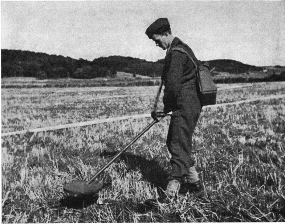
Minesøgeren i arbejde. The mine detector at work.

nævnes med behørigt forbehold. På det ganske lille område, som blev afdækket, fandtes flere oldsagstyper, som ikke kendes fra den gamle plads. En af dem var et ubrændt stykke af en spydstage. Dette kunne tyde på, at vi står overfor en anden (yngre??) nedlæggelse end den eller dem, vi hidtil har arbejdet med, og måske en nedlæggelse, hvor sagerne ikke er brændt, eller hvor brændingen har været mindre omfattende.