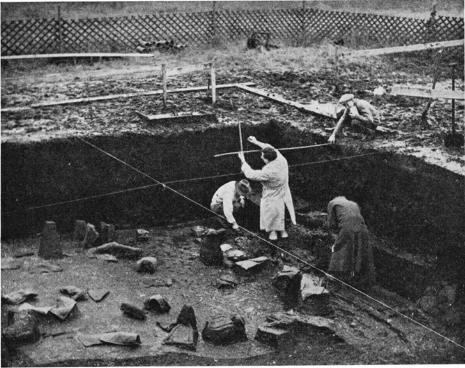
En oldsag indmåles med lod og tommestok. An object is plotted in by means of plumbline and rule.

lange tider, som en højst uvelkommen gæst. Glade var vi, da vi havde vore billeder vel i hus. Prøver på resultatet af dette fotografiske mare-ridt ses på disse sider.