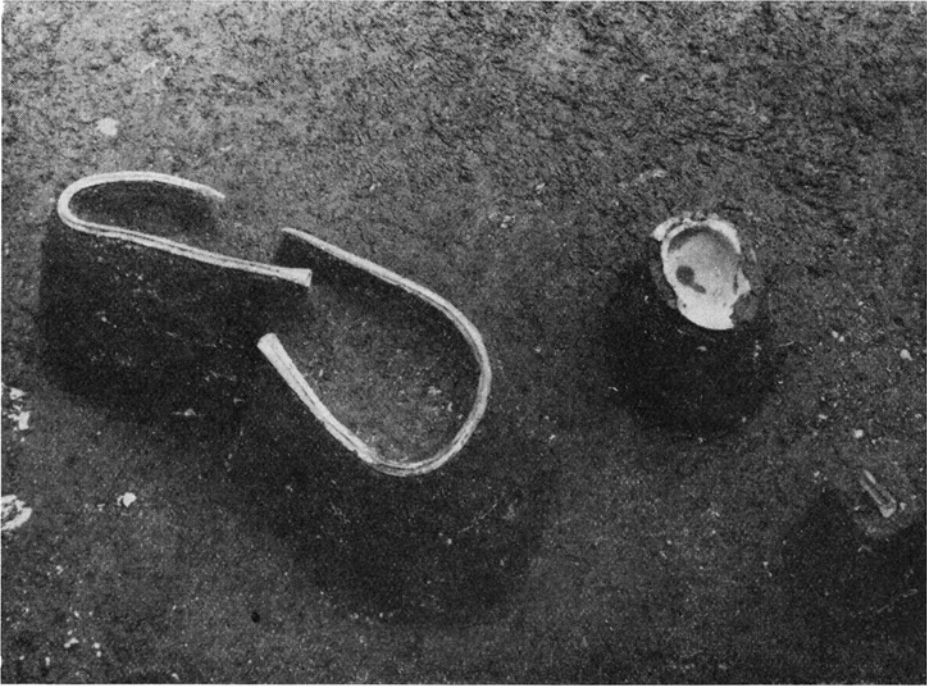
To sammenbøjede lansespids, en skjoldbule og en ildsten. Two bent lancepoints, a shield boss and a "strike-a-light".

Dalens tilblivelse ligger 15–20.000 år tilbage i tiden. En istidsflod, en rivende smeltevandsstrøm, har hulet den ud, og der var det særlige ved denne flod, at den løb i en tunnel under isen. Da isen trak sig tilbage, blev dalen til en sø. Sådan lå den i årtusinder, mens plantevæksten langs dens bredder langsomt – under klimaets indflydelse – skiftede fra tundravegetation til fyrreskov og fra fyrreskov til egeskov. Bæveren har levet ved denne sø. I hundredevis finder vi dens efterladenskaber, små korte pinde med gnavemærker i enderne, mærker, der for en flygtig betragtning skuffende kan ligne snit af en kniv. I slutningen af stenalderen og i bronzealderen groede søen til og blev til mose. Så kom i tidligste jernalder en klimaforværring, der igen forvandlede mosen til sø, og først da klimaet atter mildnedes, kunne tilgroningen fortsætte. Tilgroningen blev efterhånden fuldstændig. Mosen dækkedes med ellekrat, og sådan ser den på steder ud den dag i dag. Størsteparten henligger dog nu som eng, og traktorerne begynder så småt at tage land.