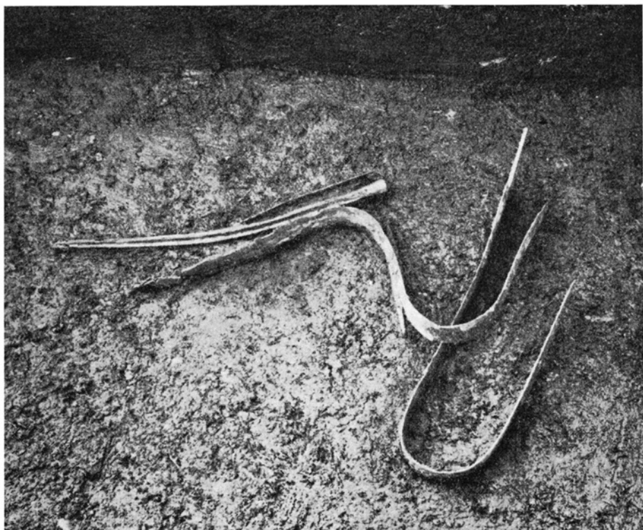
Sværd, lansespids og jernknive i dyng. Swords, a lancepoint and iron knives in a heap.

hegn eller lignende, der viser, at hertil og ikke længere går pladsen. Sagerne ligger tilfældigt nedsunket i dyndet – vandret, lodret, på kant, på fladen – mellem tusinder af snegle og muslinger, som engang har levet deres liv i mosen. Oldsagslaget falder, som naturligt er, jævnt udefter. De yderste sager ligger mere end to meter under moseoverfladen – en dybde, hvorfra det volder vanskelighed at hente dem op. Nærved hinanden liggende sager kan ofte ligge i noget forskelligt niveau, hvilket jo normalt skulde betyde, at de er nedlagt til forskellig lig tid, en tanke, der imidlertid modsiges af sagernes ensartethed. En anden forklaring kan da også tænkes og skal blive nærmere omtalt nedenfor.