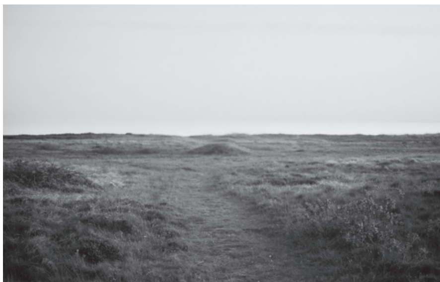
Fig. 10. Søndre Dødemands Grav, 1990.

The southern Dødemands Grav (Dead Man's Grave), 1990.