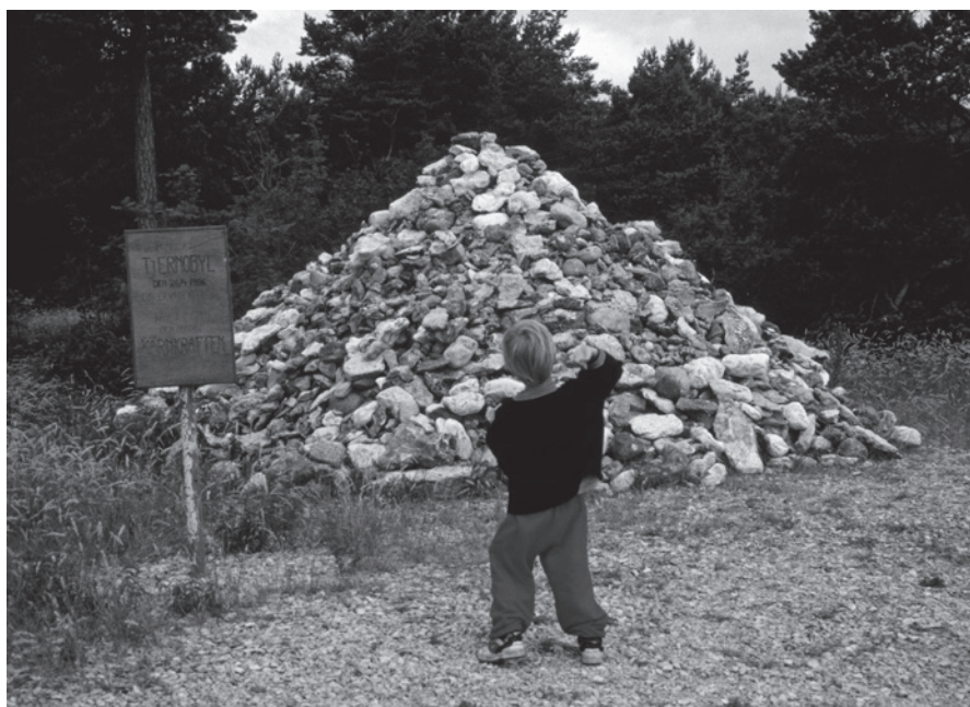
Fig. 13. Dette stenkast på det nordlige Gotland opstod i 1990'erne for at afværge atomkraftens ulykker.

Den ældre folkemindeforskning så traditionen som levn af hedenske ritualer og forestillinger. Som en reaktion mod dette anlagde Solheim og andre en traditionsfunktionalisk synsvinkel, hvorved det meste af folketroen ud fra de kulturelle forudsætninger viste sig at være rationel, og resten lod sig forklare som en slags pseudotro, f.eks. pædagogiske fiktioner og narrerier.