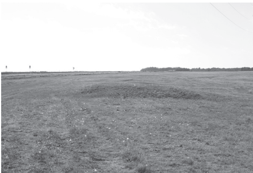
Fig. 11. Kræmmermandens Høj på Draget mellem Thyholm og Thy, 2006.

The Kræmmermandens Høj (“The Tradesman’s Mound”) on Draget between Thyholm and Thy, 2006.