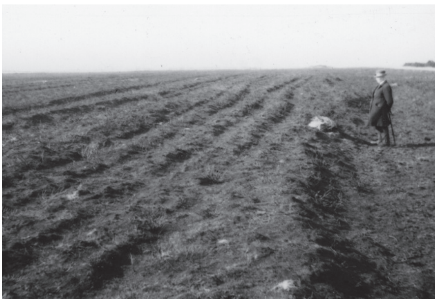
Fig. 1. Stenkastet på Trøstrup Hede ses foran manden på dette foto fra 1932. De dybe hjulspor over heden forklarer, hvordan en hurtigkørende, overhalende hestevogn kunne komme i slinger og vælte.

The stone pile on Trøstrup Moor is visible in front of the man on this photo from 1932. The deep wheel tracks across the moor explain how a fast moving, overtaking carriage could sway and overturn.