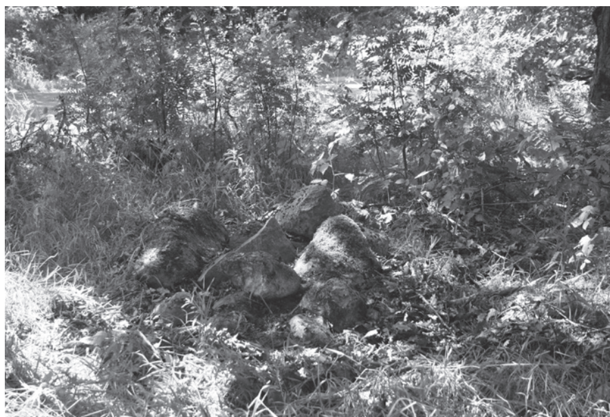
Fig. 12. Stenkastet i Refshale mellem Kragelund og Engesvang fotograferet i 2006. – Foto: J. Laursen.

The cairn in Refshale between Kragelund and Engesvang, photographed in 2006