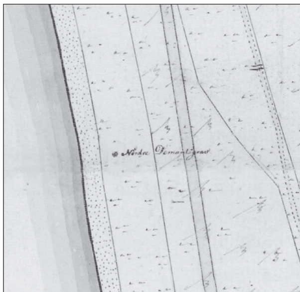
Fig. 8. Nordre Demants Grav afsat på Original I-kort fra 1811 over Nordby Hede på Samsø.

The previous pile of branches called Kjelds Grav in Vendsyssel with a memorial stone, photographed in 2006.