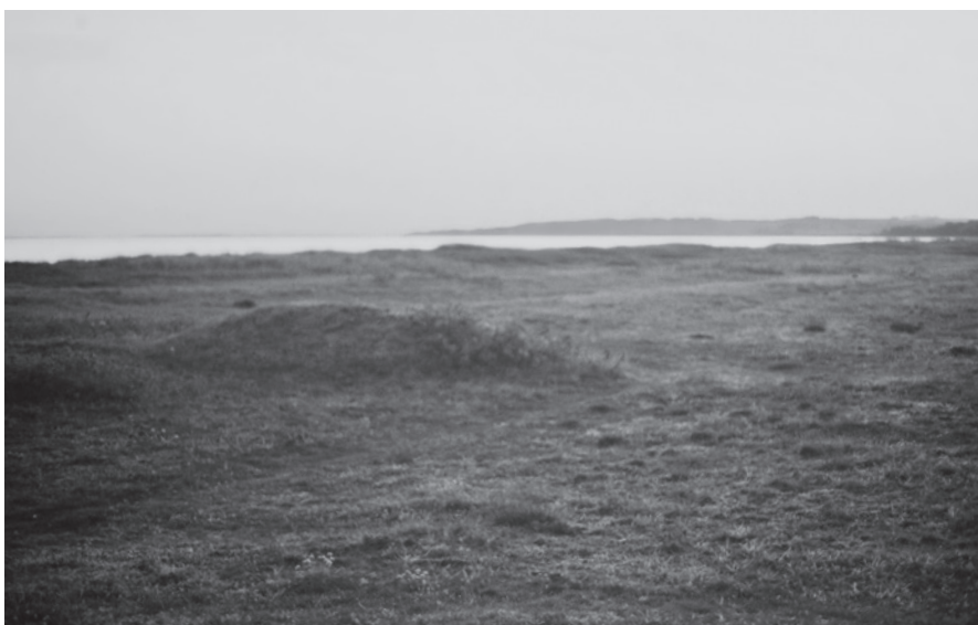
Fig. 9. Nordre Dødemands Grav, 1990.

The northern Dødemands Grav (Dead Man's Grave), 1990.