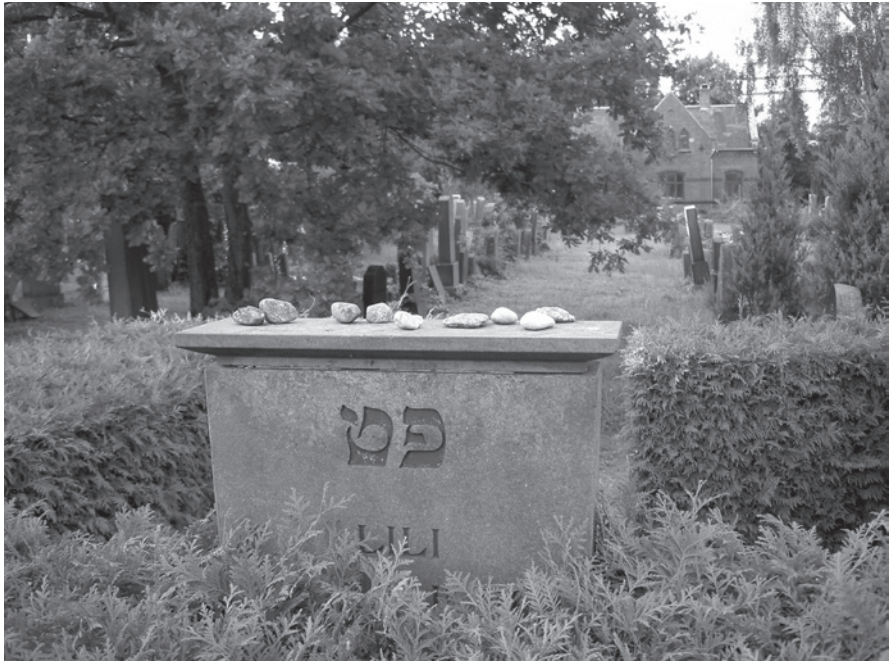
Fig. 16. Sten på jødisk grav, Vestre Kirkegård i København 2005.

Hvordan stenkastet fik et muslimsk indhold illustreres af Edward Westermarcks store undersøgelse af ritualer og folketro hos berbere og arabere i Marokko i begyndelsen af 1900-tallet. Den omfatter desværre kun stenkast med tilknytning til muslimske helgener, men selv med denne begrænsning giver undersøgelsen en ide om skikkens mange anvendelsesmuligheder. Hvis dyn-gen ligger i nærheden af en helgengrav, kan det være til markering af, hvor det