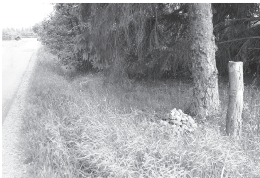
Fig. 2. Stenkastet på den tidligere Trøstrup Hede flyttet ca. 20 m mod syd, fotograferet i 2006.

The stone pile on the former Trøstrup Moor moved 20 m to the south, photographed in 2006.