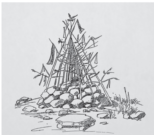
Fig. 14. Tibetansk »oboo«, hvori der i kegleform er stukket pinde med små tøjvimpler med buddhistiske bønner, tegnet i slutningen af 1920'erne. – Efter Kagarrow 1929, s. 60, fig. 2.

Tibetan "oboo" shaped as a cone and with sticks carrying streamers with Buddhist prayers, drawn in the late 1920s.