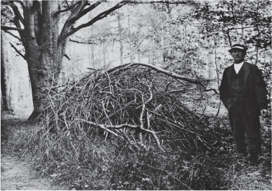
Fig. 6. Stikhoben i Hyde Skov på Lolland fotograferet omkring 1920.

Stikhoben in the wood Hyde Skov on Lolland, photographed around 1920.