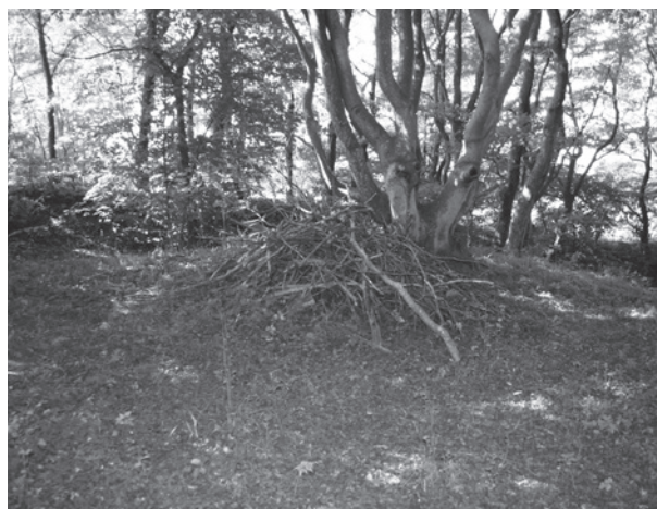
Fig. 5. Grenkastet Kræmmerens Grav i Slotved Skov i Vendsyssel fotografert i 2006 efter at være genskabt nær den oprindelige beliggenhed.

The cairn called “The Witch’s Grave” near Ashøj by Hurup in Thy is shown by Andreas Lodahl in 1986.