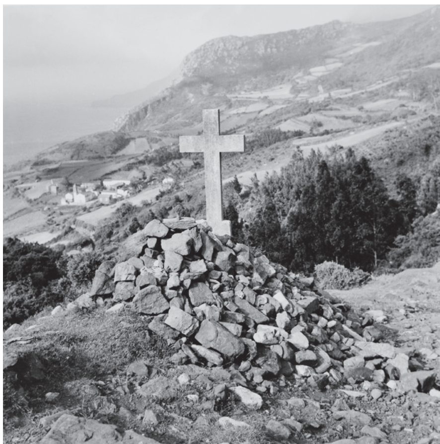
Fig. 15. Stendyng omkring kors ved nedstigningen til valfartsstedet San Andrés de Teixido fotograferet i 1969. Pilgrimmene samler på deres vej over bjerget en sten op, som de kaster fra sig, når de kommer frem til dyngen og kan se kirken nede i dalen.

A stone heap surrounding a cross at the place where one descends to get to the shrine of San Andres de Teixido, photographed in 1969. When crossing the mountain, the pilgrims pick up a stone, which they throw when they reach the pile and can see the church in the valley.