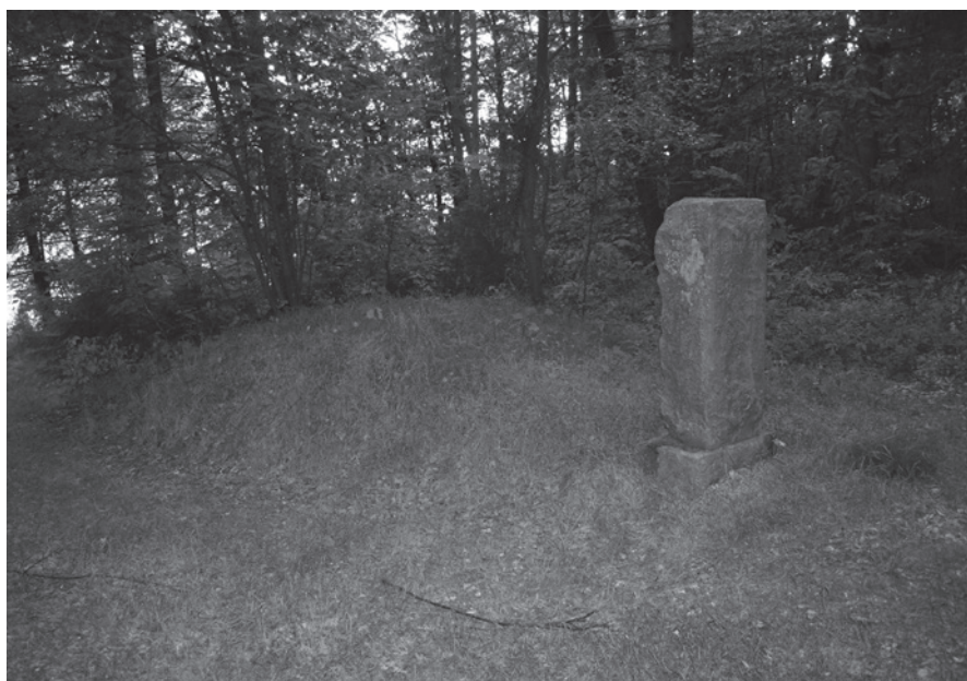
Fig. 7. Det tidligere grenkast Kjelds Grav i Vendsyssel med mindsten fotograferet i 2006.

The previous pile of branches called Kjelds Grav in Vendsyssel with a memorial stone, photographed in 2006.