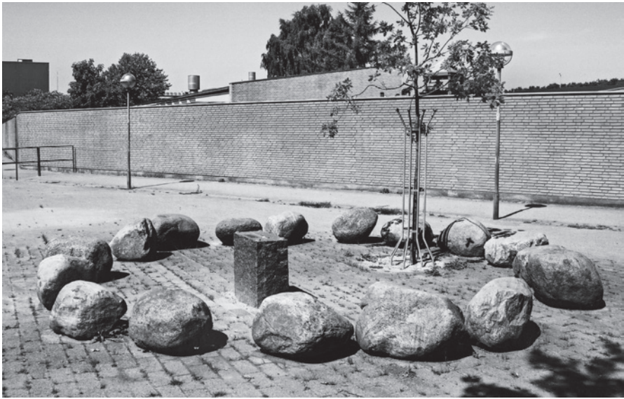
Fig. 8. Mindesmærke ved findestedet for Frydenhøjsværdet på Avedøre i Hvidovre.

Monuments at the find site for the Frydenhøj sword at Avedøre in Hvidovre.