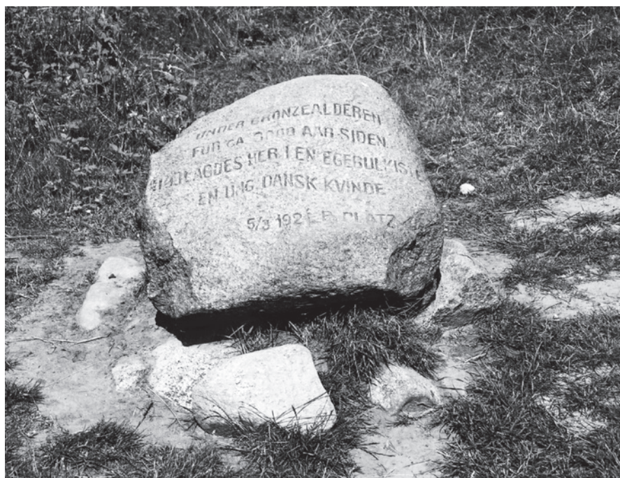
Fig. 9. Mindestenen over fundet af Egtvedpigen.

Monument at the find site for the Egtved girl.