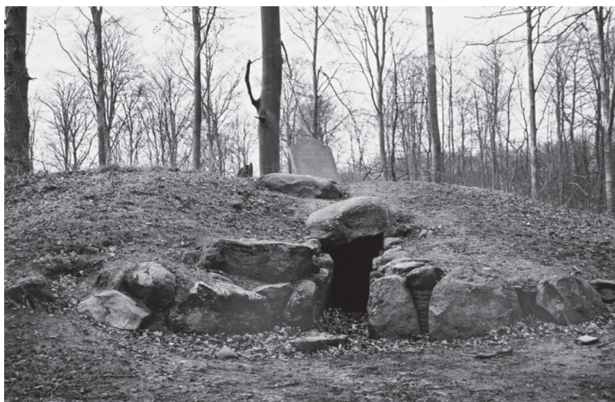
Fig. 2. Jættestuen ved Jægerspris med mindesten fra 1744, som måtte fornyes i 1943 og 1995.

The passage grave at Jægerspris with a monument from 1744 which was renewed in 1943 and 1995.