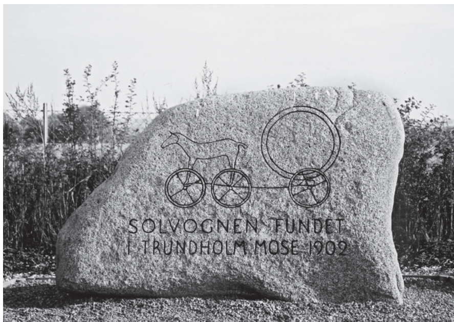
Fig. 1. Mindesten nær findestedet for Solvognen i Trundholm Mose.