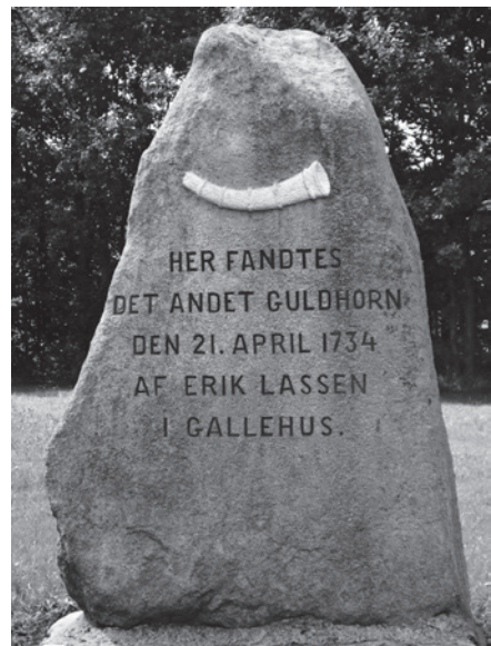
Fig. 7a-b. Mindesten i Gallehus for fundet af Guldhornene. – Foto: Mogens Bo Henriksen 2006.

Monument at Gallehus near the find sites for the golden horns.