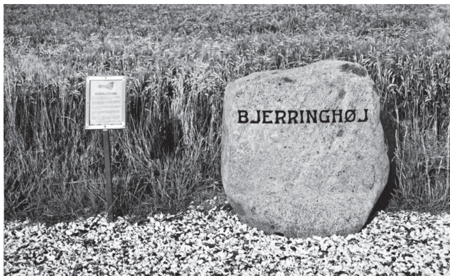
Fig. 5. Mindesten ved Bjerringhøj rejst i 1989.