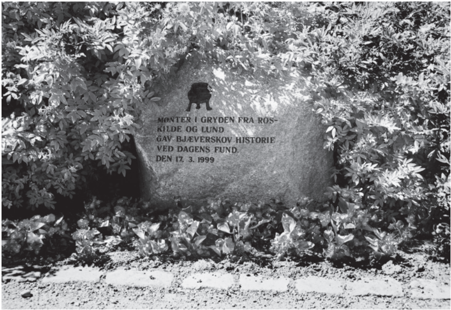
Fig. 10. Mindestenen over møntskatten i Bjæverskov.

Monument at the find site for the coin hoard at Bjæverskov.