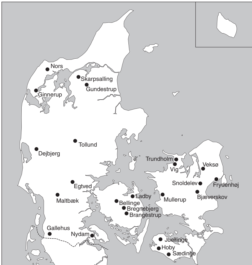
Fig. 6. Mindesmærker ved arkæologiske fundpladser i Danmark.

Monuments at archaeological find sites in Denmark.