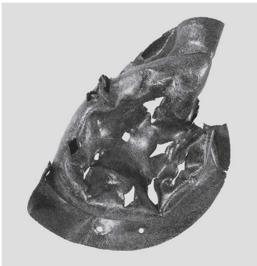
Fig. 1. Skjoldbule RCA, en del af fragmentsammensætningen KAMU. Et slagmærke lavet med øksenakke.

Shield boss RCA, part of fragment group KAMU. One deformation made with an axe butt.