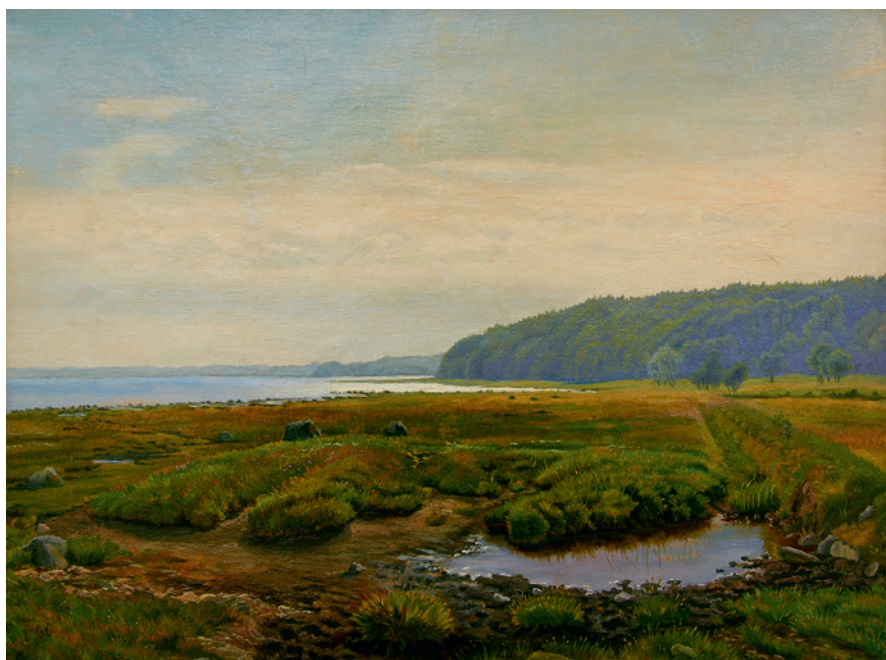
Fig. 4. Den sydlige del af diget ved Grevens Skanse set fra vejen ud til slotsruinen mod vest med Hestehaveskoven i baggrunden. Maleri af Theodor Philipsen fra 1866. – Randers Kunstmuseum.

der i forbindelse med digets anlæggelse er blevet etableret et engoverrislings-system med vandtilførsel fra en bæk, der udgår fra Hestehaveskoven, fig. 5. I forbindelse hermed kan der også være brugt jord fra borgbanken til terrænreguleringer på den inddigede strandeng.