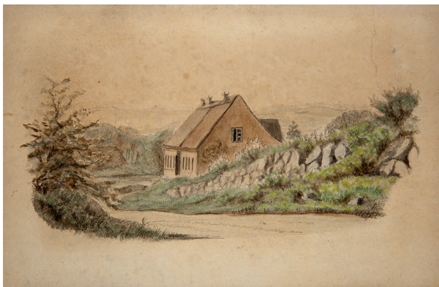
Fig. 10. Det tidligere husmandssted, der nu kaldes Jægerhuset, ved Følle Mølle, som anes til venstre. Akvarel udført af Michael Ancher i 1868. Mellem 1865 og 1870 var Michael Ancher ansat som ung skriver på Kalø gods kontor. Han mødte i 1866 Theodor Philipsen og Vilhelm Groth, da de malede på Kalø (se fig. 4 og 11), og dette møde var årsag til, at han besluttede sig for selv at blive kunstner.

stor betydning, at der foretages særlige arealfredninger, som sikrer den fremtidige bevaring af disse helheder.