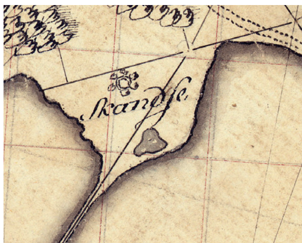
Fig. 2. Grevens Skanse afsat på Videnskabernes Selskabs konceptkort fra 1777.

Spørgsmålet er imidlertid, om der ikke simpelt hen er tale om et voldsted, der har fået sin oprindelige kuppelformede banke skamferet i nyere tid. På Videnskabernes Selskabs konceptkort fra 1777 er Grevens Skanse tegnet som et træbevokset rundt anlæg omgivet af en grav, og det benævnes "Skandsen", fig. 2. På en dårlig gengivelse af et udskiftningskort fra 1790 kan man desværre ikke se signaturen for Grevens Skanse i detaljer, men det fremgår, at anlægget er beliggende i et fugtigt område, "Marschen", som ikke er afskåret fra