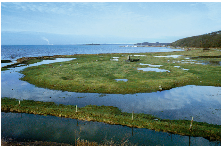
Fig. 6. Forhøjningen med bygningsspor ved Kolås udmundning i Egens Vig, set fra øst. I den nærmeste forgrund ses Kolå, og i det fjerne Kalø. Den oversvømmede del af strandengen omkring forhøjningen angiver åens tidligere slyngning. Stenrækken, der har afgrænset forhøjningen til kystsiden, ses i baggrunden, diget til landsiden ses til højre. Den formodede brønd ses som en regelmæssig, cirkulær forsænkning for enden af hustomten. Bag tjæregryden anes en svag forhøjning.

vil nok kun udgravninger kunne afsløre, og i sidstnævnte fald er spørgsmålet så, om det har tjent til belejrings- eller bevogtningsformål.