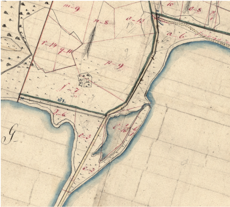
Fig. 3. Grevens Skanse, som den tager sig ud på det ældste matrikelkort, der er opmålt i 1816. Det formodede brud i den træbevoksede banke har umiskendelig lighed med en grus- eller en lergrav.

Slotsvig. 12 Det var det til gengæld blevet i 1816 eller i årene derefter, for på et såkaldt Original 1-kort fra 1816 er der syd og øst for Grevens Skanse opført et kraftigt dige med udvendig grøft. 13 På samme kort er "skansen" tegnet, som den i store træk ser ud i dag – som et træbevokset anlæg med åbning i midten og mod syd og sydvest, fig. 3. Når tomten af den formodede banke fremstår sådan efter 1816, kan det meget vel være fordi, man i årene forinden har rejst det nævnte dige og i den forbindelse bl.a. har hentet jord hertil i banken, som, fordi den formodentlig har været bevokset med gamle træer med kraftige rødder, nærmest er blevet udhulet fra syd og sydvest og ind mod midten. Diget har formodentlig haft til formål at hindre, at engen blev overskyllet af havvand, hvilket forringede græsudbyttet, fig. 4. 14 Herudover skal diget ses i sammenhæng med spor efter talrige parallelle, nord-syd gående grøfter på den inddigede eng, samt mindst én grøft på tværs af disse, hvilket tyder på, at