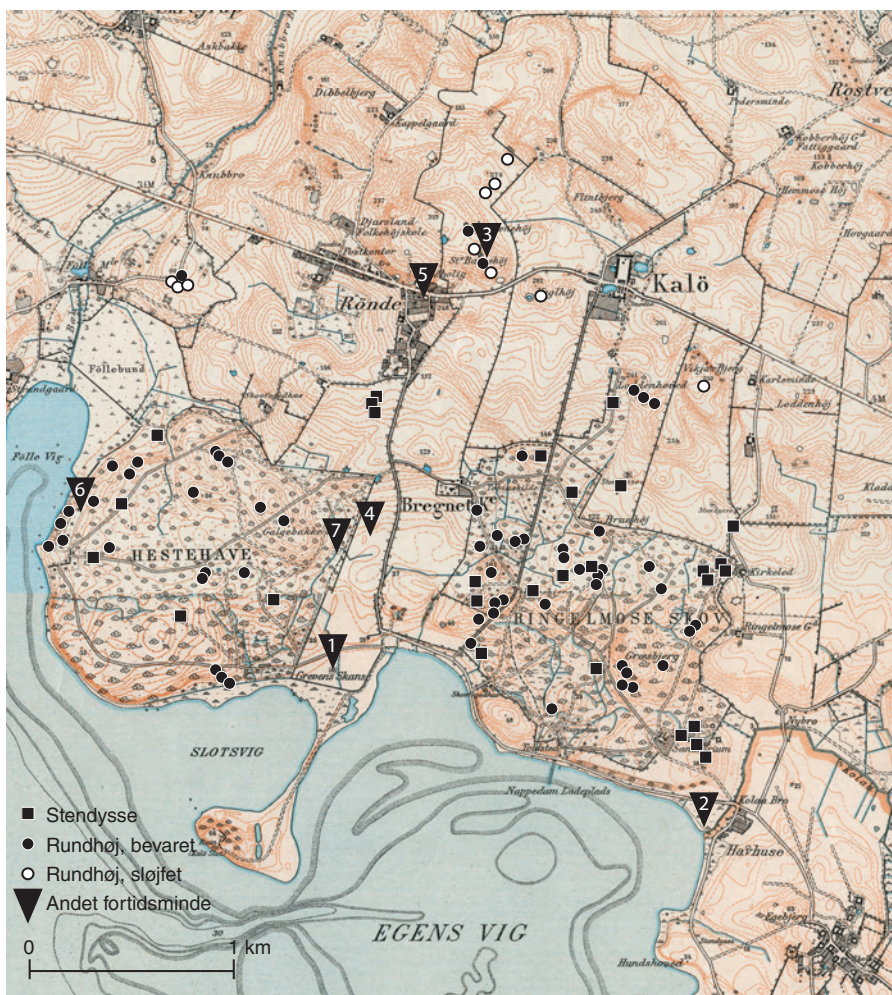
Fig. 1. Kalølandskabet år 1900 med stendysser og gravhøje samt fortidsminder, der antages at være samtidige med borgen. 1) Grevens Skanse, 2) Bygningsrester ved Kolå, 3) Store Bavnehøj, 4) Teglgården, 5) Teglovn ved Rønde Vandrerhjem, 6) Teglovn i Hestehaveskoven, 7) Øverste Mølledam. – Målebordsblad, Statsbiblioteket.

fravær. Store dele af dette åbne område har formodentlig været under plov først som en del af middelalderlandsbyen, der har ligget ved Bregnet Kirke, siden som agerland og råstofforsyningsområde i slottets tid, og derefter som hovedgårdsjord, der for alvor kom under intensiv landbrugsdrift i løbet af 1800-tallet. 10 Om oldtidsmindekonzentrationen oprindeligt har været lige så stor i den nordlige, intensivt dyrkede del af ejerlavet er lidt mere uvist. Her kan de ikke så velafgrænsede topografiske forhold meget vel have betinget en anderledes forhistorisk virkelighed.