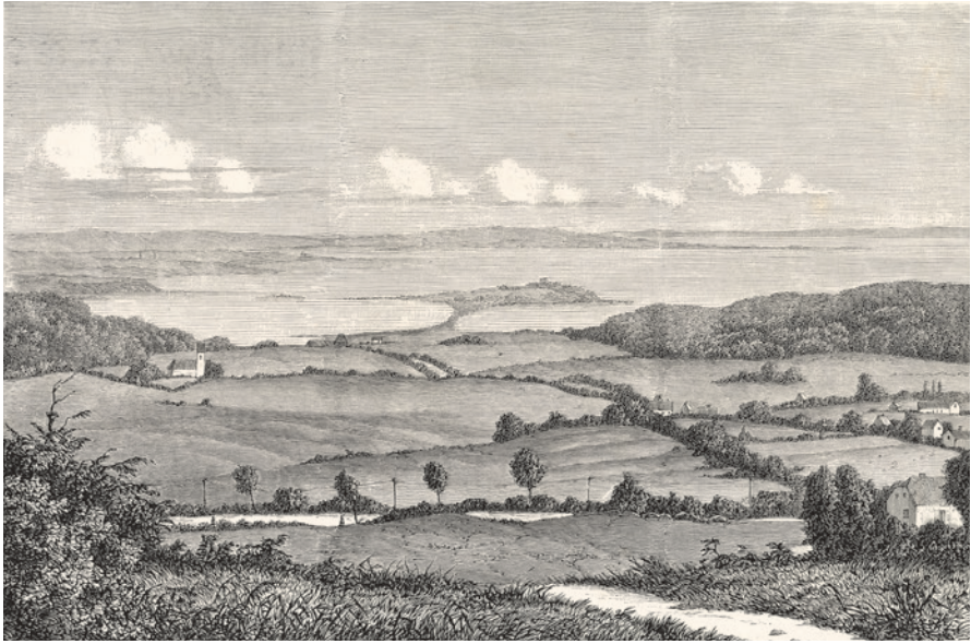
Fig. 11. Kaløområdet set fra Store Bavnehøj med de dyrkede arealer og skovområder til begge sider. Tegnet af Vilhelm Groth i 1868. – Illustreret Tidende 1867.

drage forskningsmæssige problemstillinger, og i den forbindelse skal man være opmærksom på, at først Vildtbiologisk Station, siden Danmarks Miljø Undersøgelser og nu Aarhus Universitet gennem deres mangeårige tilknytning til Kalø har foretaget indgående studier af områdets økologi og jordbundsforhold. 34