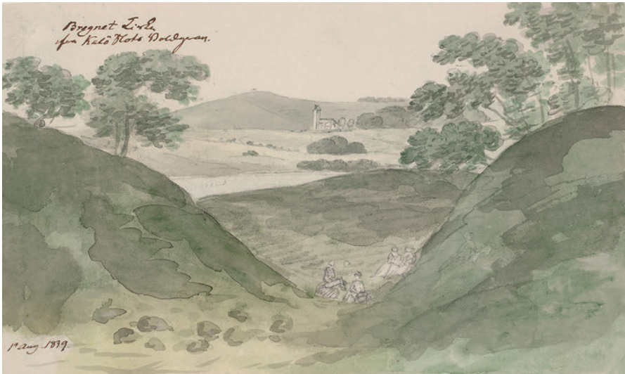
Fig. 8. Bregnet Kirke og højdedraget med Store Bavnehøj set fra slotsruinens voldgrav en augustdag i 1839. Akvarel af O.J. Rawert.

have krævet forskellige former for kommunikations- og varslingssystemer. Her har Store Bavnehøj tårnet sig op over Kaløegnen og været synlig fra snart sagt hvor som helst i lokalområdet, fig. 1, nr. 3 og fig. 8. Bavner og bavnevagter kendes fra de skriftlige kilder allerede i 1400-tallet. 19