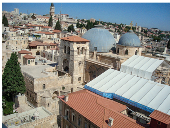
Fig. 9. Gravkirken i Jerusalem.

The Church of the Holy Sepulchre in Jerusalem.