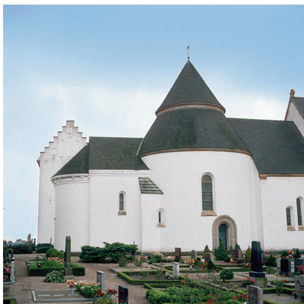
Fig. 10. Valleberga rundkirke i Skåne.