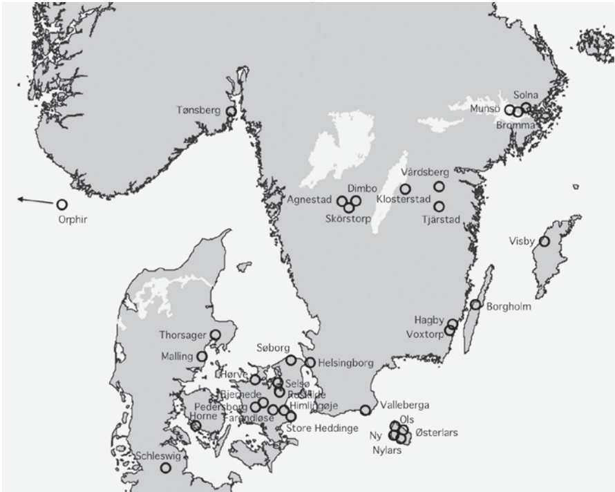
Fig. 2. Oversigt over Nordens middelalderlige rundkirker.

Overview of Scandinavia's medieval round churches.