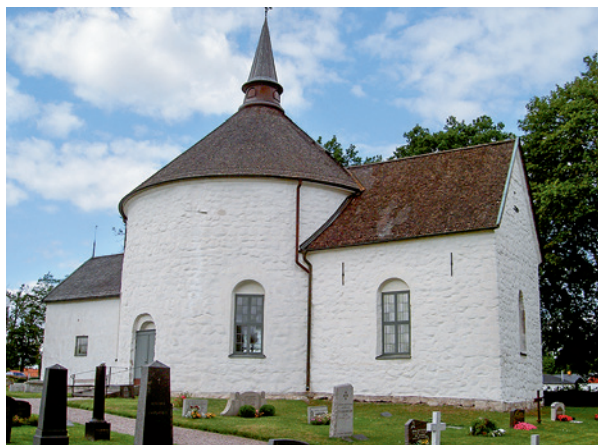
Fig. 6. Voxtorp rundkirke i Småland.

To mønter fra begyndelsen af Valdemar den Stores regeringstid 1157-82 og fundet i Østerlars Kirke er blevet set som en bekræftelse på kirkens datering til midten af 1100-årene. Men mønterne er vanskelige at anvende. Dels er det