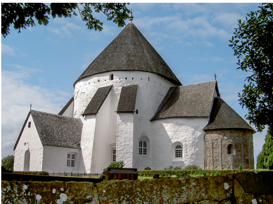
Fig. 1. Østerlars rundkirke på Bornholm.