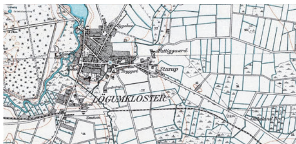
Fig. 10. Starup i Løgumkloster. Udsnit af målebordsblad fra før nedlæggelsen af jernbanen i 1936. – Geodatastyrelsen.

Det latinske navn for Løgumkloster Locus Dei , "Guds Sted", forklares almindeligvis med, at Locus er en lydlig analogi til Løgum, da begge navne begynder på L- 36 Ryd Klosters årbog oplyser om år 1173, at "Clastær kom til locum dei løum. Hærtig Christoffer døthæ", dvs. "Klostret flyttede til Locus Dei, Løgum.