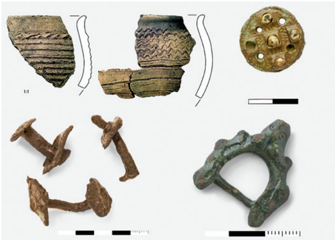
Fig. 9. Fund fra udgravningen af Starup Østertoft. Øverst til venstre: østersøkeramik; øverst til højre: ottonsk fibel; nederst til venstre: nagler; nederst til højre: bæltespænde med dyrehoved. – Efter Anders Hartvig in press.

Finds from the excavation at Starup Østertoft. Upper left: Baltic ware pottery; upper right: Ottonian fibula; lower left: rivets; lower right: belt buckle with animal's head.