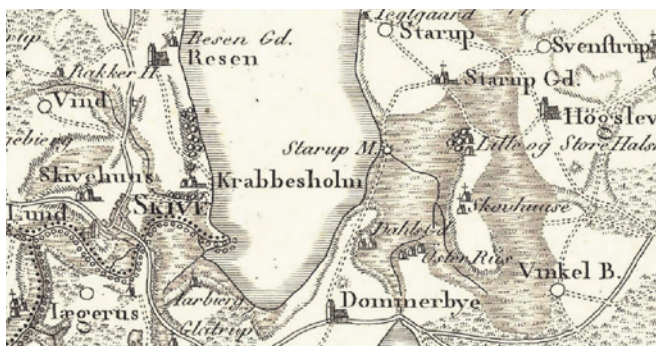
Fig. 2. Stårupgård nær Skive. Udsnit af Videnskabernes Selskabs Kort, Skivehuus, Bøvling og Lundenæs Amter 1800.

Der kendes ikke arkæologiske fund i området, som kan belyse eventuelle handelsmæssige aktiviteter på stedet, men beliggenheden over for udmundingen af Karup Å med Skive købstad kunne minde om andre konkurrerende ladepladser, f.eks. Sønderø på sydsiden af halvøen Veddelev over for ladepladsen i bunden af Roskilde Fjord få kilometer længere mod syd. 10 En lignende placering på hver side af en fjord finder man ved Hedeby og Slesvig i bunden