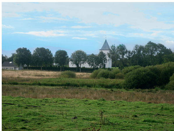
Fig. 5. Vester Starup Kirke fotograferet fra vandrestien.

Neden for kirken ligger en helligkilde (fig. 6), som ifølge præsteindberetningen til Ole Worm var indviet til Sankt Syllatz, formentlig en forvanskning af Sankt Sylvester. 24 Ifølge en udgravningsrapport udarbejdet af museumsinspektør Lene B. Frandsen, ArkVest, Varde Museum, gav en undersøgelse i 2002 ikke arkæologiske spor, som tillod en datering af stensætningen omkring kilden. I fyldlagene lå der et par slaggeblokke fra jernalderen, som blev tolket som tilført byggemateriale til kirken eller kirkegårdsdiget. 25 I forbindelse med udgravningen af kirkegulvet i 1957 blev der registreret stolpehuller, som