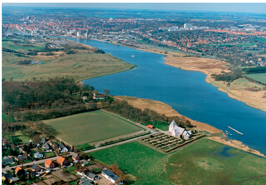
Fig. 7. Luftfoto af Sønder Starup Kirke med Haderslev i baggrunden. Har man gode øjne, kan man se runestenen foran kirken.

Aerial photo of Sønder Starup Kirke with Haderslev in the background. A rune stone can just be discerned in front of the church.