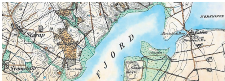
Fig. 3. Starup i Malling sogn – Geodatastyrelsen.

Det nuværende Starup ligger som nævnt et stykke fra kysten, men midtvejs mellem Norslund og Starup er marknavnet Gammeltoft afsat på udskiftningskortet fra 1812, som er en indikation af en fortidig bebyggelse. Gammeltoft, der indikerer en ældre beliggenhed af en af områdets bebyggelser, hvilket formelt set godt kunne være Starup, ligger på kanten af en dalsænkning vest for halvøen Norslund. På det sted kunne man forvente den nærmeste ladeplads i forhold til sognebyen Malling ca. 4 km mod nord. Sognets betydning i ældre tid understreges af, at kirkegården i Malling i romansk tid blev befæstet med en forsvarsmur, der stedvis er bevaret i op til 3 meters højde, samt tilhørende grav. I forsvarsmurens sydøsthjørne tilføjedes et rundt hjørnetårn på knap 8 meter i indvendig diameter. Tårngulvet var benyttet til begravelser, måske i forbindelse med et privatkapel i nederste etage af tårnet. 14