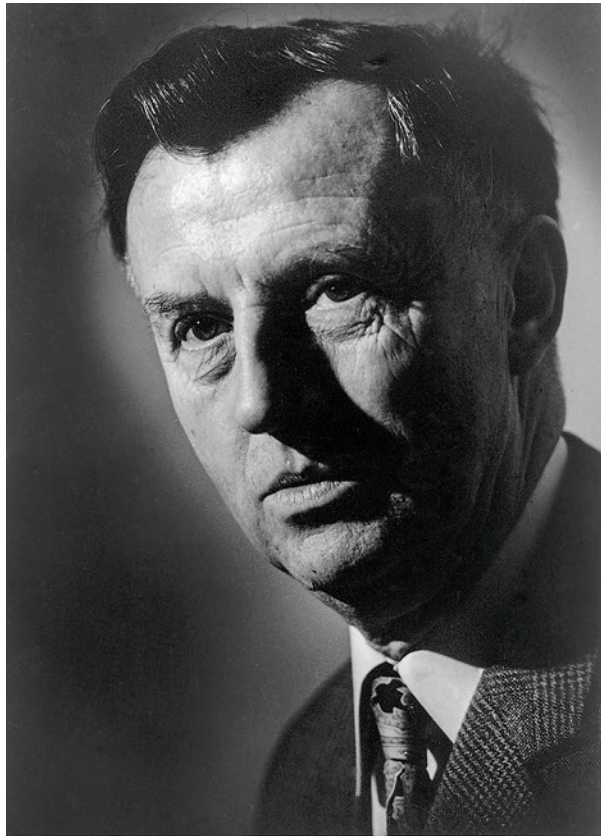
Fig. 2. Professor Karl Kersten.

et eksempel herpå er de interessante huse fra Trappendal 8 og Handewitt, 9 der senere blev dækket af høje. Gruber, kulturlag og ardspor fra ældre bronzealder og neolitikum fremkommet i forbindelse med udgravning af høje er ligeledes omtalt i tekstdelen. Derimod er alle de bopladser, der er udgravet igennem de seneste årtier, udeladt, da de ville sprænge rammerne for projektet. 10