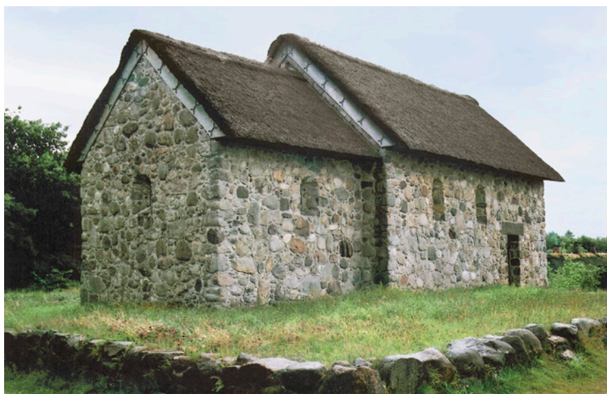
Fig. 6. Hjerl Hedes kullede kirke i Jylland opført 1949-50. – Foto: J. Wienberg, juli 2005. The open-air museum Hjerl Hede's towerless church built in 1949-50.

beliggenhed som den lille Pederstrup Kirke, der knejser ensomt i et vældigt bakkelandskab over Rødsø. Set som helhed virker den kullede, beskedne kirke faktisk bedre som eksempel på en i det ydre næsten uændret romansk landkirke end den så ofte fremdragne Hover i Nordvestjylland. 49