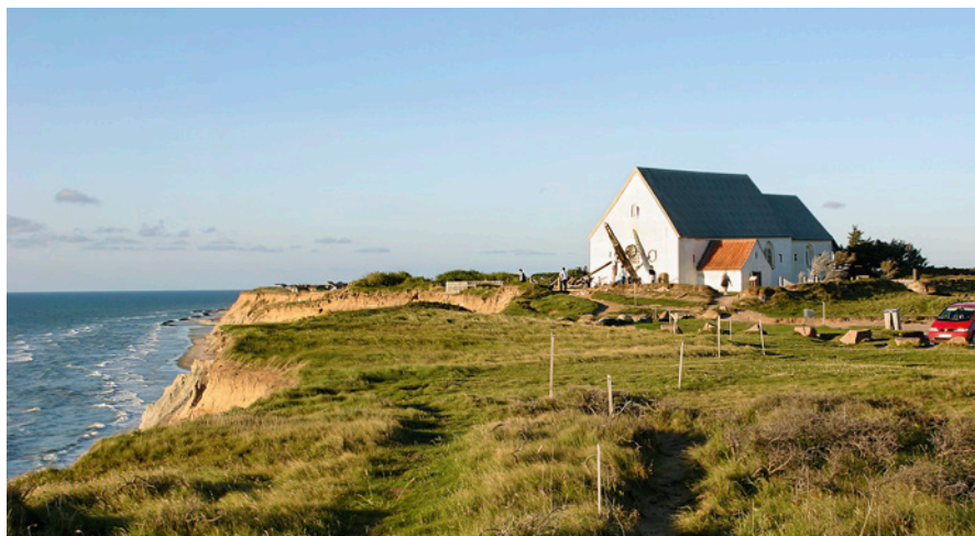
Fig. 5. Mårup Kirke i Nordjylland, som fik sengotiske tilføjelser, en tresidig afsluttet øst-udvidelse og et vesttårn, men som blev reduceret omkring 1700. Ødekirken blev undersøgt, nedtaget og fjernet i perioden 2008–15 i anledning af truslen fra havet.

I Østdanmark, som var domineret af aristokratiske godser, fik en del kirker tidligt tårn. I Vestdanmark, hvor der var færre godser, forblev tårne sjældne. Først når kirker var blevet et kollektivt ansvar, begyndte bønderne at prioritere tårnbyggeriet. 19 De fleste kirker har siden gennemgået talrige forandringer, hvor tilføjelsen af et sengotisk tårn er et typisk fænomen. En baggrund for det omfattende byggeri i 1400-tallet og frem til reformationen kan være en økonomisk højkonjunktur, hvor forfaldne kirker nu atter blev restaureret og taget