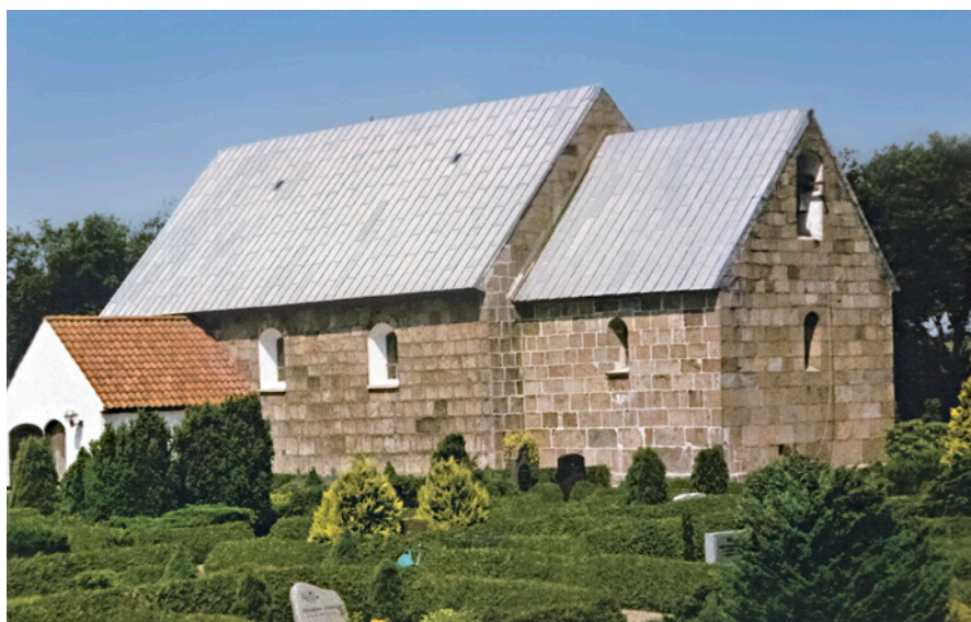
Fig. 2. Sædding Kirke i Vestjylland. – Foto: J. Wienberg, juli 1994.