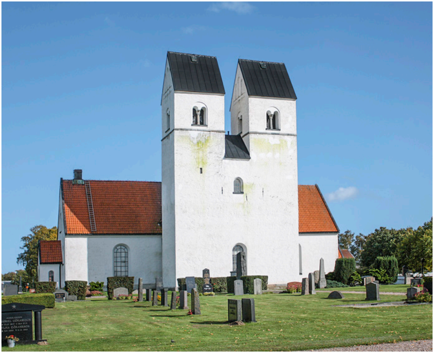
Fig. 3. Färlöv kirke i Skåne med tvillingetårne, hvor en stenbygning fra en storgård er blevet udgravet på marken vest om kirken. – Foto: A. Ohlsson, Ystad, september 2011.

Färlöv church in Scania with twin towers. Remains of a stone building from a manor have been excavated in the field to the west of the church.