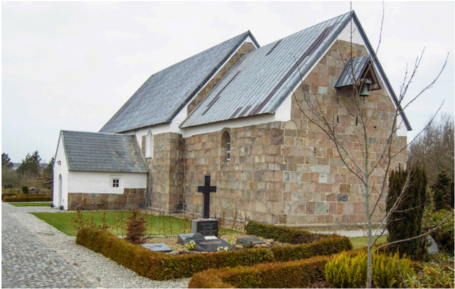
Fig. 1. Hover Kirke i Vestjylland. – Foto: I.D. Kaasgaard, Torsted, marts 2008, Wikimedia Commons.