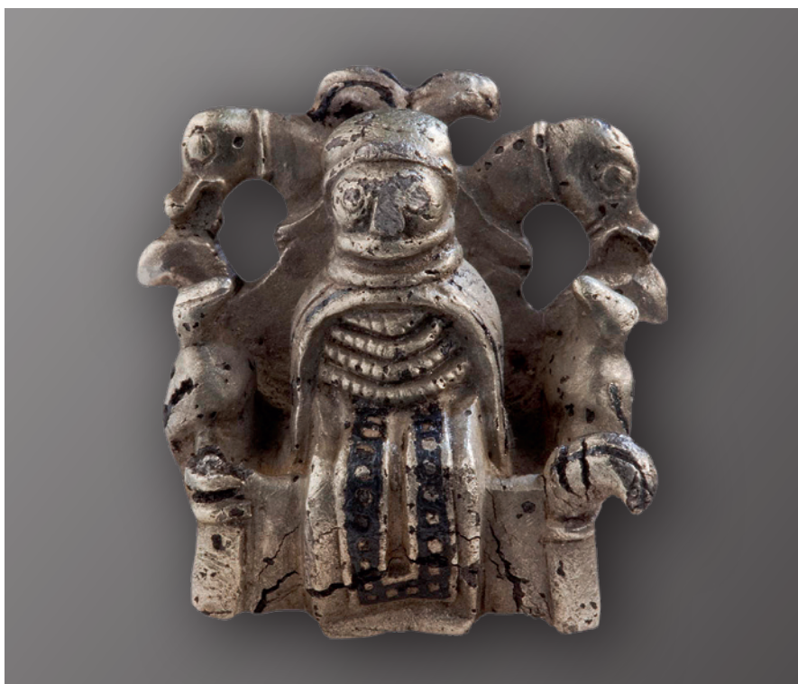
Fig. 1. Den lille sølvfigur fra Lejre. – Efter T. Christensen 2015, fig. 11.41.