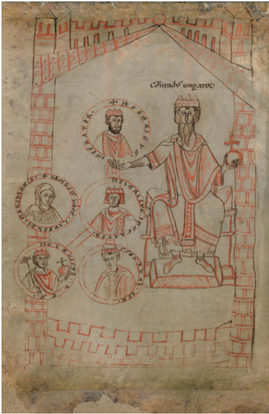
Fig. 9a-c. Afbildning af kejsere med bånd ned foran dragten. Bemærk særligt ligheden mellem det klædestykke, der hænger foran benene på Konrad II og 'Odin fra Lejre'.

a. Kejser Konrad II. – Wikimedia Commons, Public Domain.