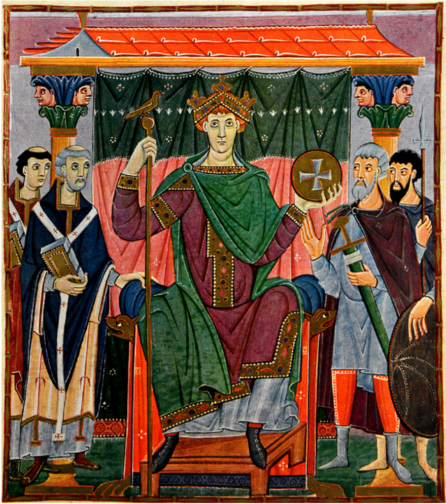
Fig. 7a-c. Kejsere og konger på troner, med dragter gående til eller over fødderne (se også fig. 9a-b for flere eksempler). a. Kejser Otto III – Bayerische Staatsbibliothek, CC BY-NC-SA 4.0.

Emperors and kings on thrones wearing garments extending down to or over the feet (see fig. 9a-b for further examples). a. Emperor Otto III.