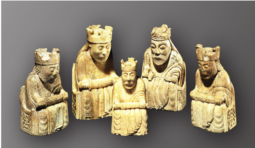
c. Kongebrikker fra Lewis se også Robinson 2004, fig. 4. c. Kings from the Lewis Chessmen.