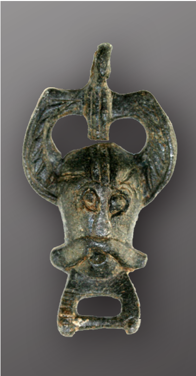
Fig. 2. 'Odin fra Ribe'.