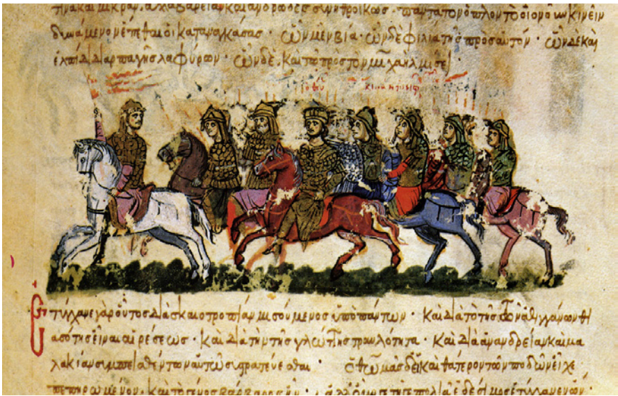
Fig. 8. Afbildning af byzantinsk rytteri. Se også McGeer 1995, fig. 5.