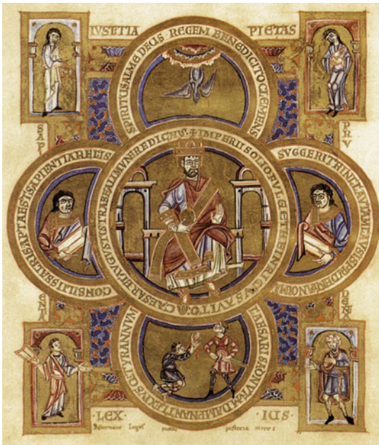
b. Kejser Henrik II.; se også: Mayr-Harting 1999, part 1, fig.77.