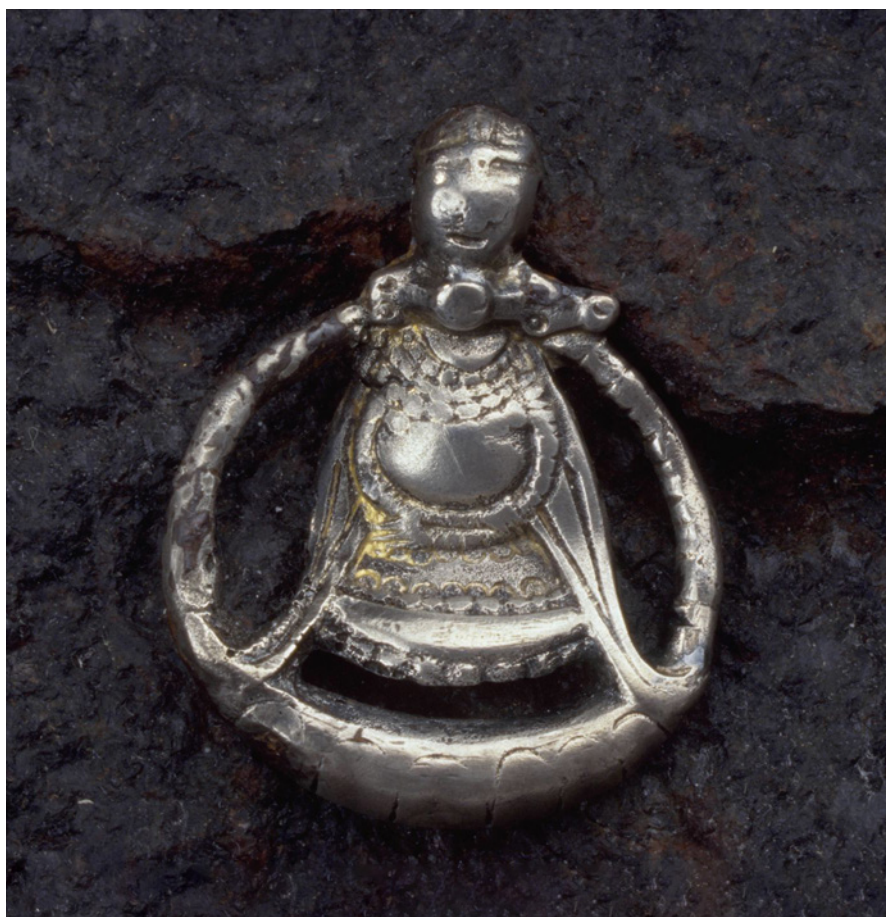
Fig. 4. Figuren fra Aska. Armene går rundt under personens mave, og hver hånd holder om den modstående arm. Bemærk, at ornamenteringen fortsætter ud på armene.

The figurine from Aska. The arms are holding the individual's belly and each hand is clasping the opposite arm. Note that the ornamentation continues out along the arms.