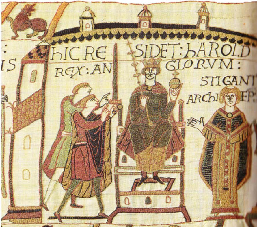
b. Udsnit af Bayeux-tapetet med Kong Harald – Wikimedia Commons, CC BY-SA 2.0. b. Section of the Bayeux Tapestry showing King Harold.