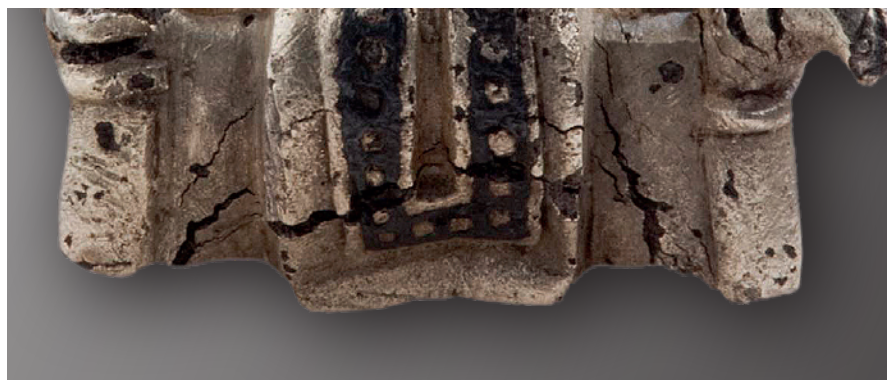
Fig. 6. Detalje af Lejrefigurins nederste del. – Efter udsnit af figur i T. Christensen 2015, fig. 11.41, foto af O. Malling, Roskilde Museum.

Parallels to the lower garments of 'Odin from Lejre': a. & b. The wooden man from Rude Eskilstrup, c. The Nybølle figurine.