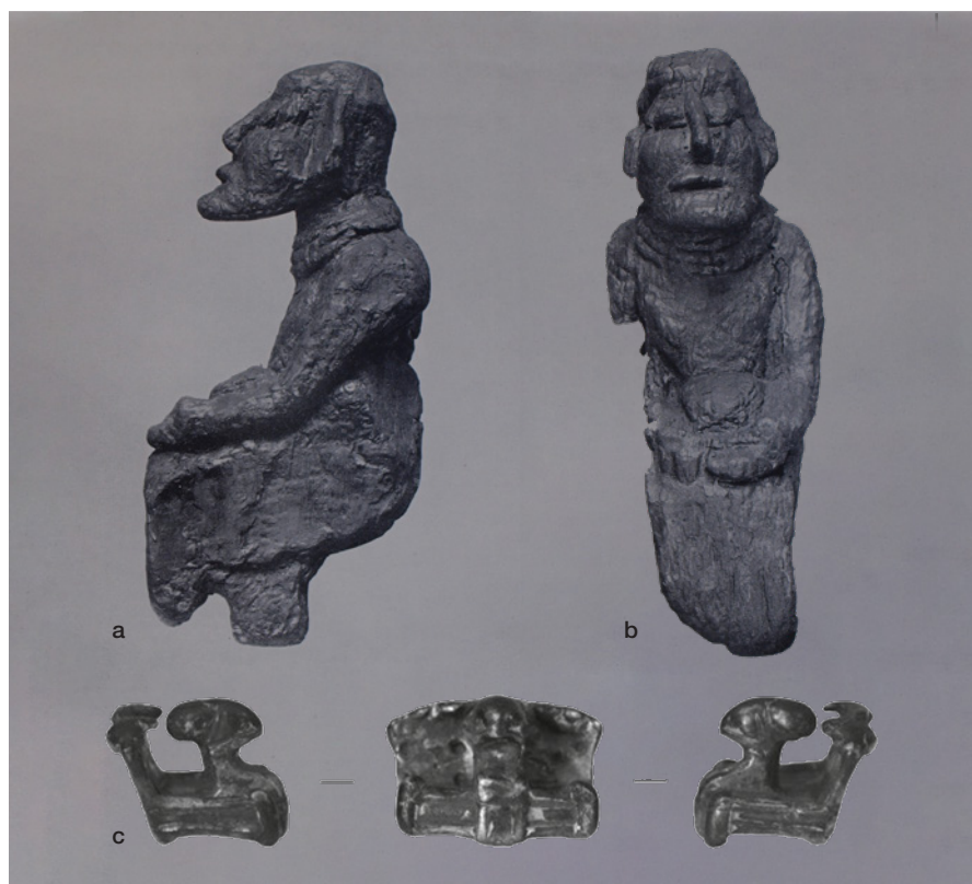
Fig. 5a-c. Paralleller til 'Odin fra Lejres' benklæder. a Træmanden fra Rude Eskilstrup. – Efter Mackeprang 1935:Pl. IV. b. – Træmanden fra Rude Eskilstrup. – Efter Mackeprang 1935:Pl. V. c. Nybøllefiguren. – Museum Lolland-Falster.

Parallels to the lower garments of 'Odin from Lejre': a. & b. The wooden man from Rude Eskilstrup, c. The Nybølle figurine.