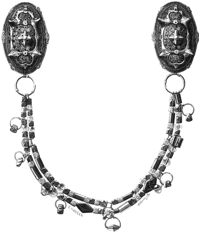
Fig. 3. Smykkeophæng fra Tuna, grav VI (Arne 1934, Taf. XI).

The suspended ornaments from Tuna grave VI.