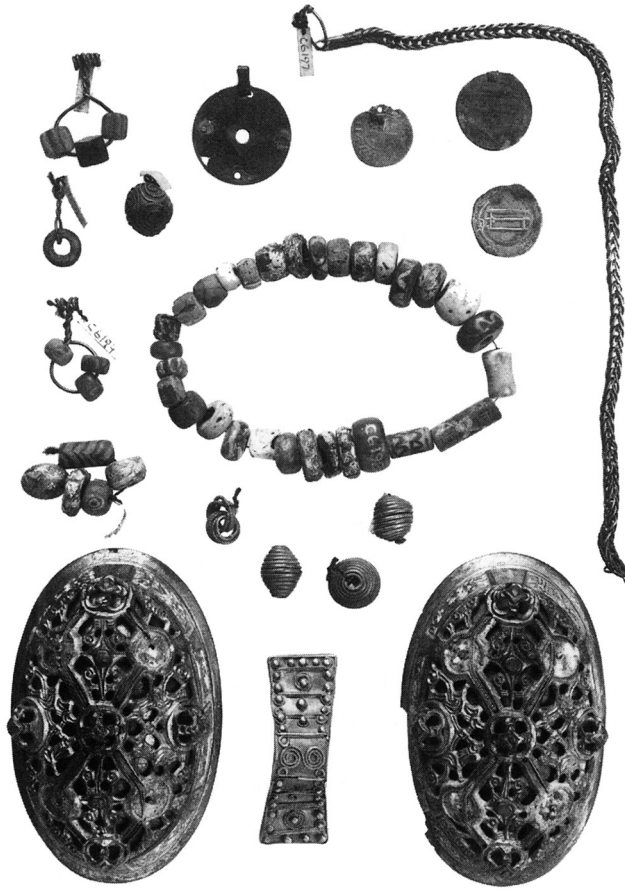
Fig. 1. Lerchenborgfundet (Skovmand 1942, 109). The Lerchenborg find.

Et af sølvsmykkerne i Lerchenborgfundet er et rundt vedhæng med øsken. Diameteren er 3,2 cm, og det har fem symmetrisk anbragte huller, hvoraf et i midten, resten ved kanterne. Pladens forside er ornamenteret med dobbeltspiraler, der er forbundet med tværbånd, kranse m.m. De fordybte linjer er indlagt med niello. Overfladen bærer spor af let forgyldning. Det runde sølvvedhæng er i motiv og stil beslægtet med de runde hængesmykker i Terslevfundet (Friis Johansen 1912, 226ff; Skovmand 1942, 110), men Terslevsmykkerne er alle prydet med filigranornamentik. Terslevspændernes udbredelse strækker sig især i det sydøstlige Skandinavien med enkelte fund i Nordtyskland og i det baltiske område (Capelle 1968, 80 og kort 30).