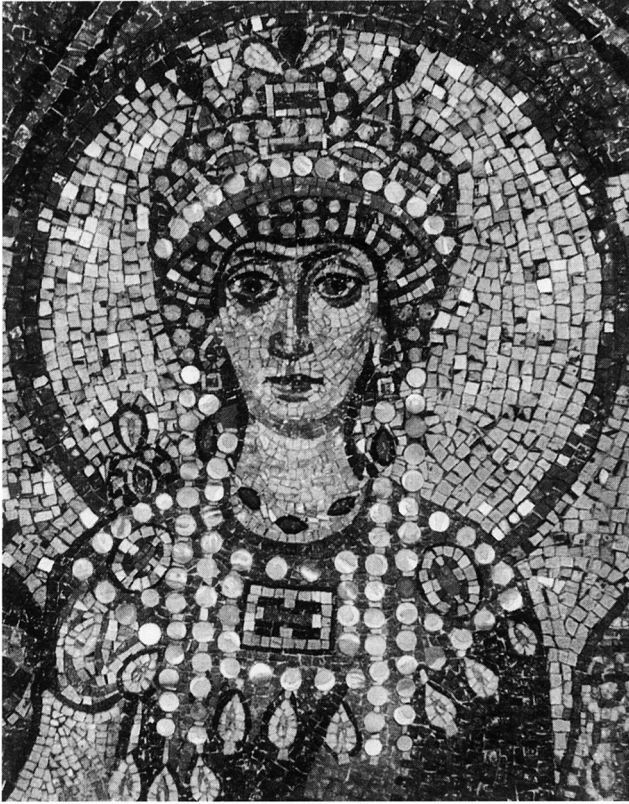
Fig. 4. Kejserinde Theodora med halskæder med vedhæng. (Deichmann 1958, 360).

The Empress Theodora with collar of chains and pendants.