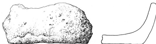
Fig. 2. Fragment af lerkar, fundet i stenspor nær brudsølv. Fragment of a pot, found in an extraction hole near the scrap silver.

Og ganske rigtigt dukkede der i et stenspor i det vestlige gravkammer en lille, hvidgrå, flad genstand op, som ved nærmere eftersyn viste sig at være en mønt fra vikingetid. Og der kom mere. I udkanten af samme stenspor lå 9 brudstykker af mønter og ringe, alt i sølv, og tæt herved, et større fragment af et lerkar, formodentlig fra en beholder skatten har været nedsat i (fig. 2). Sølvstykkerne lå i toppen af stensporet indenfor et 10 x 25 cm stort område. Der er utvivlsomt tale om en af vikingetidens brudsølvskatte. Skatten har efter alt at dømme været gravet ned tæt ved den ene af kammerets bæresten. Ved sprængningen af kammerstenene er skatten røget med og sølvstykkerne er væltet ned i hullet efter den sprængte sten. Spørgsmålet var nu, om de 9 sølvstykker udgjorde hele skatten. Var der mere, måtte det ligge i dyngerne af pløjejord, som gravemaskinen havde gravet af området over dyssekammeret. Og ganske rigtigt. Efter en grundig gennemsøgning med metaldetektor, talte skatten 81 stykker sølv, nemlig 66 mønter og møntfragmenter og 15 brudstykker af især ringe og