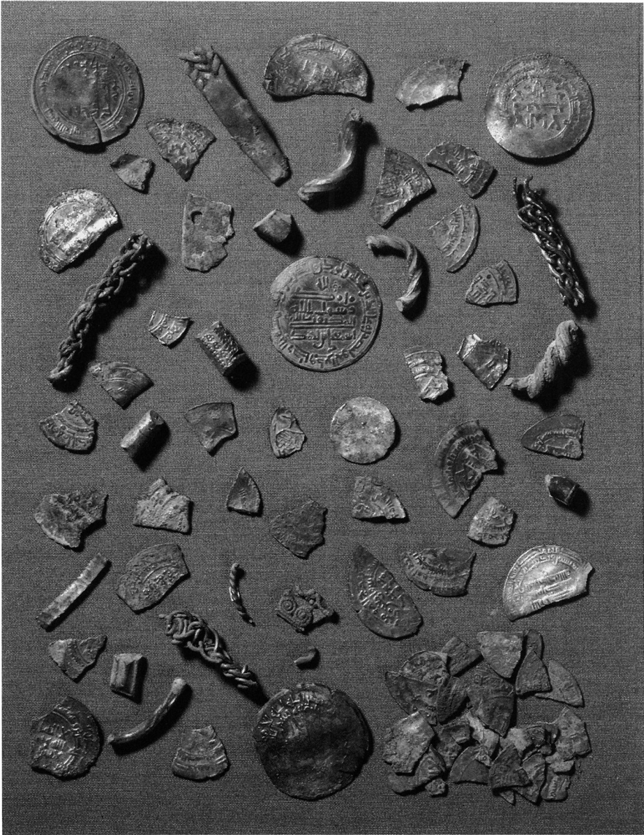
Fig. 3. Det samlede sølvfund.

The complete silver find.