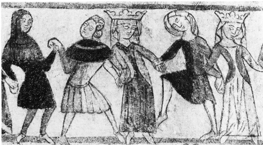
Fig. 8: På dansefrisen fra Ørslev kirke i Sydvestsjælland ses kronede jomfruer med dragter, enten spencerkjoler med »helvedsvinduer« eller kjoler med stramme liv – til at lukke med hægter?