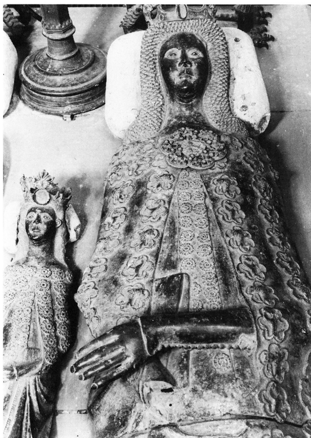
Fig. 6: Dronning Eufemia og prinsesse, gravfigurer på Christoffer II og Eufemias sarkofag i Sorø kirke. Dragterne vises efter moden i anden halvdel af 1300-årene besat med påsyningssmykker; langs forbræmmerne muligvis hægter og maller.

Hvis det er tidens spencerkjoler med de meget store »helvedsvinduer« og de vide udskæringer, de gengiver, er der ikke brug for hægter på dem, men er det snarere stramme kjoleliv, der sidder oven på underkjoler, kunne disse nok behøve hægter og maller netop som Rådved-fundets, der kan lukke