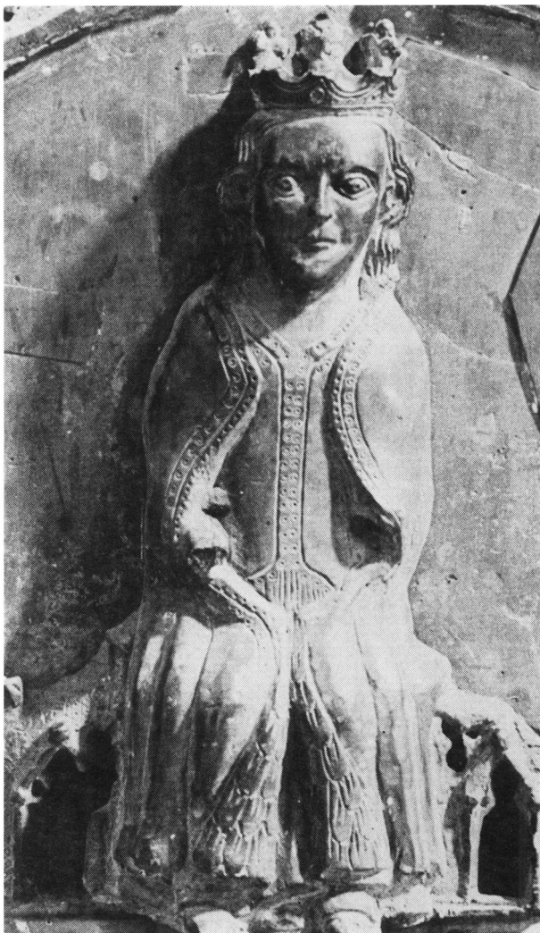
Fig. 7: Hellig jomfru på en af langsiderne af Christoffer II og Eufemias sarkofag i Sorø kirke. Dragten vises bræmmet med påsyningssmykker og muligvis lukket med hæfter og maller af lignende art som Rådvedskattens.

Holy Virgin on one of the long sides of the sarcophagus of Christoffer II and Eufemia in Sorø Church. The dress is shown trimmed with sewn-on ornaments and possibly closed with hooks and eyes of the same kind as those of the Rådved treasure.