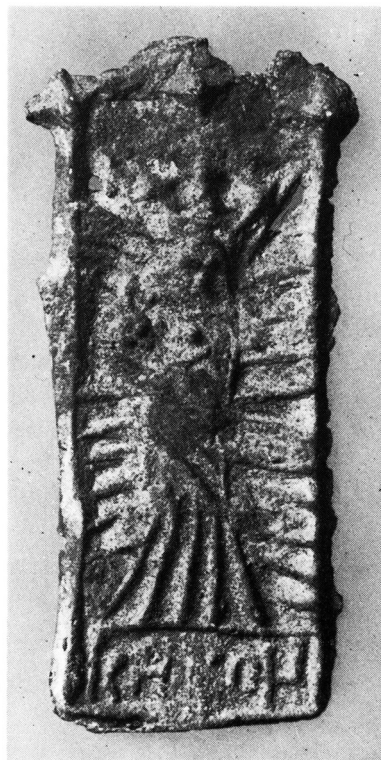
Fig. 2: Pilgrimsmærke fra Karup (Nationalmuseets 2. afd. D 4925, h. 46 mm) fundet i Karup 1901. 2:1.

Pilgrim badge from Karup (RIM 3980, height 39 mm) discovered in floor deposits of Brejning church during restoration in 1960–61.