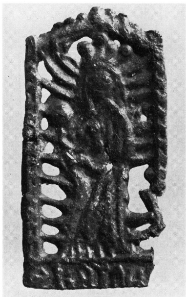
Fig. 1: Pilgrimsmærke fra Karup (RIM 3980, h. 39 mm) fundet i Brejning kirkes gulvlag ved restaurering 1960–61. 2:1.

Pilgrim badge from Karup (RIM 3980, height 39 mm) discovered in floor deposits of Brejning church during restoration in 1960–61.