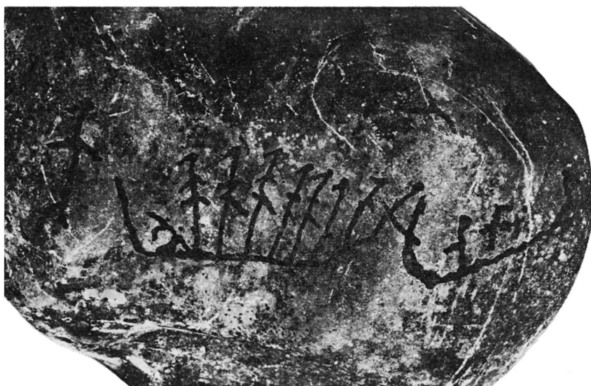
Fig. 3. Gåshopen, Sørøysund s., Hammerfest pgd., Finnmark. Ny opmaling fra 1970. New painted version.

3-4 fallos og mindst 6 er sværdbevæbnede. Næsten alle har udprægede »fugleansigter«. Sværdbevæbning og »fugleansigt« er træk, som mig bekendt ikke forekommer hverken i den nordskandinaviske eller den karelske gruppe, men som er velkendt fra sydsandinavisk område (26). Som et sidste træk fra Gåshopen skal nævnes »hunden« foran i det store skib. Den helt slående parallel er her Dyrehavestenen fra Danmark (27), men også Engelstrupstenen (28) har berøring med motivet.