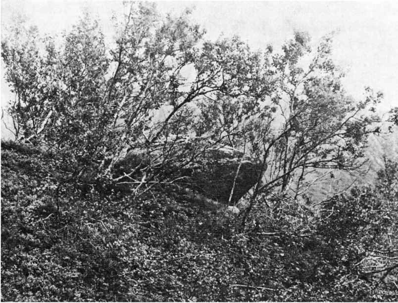
Fig. 1a. Sandbukt, Sørøysund s., Hammerfest pgd., Finmark Billedet viser skålstens dominerende beliggenhed i terrænet. The picture shows how the cup-marked stone dominates the landscape.