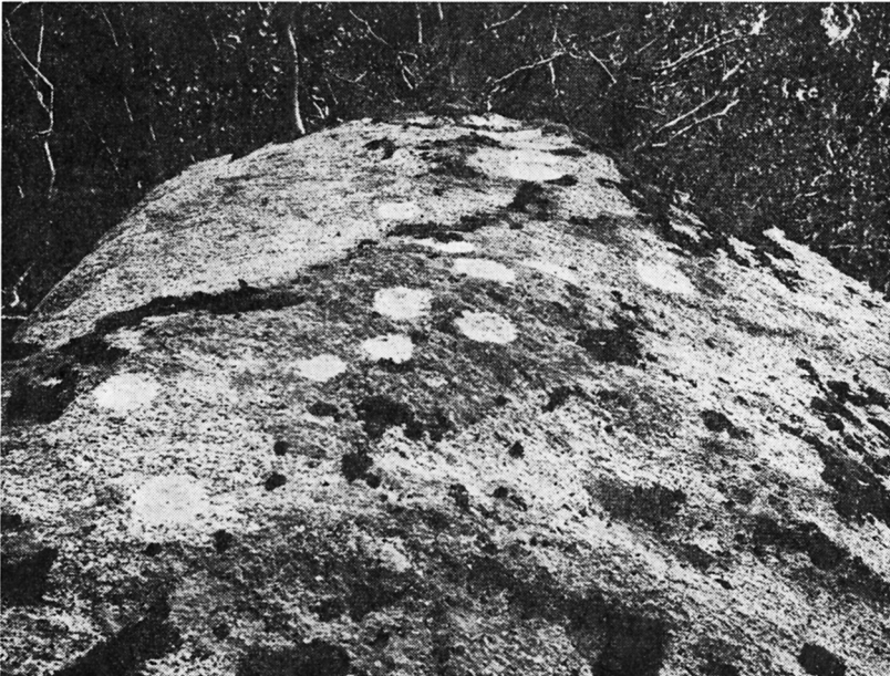
Fig. 1b. Sandbukt. Skålstens overflade, opkridtet. The surface of the cup-marked stone, chalked up.