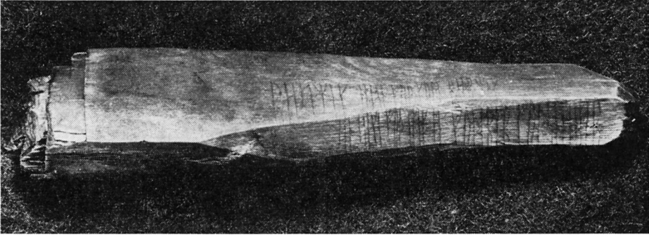
Fig. 1. Pinnen er hogd eller spikket av i tykkenden og kan minne om den overflødige enden av en nagle, som har stukket ut av naglehullet, og som så er kappet av. Man har begynt å skrive på den javnbreie smalsida og har fortsatt på sida »over«.

The stick resembles the superfluous lopped off, narrow end of a pin. The inscription starts on the narrow face and continues on the wider, adjoining face »on top«.