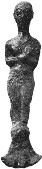
Fig. 1. Mirror Handle. Barbar, Bahrain.