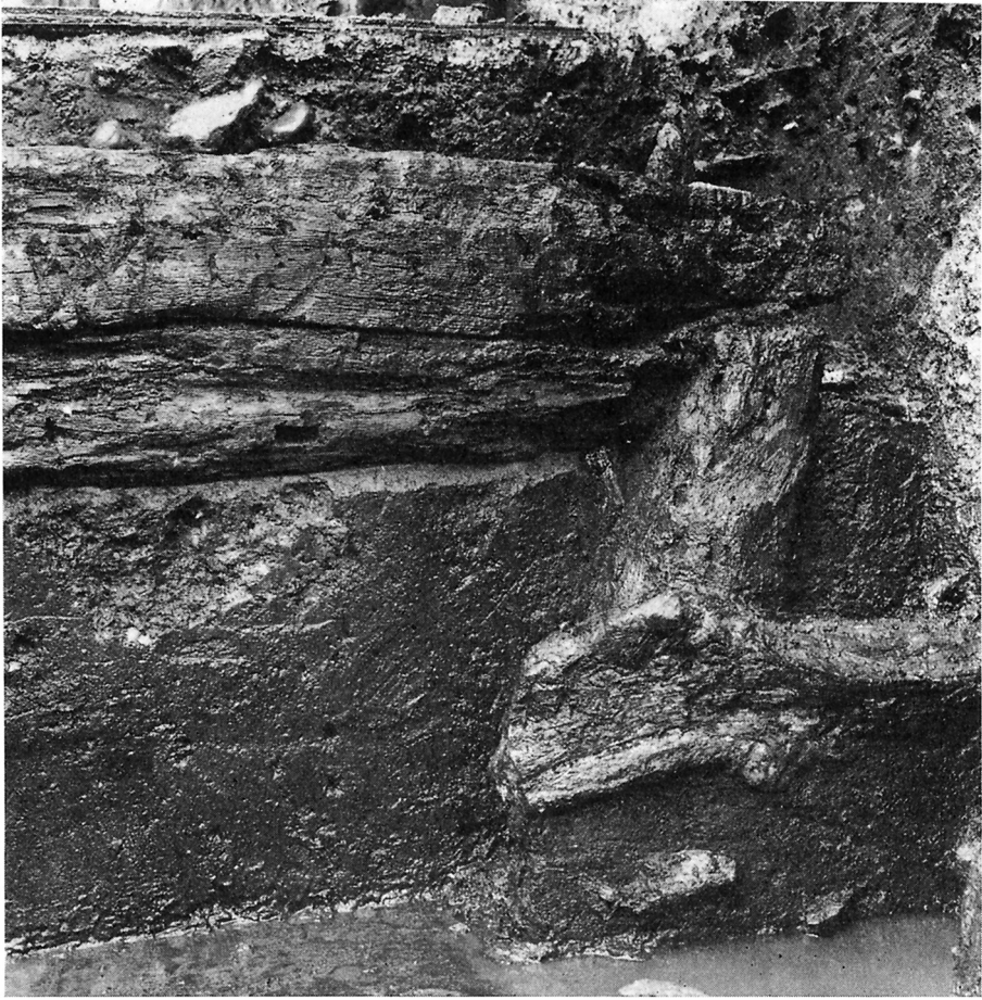
Fig. 5. Nedre del af bevaret hustømmer, bulplanker. Dette fodtømmer hviler i udsparinger i lodrette, dybt nedgravede stolper, hvoraf en ses til højre i billedet. Middelalder.

The lower portion of surviving house timber, consisting of massive vertical planks. This footing timber rests in depressions cut in deeply sunk vertical posts, one of which is seen to the right of the picture. Medieval.