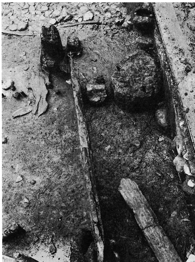
Fig. 6. Samme fænomen som fig. 6, set fra oven. The same structure as Fig. 6, viewed from above.

karakter af et lavt næs, lavt i forhold til nutidige forhold, men dog højt og tørt i forhold til det bagland, som det dengang lukkede af for. Med lave brinker faldt næsset ned mod å og strand, og lidt inde gik dets landside over store strækninger over i et meget lavt og fugtigt terræn, således at det altså allerede af naturlige årsager var det givne sted for den nye by, passende utilgængeligt i forsvarsmæssig henseende. En befæstning kunne støtte sig direkte på naturforholdene. Dette næs er identisk med kvarteret umiddelbart omkring domkirken, afgrænset af de nærmeste gadeforløb. Her synes udgravningerne at vise, at den ældste befæstede bykerne har ligget. Det er på en måde den af J. Hoffmeyer lancerede »Clemensstad«, blot i en tidligere udgave og berøvet sin religiøse aura.