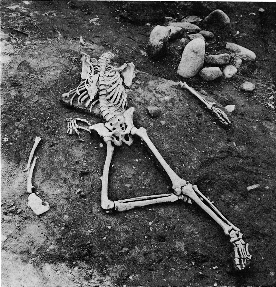
Fig. 7. I en mere fremskreden fase af udgravningen end omtalt i artiklen undersøgte adskillige grubehuse fra vikingetid. Mange nye oplysninger om denne hustypes konstruktion, indretning og anvendelse blev her ved indvundet. I tomten af et af disse grubehuse lå nær bunden et velbevaret menneskeskelet, hvis hovedskal og ene overarm dog manglede som følge af datidige forstyrrelser. De ejendommelige fundomstændigheder tyder på, at man her snarere har skaffet den døde af vejen end tilsigtet en egentlig begravelse.

In a phase of the excavation subsequent to those described in the article a number of pit-dwellings from the Viking Period were investigated. Much new information concerning the construction, inventory and use of this type of house was thereby obtained. On the site of one of these pit-houses, near the floor level, lay a well preserved human skeleton, the skull and one upper arm being absent as a result of contemporary disturbance. The remarkable circumstances of discovery suggest that the body had been "got rid of" rather than buried in a regular fashion.