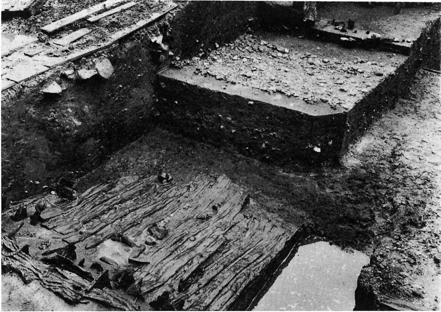
Fig. 4. De to voldgader. Plankevejen befinder sig i undergrunds niveau oven på en opfyldt grøft langs foden af vold I. Den brolagte gade er rykket et par meter ind i byen, bort fra en direkte kontakt med foden af vold III. Herved kommer den til at hvile på oldtidsaflejringerne inden for byvolden.

The two rampart roads. The plank causeway lies at original ground level above a filled-in ditch which ran at the foot of Rampart I. The cobbled street is moved a few yards into town, away from direct contact with the foot of Rampart III. It comes thereby to rest upon earlier occupation levels within the city rampart.