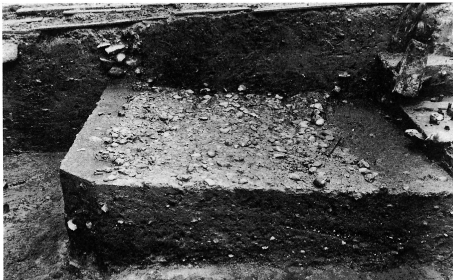
Fig. 3. Brolagt gade ved foden af vold III, men adskilt fra denne ved en grøft. Den anlagdes ved slutningen af byens oldtidsperiode og forseglar lagene fra dette tidsafsnit.

Cobbled street at the foot of Rampart III, but separated from it by a ditch. The street was laid at the end of the city's prehistoric period, and seals off the levels from that period.