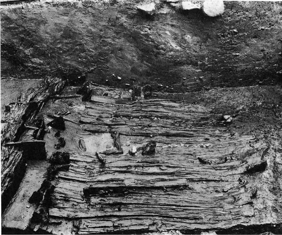
Fig. 2. Plankevej ved foden af vold II. Langs vejanlæggets venstre side ses tætstillede pæle, som har fastholdt den på fig. 1 viste planke i kantstillet position.

The causeway of planks at the foot of Rampart II. Along the left edge of the causeway the closest posts are visible which held the planks shown in Fig. 1 on edge.