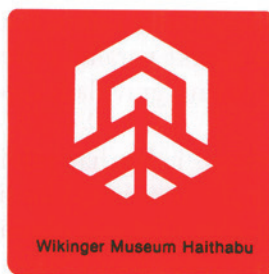
Fig. 3. Wikinger Museum Haithabu's logo.

I denne sammenhæng må man dog også komme med den kritik, at der såvel nord som syd for grænsen findes vigtige undersøgelser, som hidtil ikke er blevet bearbejdet eller publiceret. Bebyggelserne Dankirke og Drengsted er af stor betydning for udforskningen af romersk jernalder langs Jyllands vestkyst. Det ville være ønskværdigt, om dette omfangsrige materiale snart blev publiceret (Drengsted skulle dog være på vej). Der er tilsvarende eksempler på "arvegods" også syd for grænsen. Således er den omfattende bearbejdning af det rige fundmateriale fra Thorsbjerg Mose en reel mangel, specielt på baggrund af de væsentlige fremskridt, der er gjort i forbindelse med Illerup-projektet. Den rige grav fra Neudorf-Bornstein (Kreis Rendsburg-Eckernförde) er et andet eksempel. 14 Denne gravplads er især af stor betydning for den gamle landsdel Slesvig, idet der her findes en af de ganske vigtige fyrstegrave fra yngre romersk jern-